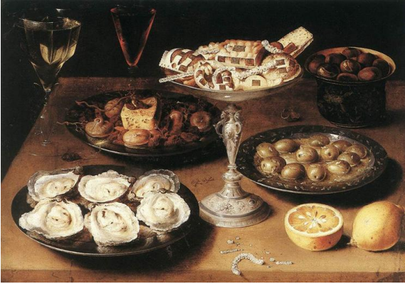
Resim 4 Osias Beert the Elde İstiridye ve Hamur İşleri ile Natürmort (1610)

Barok dönem ressamlarından önemli bir yere sahip Osias Beert the Elde (1580-1624) yaptığı yemek kompozisyonlarıyla tanınmıştır. Resimde kullandığı objeler genellikle daire formundadır. Kaseleri, bardakları simetrik bir biçimde resmin etrafında toplamıştır. Kullandığı daire formundaki kapların aksine uzun şarap bardaklarıyla şekil dengesini sağlamıştır. Nesnelere birbirlerinin üstüne binmeyecek şekilde başarılı bir biçimde dizmiştir. Sanatçının resmettiği yemek türleri genellikle ihtişamlı, güzel sunulmuş üst sınıfa ait insanlara hitap eden yemekler olmuştur. Çeşitli hamur işleri, midye, balık, yengeç gibi yemek türleri sanatçı tarafından kullanılan yemek türleridir. (Resim 4)