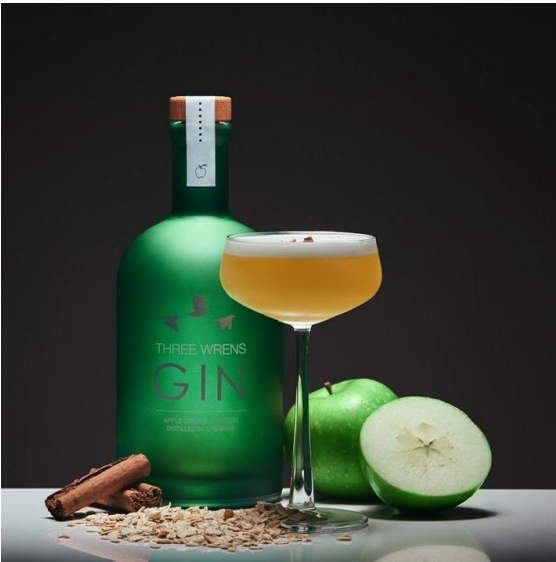
Resim 14 Emma Phillipson

Emma Phillipson'ın bir alkol markasının reklam fotoğrafı için yaptığı çalışmada da natürmort sanat akımının izleri görülür. Kompozisyonun sağ tarafında soyulmuş meyve, ortada duran kadeh, yerdeki kabuk tarçın gibi öğeler 18. Yüzyılda natürmort resimde kullanılan öğeler ile benzerlik göstermektedir. (Resim 14).