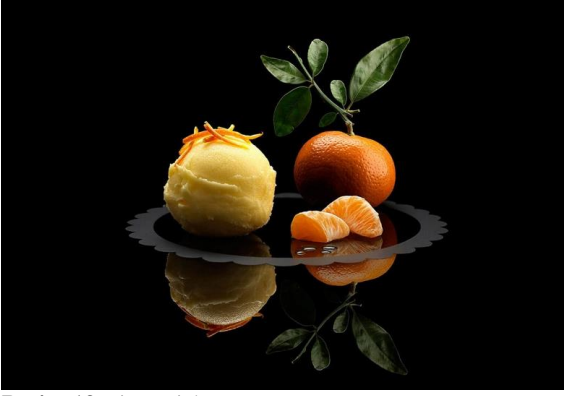
Resim 13 Diaz Wichmann