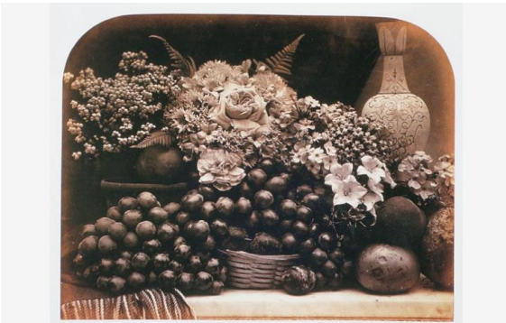
Resim 10 Roger Fenton (1819-69) Fruit and Flowers (1860)