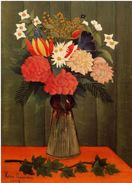
Resim 7 Henri Rousseau (1844 – 1910) Çiçek Demeti (1909 -1910)

Henri Rousseau'nun natürmort örneğine bakıldığında, yeşilin ve kırmızının ton olarak hâkim olduğu ‘Çiçek Demeti’ eserinde gerçekte üç boyutlu olması gereken bir mekânın iki boyutlu resmedildiği görülmektedir. Hem objede hem arka planda aynı tonların kullanılması ve kompozisyonun genelinde ışık ve gölgenin olmaması üç boyutluluk hissini azaltmıştır. Aynı zamanda kompozisyonun genelinde dengeli bir ton hakimdir. Çiçek türlerinin birbirlerini sağ ve sol tarafta tekrar etmesi de bu dengeye katkıda bulunmuştur. (Resim7)