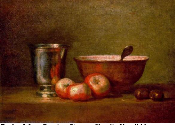
Resim 3 Jean Baptiste Simeon Chardin Kaseli Natürmort (1750)

Kaynak: https://www.istanbulsanatevi.com/sanatcilar/soyadi-c/chardin-jean-baptiste-simeon/jean-baptiste-simeon-chardin-kaseli-naturmort-132/