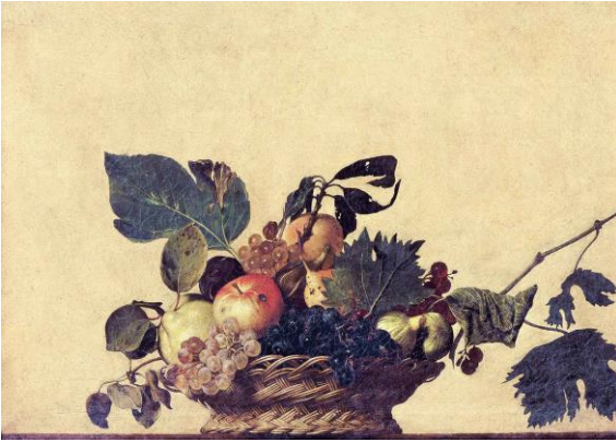
Resim 2 Michelangelo Merisi da Caravaggio (1571 – 1609) Sepetteki Meyveler

Michelangelo Merisi da Caravaggio ‘Sepetteki Meyveler’ adlı eserinde dünyevi meyveleri resmetmiştir. Bu meyveler olgun elma, armut, incir ve üzümle oluşmaktadır. Meyvelerin bazı kısımlarında oluşan çürümeler ve yapraklarındaki sararmalar hayatın kaçınılmaz sonunu göstermektedir. Meyveler süslü, parlak değildir. Her şey doğada olduğu gibidir. Doğaldır. Arka planda meyve kompozisyonunu ön plana çıkarmak için düz renk kullanılmıştır. (Resim 2)