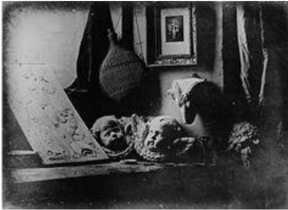
Resim 8 Louis Daguerre - L'Atelier de l'artiste – 1837

L’Atelier de l’artiste adlı eserinde Daguerre yaklaşık 15-20 dakika uzunlukta pozlama yapmıştır. Tekniğin yanında fotoğrafta sanatsal bir yaklaşım da söz konusudur. Işık ve gölgenin oluşturduğu kontrastlık, kullanılan yapay çocuk kafaları, objelerin dokuları vurgulu bir anlam katmıştır. Diğer bir deyişle Daguerre bu fotoğrafta nasıl fotoğraf üretilir sorusundan çok konunun sanatsal bağlamda üretilmesine de dikkat etmiştir. (Resim 8)