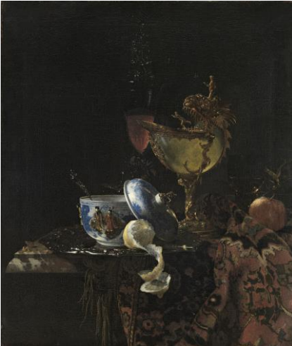
Resim 5 Willem Kalf (1619 – 1693) Notilyus Bardak Natürmortu (1662)

Willem Kalf (1619-1693) ise natürmortta daha çok ihtişamlı objeleri kullanmayı tercih etmiştir. Genellikle resimlerinde koyu tonlar hakimdir. Işık çok dar bir alandan gelmektedir. İhtişamlı objelerin yanında çoğunlukla bir soyulmuş meyveye yer vermiştir. Örnek Still Life with Nautilus Cup (Notilyus Bardak Natürmortu) isimli resmidir. (Resim 5).