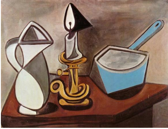
Resim 6 Pablo Picasso (1881-1973) Sürahi, mum ve güveç (1945)

20. yüzyıla geldiğimizde natürmort kübizm akımında karşımıza farklı bir teknikle çıkmaktadır. Kübist sanatçılar tek perspektif yerine çok perspektifli çalışmışlar ve natürmortu farklı açılardan resmetmişlerdir. Kübist sanatçılar, özellikle Picasso ve Braque gibi önemli sanatçılar natürmortta nesnenin sınırlarını kaldırmışlar ve nesnelere olduklarından farklı göstermişlerdir. Kübist anlayışta nesnelere bağımsızlığa ulaşılmıştır. Gazete, kitap, şişeler, bardak, sandalye gibi eşyalar kübist sanatçılar tarafından kullanılmıştır. Pablo Picasso'nun Jug, Candle and Enamel pan (Sürahi, Mum ve Güveç) adlı eseri 20. Yüzyılın natürmort sanatını göstermektedir. (Resim 6)