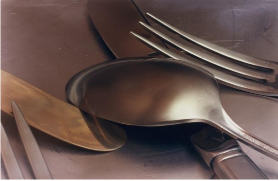
Resim 11 Jan Groover (1943-2012)

“Jan Groover (1943-2012) mutfak gereçlerini kullandığı natürmortlarıyla tanınır. Groover’ın kendine özgü bakışı spatula, kaşık, bıçak ve yumurta kapları gibi gündelik nesnelere dönüştürür ve onları sanatsal kompozisyonlar haline getirir.” (Resim 11)