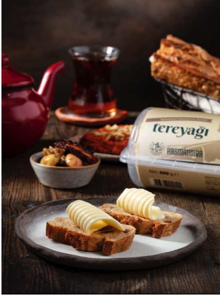
Resim 15 Mehmet Ateş

bu talepler karşısında reklam ajansları fotoğrafın gücünün farkına varmışlardır. Tüm bu gelişmeler sonucunda 1990lı yıllarda Türk reklam fotoğrafçılığı ciddi aşamalar kaydetmiştir.” 6