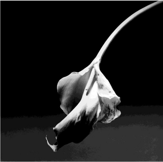
Resim 12 Robert Mapplethorpe (1946-89) Calla Lily 1986

Robert Mapplethorpe (1946-89) 1970’lerin sonlarından 1989’da yaşamını yitirdiği güne kadar geçen süreçte pek çok farklı çiçeği konu alan natürmortlar üretti. Laleler, orkideler, süsenler, afyon çiçekleri ve zambaklar onun tasvirleriyle ölümsüzleşti. Zambak fotoğrafları, 17.yyda oldukça popüler olan ”vanitas” geleneğine göndermeydi. Vanitas resim geleneğinde, zambaklar da dahil, pek çok meyve sebze yaşamın geçiciliğini sembolize eder. (Resim 12) 4