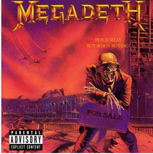
Şekil 2: 1986 - Peace Sells... But Who's Buying? albüm kapağı görseli

Megadeth'in 1986 yılında çıkan ikinci albümü "Peace Sells... But Who's Buying?" (Satılık Barışın Alıcısı/İsteyeni Kim?) bir Thrash Metal klasiği olarak gösterilmektedir. Bu albüm, Robert Dimery editörlüğünde hazırlanan ve ilk kez 2005'te yayımlanan "Ölmeden Önce Dinlemeniz Gereken 1001 Albüm" isimli müzik kılavuzu ve başvuru kitabında da yer almaktadır (Dimery, 2013).