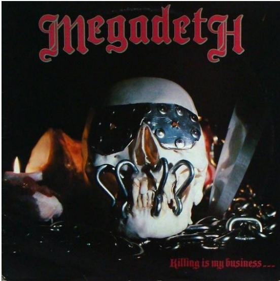
Şekil 1: 1985 - Killing Is My Business... and Business Is Good! albüm kapağı görseli