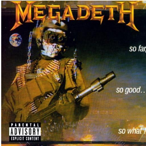
Şekil 3: 1988 - So Far, So Good... So What! albüm kapağı görseli