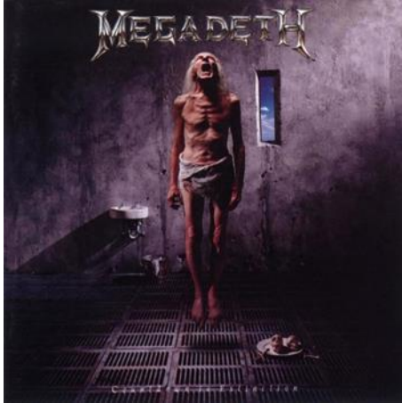
Şekil 5: 1992 - Countdown to Extinction albüm kapağı görseli

"Countdown to Extinction" Megadeth'in 1992 yılında yayınladığı beşinci stüdyo albümüdür. Albüm ismi dilimize "yok oluşa geri sayım" olarak çevrilebilir. Bu albüm Megadeth'in en başarılı albümlerinden biri olarak gösterilse de müzikal olarak Peace Sells ve Rust in Peace albümlerinin bir adım gerisinde kaldığı söylenebilir. Bunun sebebi bu albümle birlikte Megadeth'in müziğinde karakteristik değişimler başlamıştır. Megadeth piyasa koşullarına uymak ve diğer gruplarla rekabet etmek zorunda kaldığından müziğindeki agresifliği azaltmıştır. Albüm her ne kadar Thrash Metal köklerine sadık kalsa da daha geniş bir dinleyici kitlesine hitap eden melodik ve daha erişilebilir bir "mainstream", yani anaakım bir müzikaliteye sahiptir. Bunda o yıllarda etkili olan Grunge müzik akımının etkili olduğu söylenebilir (Martin, 1992).