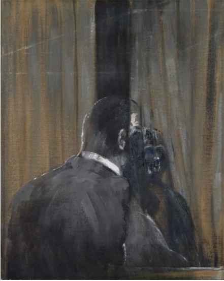
Şekil 5. Francis Bacon, Baş 4, Yağlıboya, 132.1 x 197.8 cm, Modern Sanatlar Müzesi, New York, 1946