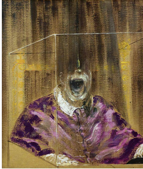
Şekil 6. Francis Bacon, Baş 6, Yağlıboya, 76.5 x 93.2 cm, Sanat Konseyi Koleksiyonu, Londra, 1949

Örnek olarak Şekil 5, altı seriden oluşan yapıtlardan biridir. Yapıt, arkası dönmüş bir baş, bir maymun ve bunları iki parçaya bölen bir perde görülmektedir. Resimde belirsiz bir çizgi fark edilmektedir. Bu çizgi perspektif biçiminde bir çerçeve görüntüsü vermektedir. Çalışmada kompozisyon ilginç bir biçimde simetridir ve bu simetrisinin resmi sınırlandırdığı görülür. Başın arka tarafında büyük uzun kara leke ve perde görülmektedir. Başın arka kısmından aşağı doğru baş ve omuz arasında bir hareket göze çarpmaktadır. Bacon genellikle resimlerinde baş kısımlarında ve resmin karanlık yüzeylerinde şeffaf etkileri kullandığı göze çarpmaktadır. Sanatçı yapıtında baş, saç çizgisi ve perde gibi kısımlarda transparan etkiler seçilebilmektedir. Bunun yanında başın kütle biçimde tasvir edilmesi üç boyutlu hissi verilmek istenmesindedir. Baş hizasından omuzun aşağı kısmında yer alan beyaz çizgi hayaletimsi bir etki bırakmıştır. Bacon resimde omuzları ve sırt gibi kısımlarda ışıklı tonlar kullanmıştır. Resmin sağ bölümünde ise boya kullanımıyla birlikte oluşturulan belirli çatlaklar gözlenmektedir (Brighton, 2013, s. 37 ).