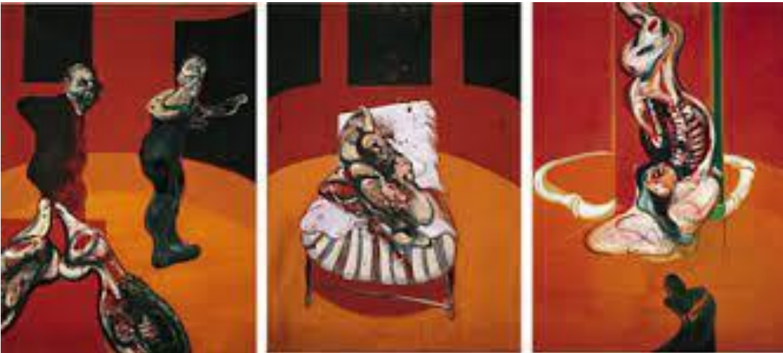
Şekil 4. Francis Bacon, Çarmıha Geriliş İçin Üç Çalışma, Triptik, 144,8 x 198,1 cm, Tuval Üzerine Mumlu Yağlıboya, 1962, New York

Sanatçının diğer bir eseri ise Çarmıha Geriliş için Üç Çalışma'dır (Şekil 4). Bu çalışma triptiktir. Bu triptik, sağ, sol panel ve ortada olmak üzere üç panelden oluştuğu görülmektedir. Sağ panelde merkezde çarmıha gerilmiş gibi duran bir et yığını bulunmaktadır. Et yığınının içi boşaltılmış veya içi açılmış bir şekildedir. Bu et yığını sanki kasapta vitrine asılmış hayvan biçimi gibidir. Dikey duran hayvan biçimindeki et yığını ve daire biçiminde boruya benzeyen ama tam ne olduğu belli olmayan bir nesne vardır. Bu nesne zemin hissini kuvvetlendirmiş ve uzam boyutu verdiği görülmüştür. Ayrıca resmin ön kısmında bir siyah leke dikkati çekmekte ve bu leke sol tarafta bulunun diğer panellerle bütünlük sağlamaktadır (Özcan, 2019, s. 894).