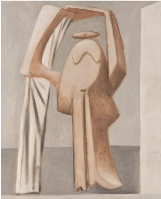
Şekil 1. Picasso, Ellerini Kaldırmış Yıkılan Kadın, 1929

Sanatçının çalışmalarında bakıldığında hem formu hem de deformasyonu bir arada kullandığı gözükmektedir. Bacon, formu klasik biçimde betimlemiş, fakat biçimi deforme ederek yeni sanatsal bir dil geliştirmiştir. Sanatçı, eserlerini oluştururken birçok sanatçıdan ilham aldığı gözükmektedir. Örneğin; Goya'dan acıyı, dehşeti ve ölüm gibi temaları ve figür biçimlerini, Grünewald'dan figürdeki dehşeti ve acıyı gösteren bedendeki değişimlerini ve Picasso'dan biyomorfik yapıyı 2 resimlerine aktardığı göze çarpmaktadır. Bacon'ın biyomorfik çizimleri bu dünya da bilinmeyen tuhaf, itici ve sıra dışı görüntüler olarak öne çıkmaktadır. Çarmığa Gerilme isimli çalışma biyomorfik biçim için iyi bir örnektir (Şekil 1-2). Bu yapıtı sanatçı, Picasso'nun "Baigneuse" adlı çalışmasından yararlanarak oluşturmuştur. Bacon, Picasso'nun biyomorfik formlarının bazılarını aynen kullandığı bazılarını ise deformasyona uğratarak değiştirdiği gözükmektedir. "Şekil 2'da iki figür vardır ve bu figürler İsa'nın çarmığa gerilme şeklinde görselleştirilmişlerdir. Ön ve arkadaki figürler aynı düzlemde yer almaktadır" (Brighton, 2013, s. 30).