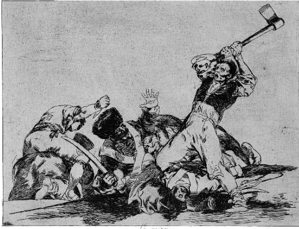
Şekil 10. Francisco Goya, Tıpatıp, Aside Suluboya, İğne Kazı Kalem, 162x223 mm, 1810-1820