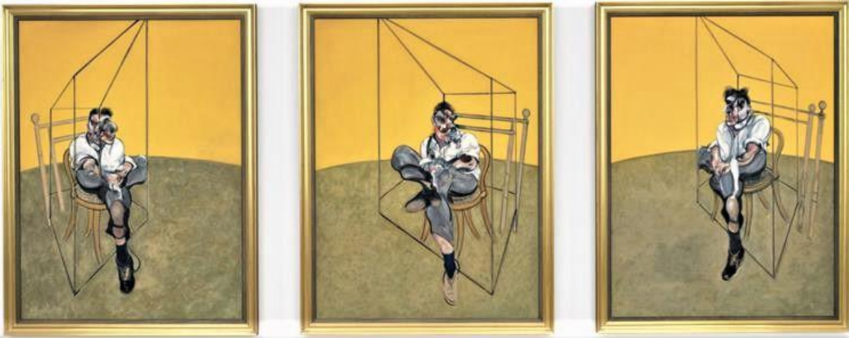
Şekil 8. Francis Bacon, Lucian Freud'un Üçlü Çalışması, Tuval Üzerine Yağlıboya, 147,5 x 198 cm, 1969, Özel Koleksiyon

Sanatçının resimlerinde renge önem verdiği ve bunu neredeyse her resminde kullandığı göze çarpmaktadır. Şekil 8'de arka zemin düz sarı renk ve zemin ise toprak rengidir. Figürün oturduğu sandalye ve etrafındaki çizgiler toprak renkten oluşmaktadır. Resimde, figürün pantolonu gri, grinin tonları, yüz ten rengi, gri, mor ve kahverengilerden oluşturulduğu gözükmetedir. Resmin genel biçimine bakıldığında farklı açılardan görülen duruş şekilleri dikkati çekmektedir. Bu duruş ayak üzerine atma biçimi olarak öne çıkmaktadır. Figürün yüzü ve vücudu deforme edilmiştir. “Resimde görülen figür, mekândan koparılmış ve geometrik sert formlarla betimlenmiştir. Yüzün özellikle yanak ve göz kısımlarında biçim bozumu vardır. Portrenin bir çizgi ile iki eşit parçaya ayrıldığı ve bu ayrılmayla farklı yüz duruşları elde edildiği söylenebilir. Gözler belirgin yapılmamış, ağız ve çene deforme edilmiştir” (Akyürek ve Beyoğlu, 2017, s.308). Bacon resimlerindeki renk kullanımına bakıldığında Edgar Degas'ın resimsel etkilerini taşıdığı gözlenmektedir. Edgar Degas'ın resimlerinde pastel renk tonlarını tercih ettiği görülmektedir. Örneğin; Bale Provası adlı çalışma sanatçının bu renk tonlarıyla oluşturduğu en güzel çalışmalarından biridir (Şekil 9).