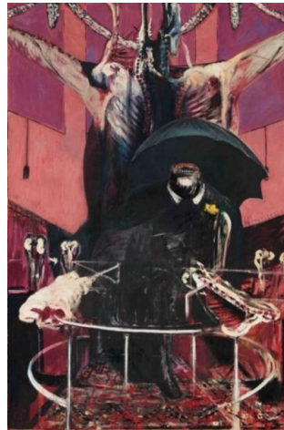
Şekil 11. Francis Bacon, Resim, Keten Yedirme Baskı, üzerine Pastel ve Yağlıboya, 132.1 x 197.8 cm, Çelik uç, Perdah Modern Sanatlar Müzesi, New York, 1946

Varoluşçuluk akım içinde farklı sanatsal alanlara bakıldığında özellikle edebiyat alanında o dönemin toplumsal sorunların yansıması görülmektedir. Örneğin; Sartre'in Bulantı romanında yer alan karakterlerin ve duygu durumlarının Bacon'un yapmış olduğu çalışmalarıyla benzerlik gösterdiği anlaşılmaktadır. Bu benzerlik dönemin ruh hali benzer-ortak olguya işaret etmektedir. Bu olgu, insanoğlunun ortak kaderi olan yaşam ve ölüm üzerinedir. Sanatçıda resimlerinde hayatın çelişkilerini gösteren resimsel imgelerini çarpıcı bir şekilde aktardığı anlaşılmaktadır (Özcan, D.Ç., 2019, s.890 ).