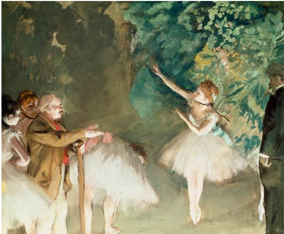
Şekil 9. Edgar Degas, Bale Provası, Kağıt, Levha Üzerine Monotip Baskı, Suluboya ve Pastel, 55,2 x 67,9 cm, 1876, Nelson- Atkins Sanat Müzesi

Sanatçının resimlerinde renge önem verdiği ve bunu neredeyse her resminde kullandığı göze çarpmaktadır. Şekil 8'de arka zemin düz sarı renk ve zemin ise toprak rengidir. Figürün oturduğu sandalye ve etrafındaki çizgiler toprak renkten oluşmaktadır. Resimde, figürün pantolonu gri, grinin tonları, yüz ten rengi, gri, mor ve kahverengilerden oluşturulduğu gözükmetedir. Resmin genel biçimine bakıldığında farklı açılardan görülen duruş şekilleri dikkati çekmektedir. Bu duruş ayak üzerine atma biçimi olarak öne çıkmaktadır. Figürün yüzü ve vücudu deforme edilmiştir. “Resimde görülen figür, mekândan koparılmış ve geometrik sert formlarla betimlenmiştir. Yüzün özellikle yanak ve göz kısımlarında biçim bozumu vardır. Portrenin bir çizgi ile iki eşit parçaya ayrıldığı ve bu ayrılmayla farklı yüz duruşları elde edildiği söylenebilir. Gözler belirgin yapılmamış, ağız ve çene deforme edilmiştir” (Akyürek ve Beyoğlu, 2017, s.308). Bacon resimlerindeki renk kullanımına bakıldığında Edgar Degas'ın resimsel etkilerini taşıdığı gözlenmektedir. Edgar Degas'ın resimlerinde pastel renk tonlarını tercih ettiği görülmektedir. Örneğin; Bale Provası adlı çalışma sanatçının bu renk tonlarıyla oluşturduğu en güzel çalışmalarından biridir (Şekil 9).