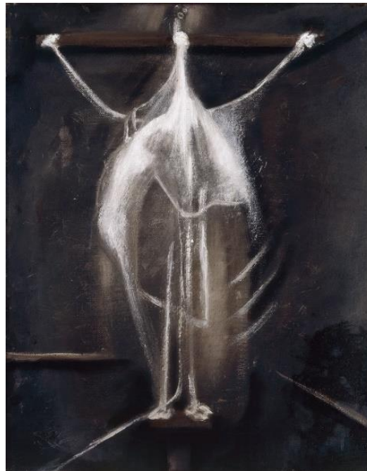
Şekil 2.Çarmıha Gerilme, Yağlıboya, 47 x 60,5 cm 1933, Murderme, Londra