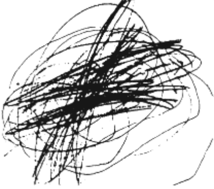
Şekil 2: İki yaş (Karalamaları) çizgileri (Kellogg)

Küçük bir çocuğun kalemle herhangi bir yüzey üzerinde bıraktığı izler onun sanatla ilk buluşmasıdır. Çoğu zaman rastgele olan bu çizgiler, belirli bir biçimsel özellik göstermezler. Karalamalar zaman zaman kâğıttan taşmaktadır. Çocuk, ilk zamanlar bu rastlantısallığın farkında değildir fakat küçük kas gelişimine paralel olarak (çizme, boyama, yırtma vs.) farkındalığı gelişmektedir. Kâğıt üzerinde bıraktığı izleri keşfeden çocuk, karalama alanını kontrol etmeye başlamaktadır. Başlangıçta dikeyler ve yataylarla başlayan bu süreç, dairesel hareketlere ve geometrik şekillere evrilmektedir. Kendi bedenini kontrol edebildiğini fark eden çocuk, çizgilerin hareketlerini de değiştirme ve bundan keyif almaktadır. Bu durum, çocuk için adeta bir oyun niteliğindedir ( Malchiodi, 1998).