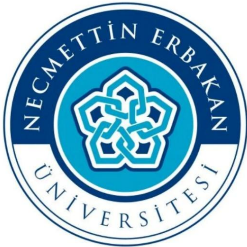
Şekil 19: Necmettin Erbakan Üniversitesi Logosu

Logonun merkezinde yer alan geçmeli yapı, yalnızca dekoratif bir motif olarak değil, kompozisyonun bütününe organize eden temel sistem olarak çalışır. Beşli yıldız kurgusu, iç içe geçen çizgiler ve merkezî denge üzerinden birlik ve süreklilik duygusu üretir. Bu yapı, Selçuklu taş ve çini süslemelerinde görülen örgülü geometrik düzenlerin çağdaş ve sadeleştirilmiş bir yorumu olarak değerlendirilebilir. Kurumsal kimlikte kullanılan turkuaz ve lacivert renkler de bu tarihi bağı güçlendirmektedir. Ayrıca, Mevlâna Müzesi'nde sergilenen sabır taşı üzerindeki geometrik geçme kompozisyonu, logoda kullanılan beşli yıldız kurgusuna oldukça yakın bir örnek sunmaktadır. Bu yönüyle logo, Selçuklu geometrisini doğrudan kopyalamak yerine, geçme ve merkezî denge üzerinden modern bir kurumsal kimlik sistemine dönüştüren güçlü bir örnek olarak değerlendirilebilir.