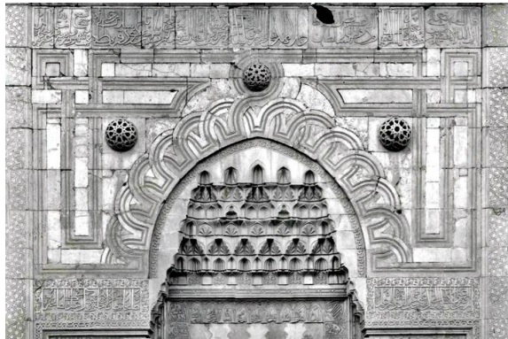
Şekil 2: Karatay Medresesi