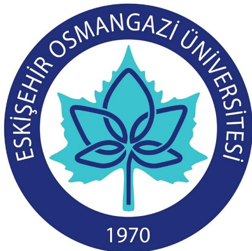
Şekil 15: Eskişehir Osmangazi Üniversitesi Logosu

Kurumsal kimlik kılavuzunda logonun teknik çizimi, logonun yalnızca sembolik değil, aynı zamanda işlevsel bir kurumsal sistem olarak ele alındığını göstermektedir. Turkuaz ve lacivert renklerin birlikte kullanımı ise logoya hem çağdaş hem de kurumsal bir görünüm kazandırır. Bu bağlamda Eskişehir Osmangazi Üniversitesi logosu, geleneksel bir motifi doğrudan kullanmayan; ancak doğadan alınan bir formu, geleneksel süslemede görülen sadeleştirme, düzen ve denge ilkeleriyle çağdaş bir kurumsal işarete dönüştüren bir ara örnek olarak değerlendirilebilir.