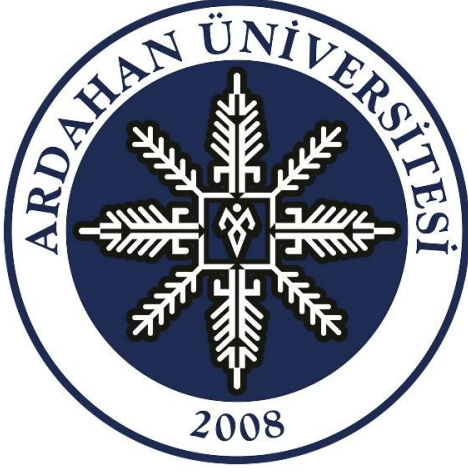
Şekil 7: Ardahan Üniversitesi Logosu

Bu bağlamda Ardahan Üniversitesi logosunda geleneksel dokuma motifi, yüzeyde kullanılan dekoratif bir ayrıntı olmaktan çıkar; kar tanesi formu içinde çoğaltılan, simetrik olarak dengelenen ve kurumsal kimliği taşıyan yapısal bir sisteme dönüşür. Logo, bölgenin Kafkasya ve Orta Asya ile kurduğu kültürel bağı çağdaş ve okunabilir bir grafik dille ifade etmektedir.