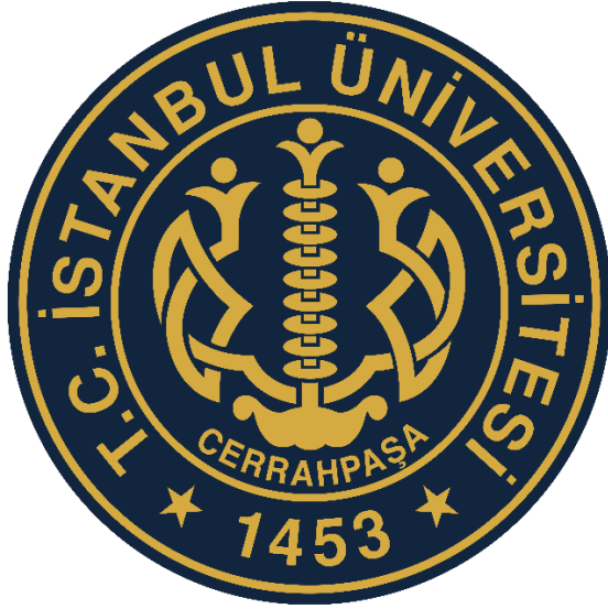
Şekil 5: İstanbul Üniversitesi Logosu

Dairesel sınır, bu üçlü yapıyı kurumsal bir mühür formu içinde toplar ve kompozisyonun bütünlüğünü güçlendirir. Bu nedenle İstanbul Üniversitesi logosunda belirleyici olan yalnızca Hayat Ağacı ve ejder figürlerinin sembolik anlamları değil, bu figürlerin eksen, simetri ve denge üzerinden oluşturduğu yapısal düzendir. Logo, geleneksel Selçuklu figür dilinin çağdaş bir kurumsal işarete kompozisyon sistemi olarak yeniden kurulabildiğini göstermektedir.