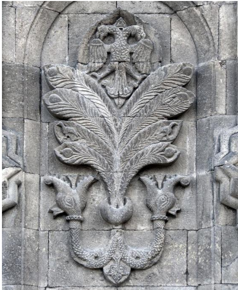
Şekil 6: Erzurum Çifte Minareli Medrese

Kaynak: İstanbul Üniversitesi Kurumsal Kimlik Kılavuzu