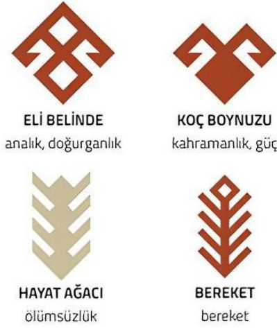
Şekil 8: Anadolu dokuma motifleri (kilim geleneği)