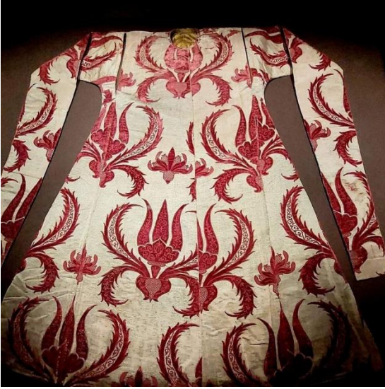
Şekil 14: Kanuni Sultan Süleyman'a ait lale motifli kaftan