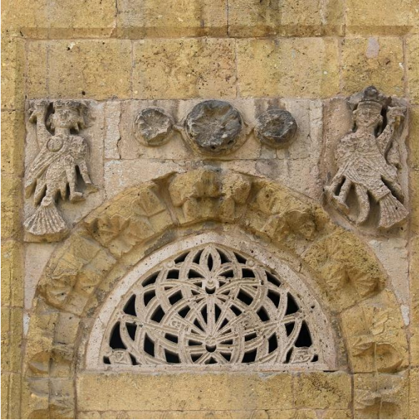
Şekil 16: Niğde Hüdavent Hatun Kumbeti, Selçuklu Dönemi