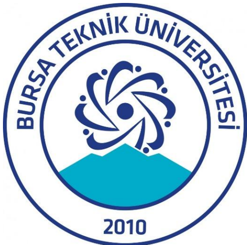
Şekil 9: Bursa Teknik Üniversitesi Logosu

Kompozisyonun alt bölümündeki Uludağ silüeti, düzenli yapıyı kesintiye uğratarak logoya yerel bir bağlam kazandırır ve Bursa'nın coğrafi kimliğini tasarıma entegre eder. Böylece logo, evrensel bir bilim dili ile yerel referansı dengeler. Bu bağlamda Bursa Teknik Üniversitesi logosu, geleneksel geometrik anlayışı doğrudan tekrar etmek yerine, onu dönüştürerek teknik bir metafora—atom formuna—uyarlayan özgün bir kompozisyon sunmaktadır.