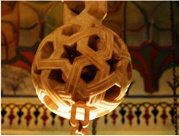
Şekil 20: Mevlâna Müzesi'nde sergilenen sabır taşı