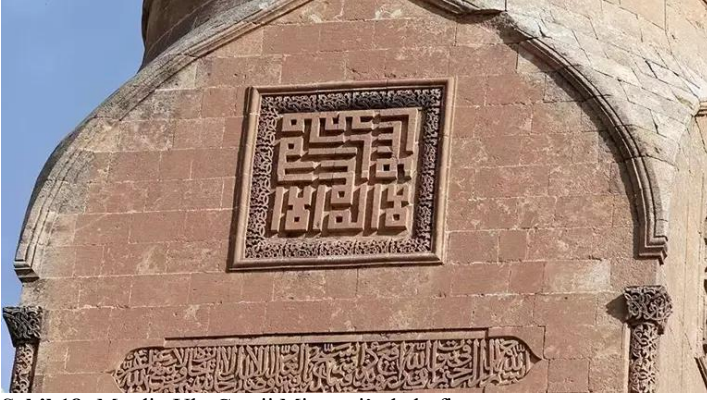
Şekil 18: Mardin Ulu Camii Minaresi'nde kufi yazı