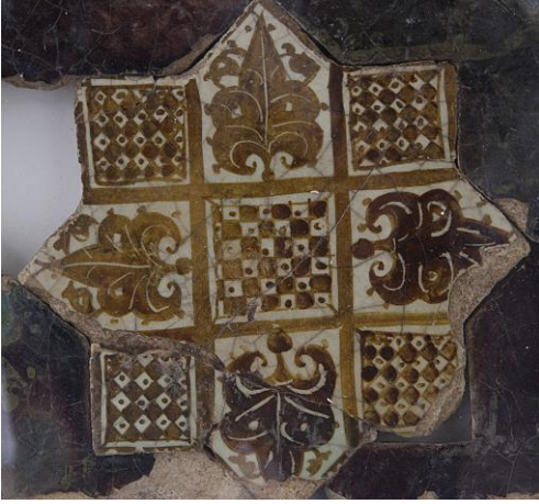
Şekil 10: Kubadabad Sarayı'na Ait Selçuklu Sekiz Köşeli Yıldız Çinisi