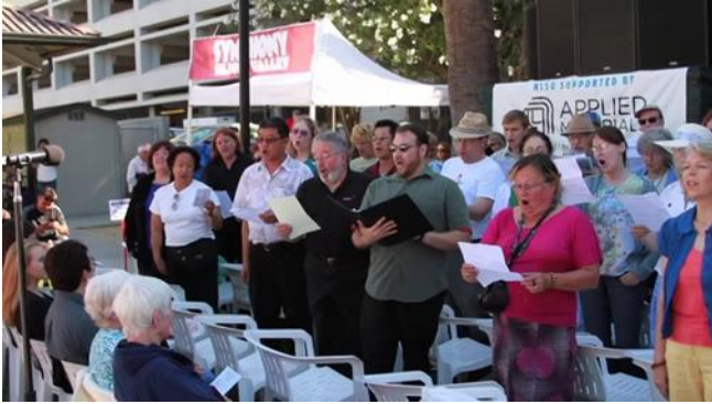
Görsel 7: Random Acts of Culture, 2015.

Amerika'daki Knight Foundation tarafından düzenlenen "Random Acts of Culture" etkinlikleri, insanların günlük yaşamlarında beklenmedik bir şekilde sanatla karşılaşmalarını sağlamayı amaçlamaktadır. Örneğin, alışveriş merkezlerinde veya havaalanlarında aniden bir koronun şarkı söylemesi veya bir dans gösterisi düzenlenmesi gibi etkinlikler insanları sanatla beklenmedik bir biçimde buluşturur. Sanatçıların veya yaratıcı bireylerin günlük ortamlarda doğaçlama veya beklenmedik sanatsal ifade gösterileriyle halkı şaşırttığı ve ilgisini çektiği etkinlikler düzenlenmektedir. Bu eylemler müzik performanslarını, dans rutinlerini, tiyatro sahnelerini, şiir okumalarını (Görsel 7), görsel sanat gösterilerini ve daha fazlasını içerebilmektedir (Random Acts of Culture, 2023).