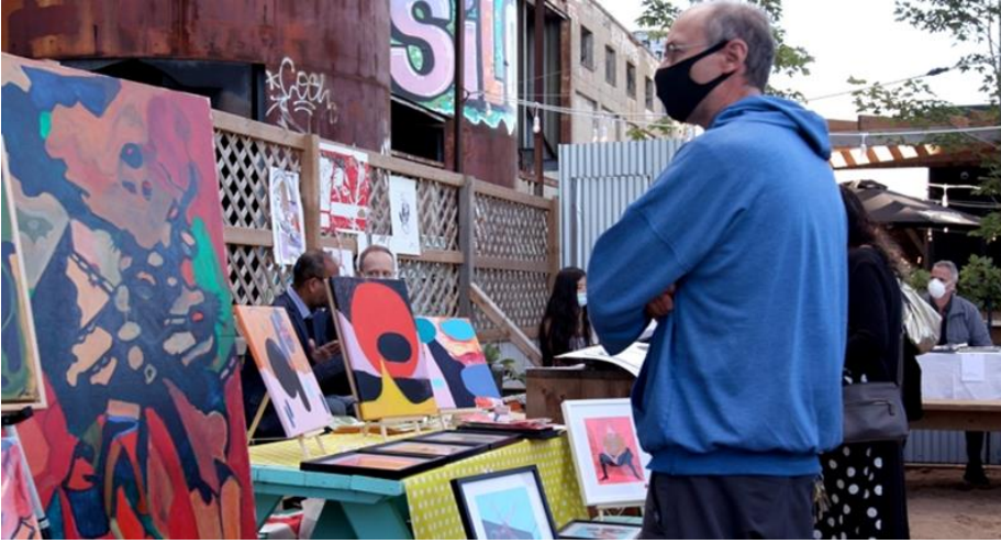
Görsel 9: Pop-up Art Exhibitions, 2012.

Bu örnekler, mecburi karşılaşmaların sanat ve kültür etkinliklerine olan katkısını destekleyen farklı uygulamaları göstermektedir ve insanların sanatla daha sık ve beklenmedik bir şekilde etkileşim kurmalarını teşvik etmek için yapılmaktadırlar.