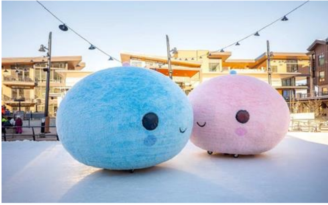
Görsel 4: Culture Nights, 2006.

“Aspen Snowmass, canlı sanat ve kültür topluluğunun uzun tarihinden ilham alarak, ‘Beklenmeyen Mekanlarda Sanat’ programını oluşturdu. Bu program sayesinde sanatsal ifadenin hem dört dağımızda hem de kasabada etkinleştirilmesi amaçlandı. Dağdaki sanat enstalasyonları, kayak bileti ve kartlarında yer alan sanat eserleri, tesiste çeşitli noktalara yerleştirilen eserler ve programın tarihini belgeleyen bir dizi kitap aracılığıyla, Beklenmeyen Mekanlarda Sanat, sohbetlere ve beklenmedik keşif anlarına yol açıyor. 2005 yılında, Aspen Kayak Şirketi ve Aspen Sanat Müzesi, çağdaş sanatı yenilikçi yollarla ve beklenmedik yerlerde daha geniş kitlelere ulaştırmak amacıyla iş birliği yapmaya başladılar ve hatta en az muhtemel konukları bile dahil etmeyi hedeflediler. 2017 yılında sanatçı Paula Crown, programı yönetmek üzere devreye girdi ve "Birlikte Tek Başına" sergisiyle başladı” (Art in Unexpected Places, 2023).