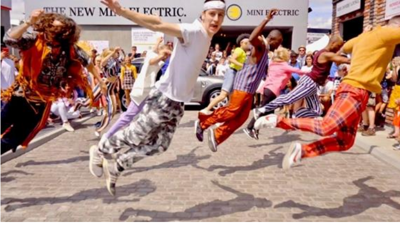
Görsel 6: Zaman İçinde Dans Eden Kulüp Çetesi Flash Mob, Goodwood Hız Festivali, 2019.