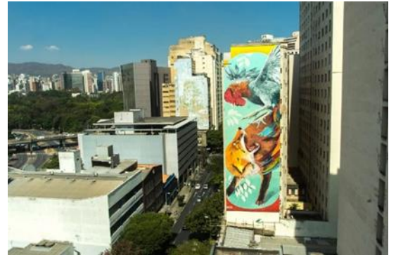
Görsel 8: CURA – Urban Art Circuit, 2017.