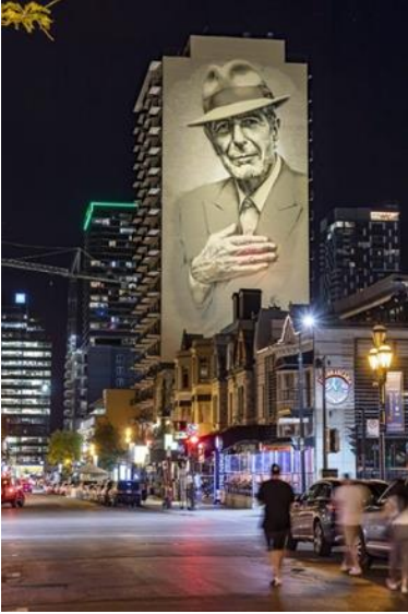
Görsel 5: MURAL festival, 2023