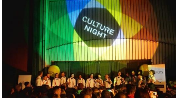
Görsel 3: Art in Unexpected Places, 2023.