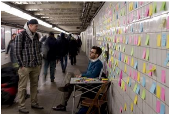
Görsel 1: Subway Therapy, 2016.

“Subway Therapy, insanların gülümsemelerine ve streslerini azaltmaya yardımcı olmayı amaçlayan sürükleyici ve etkileşimli bir çalışmadır. Barışçıl ifade, canlılık ve çeşitliliğe sahip bir topluluğun parçası olmakla ilgilidir. Bazıları için bu, bağlantılar kurmak ve sohbet etmek için bir fırsattır. Diğerleri için ise dinlemenin ve empati kurmanın bir yoludur. Birçok farklı insan için birçok şey olabilir. Subway Therapy sadece bir masa ve iki sandalye ile başlamıştır. Katılımcılar, oturmak ve hakkında konuşmak istedikleri şey hakkında sohbet etmek için davet edildiler. 2016 seçimlerinden sonra, dünyanın her yerinden 50.000’den fazla kişinin düşüncelerini yansıtan projeye yapışkan notların eklenmesiyle gelişti. Subway Therapy, halen süregelen etkileşimli ve katılımcı bir kamusal çalışmadır. New York’ta, Amerika’nın çeşitli şehirlerinde ve dünyanın çeşitli yerlerinde düzenli olarak olmayı sürdürmektedir” (Subway Therapy, 2023).