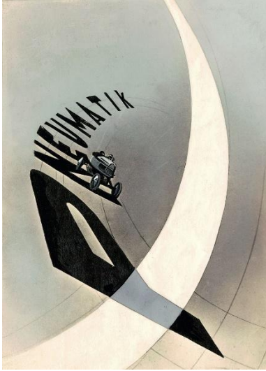
Şekil 2: László Moholy-Nagy, "Pneumatik" afiş, New York/VG Bild-Kunst, Bonn, 1923.