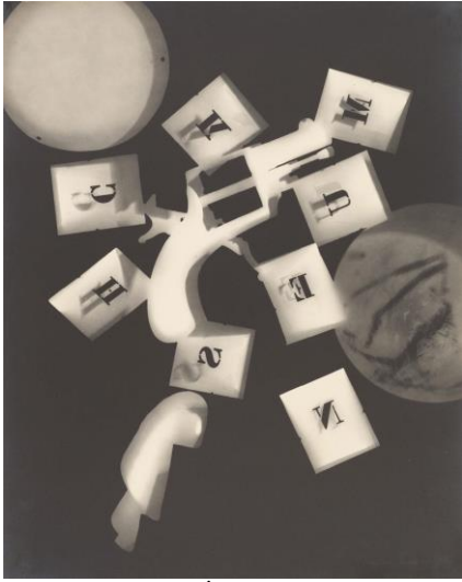
Şekil 1: Man Ray, İsimli Rayogram (Gun with Alphabet Stencils), 1924.

Man Ray (1890-1976), Dada ve Sürrealist akımlarını savunan bir Amerikan fotoğraf sanatçısı olarak karşımıza çıkmaktadır (WordPress, 2017). Ray, fotoğraflarında, çok eski bir teknik olan “rayogram” ile sıradan nesnelere tesadüf eseri ışıkla birleştirerek yaptığı deneysel kompozisyonlarıyla bilinmektedir. Işığa duyarlı kimyasal içeriği olan kağıtlar ile farklı nesnelere etkileşime geçmesi ve bu kağıtların güneş ışığına tutulmasıyla oluşturulan bir teknik olduğu söylenebilmektedir. Man Ray’in yarattığı bu fotoğraflar, izleyicinin bazen korkutucu, bazense erotik bir görüntüyü algılamasına yol açmıştır. “Stencil” yani şablonlara basılmış olan serifli harfler, afişin merkezinde yer alan silahtan ateşleniyormuşçasına bir etki verdiği gözlemlenmektedir. Afiş alanının iki tarafına yaslanmış olan formlar özel bir anlamı olmaksızın, kompozisyonu dengelemektedir (Getty Museum Collection, t.y.). Kullandığı materyaller ile dokular net bir şekilde görülmektedir ve afişe derinlik kazandırdığı söylenebilmektedir. Sanatçı ürettiği çalışmalarla tipo-foto alanına zemin hazırlayarak, Ray’den kısa bir süre sonra doğmuş olan Moholy-Nagy’e, ilham kaynağı olmuştur.