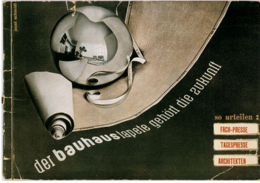
Şekil 6: Joost Schmidt, “The Future Belongs to Bauhaus Wallpaper” Başlıklı Reklam Broşürü, 1931.

küre ve kumaşın yönüyle birlikte aşağıya doğru akarak gelen tipografi olduğu görülmektedir. Tipografiye verdiği perspektifle, izleyiciye bir okuma yönü sağlamaktadır.