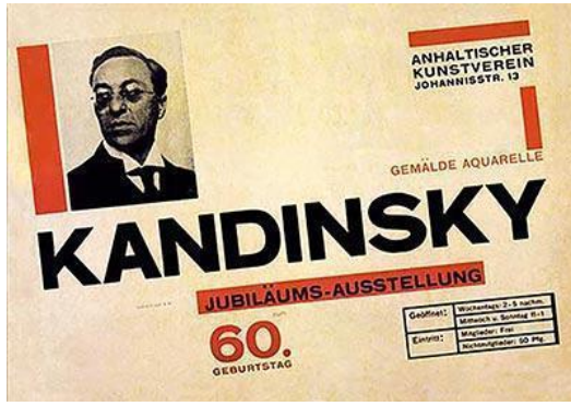
Şekil 3: Bayer, Wassily Kandinsky'nin 60. Doğum Günü Jübile Sergisi afişi, 1926.

Herbert Bayer, Bauhaus'un ön plana çıkan öğrencilerinden, öğretmenlerinden ve savunucularından biri olarak okulun felsefesini benimsemiştir. Ressam, fotoğrafçı, grafik tasarımcı ve mimar olan Bayer, sadece küçük harflerden oluşan bir yazı karakteri olan "Universal" isimli yazı karakterini tasarlamıştır (MoMA, t.y.). Bayer'in tipo-foto örneği olarak incelenebilecek işlerinden biri de Wassily Kandinsky'nin 60. Doğum Günü için tasarlamış olduğu sergi afişidir. Afişte tipografinin ön planda olduğu bir kompozisyon görülmektedir. Turuncu renkte konumlandığı şeritler, izleyiciye Bauhaus okulunun mimari yapısı hakkında bilgi vermektedir. Denge merkezini sol ve sağ yönlere doğru tasarımın kendi içinde kurmuş olduğu denge ile tasarıma farklı bir hareket getirmiştir.