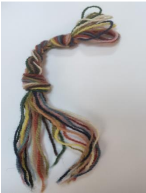
Şekil-4. Barak Kilimlerinde Kullanılan Renkler

Barak dokumalarında renkler çok canlıdır. Aynı rengin tonlarında da bu parlaklık ve canlılık göze çapraktadır (Yıldız, 2012:150).