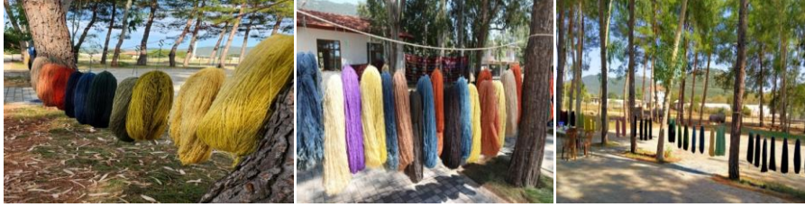
Şekil-5. Bitkisel Boyama Bitim Aşamaları