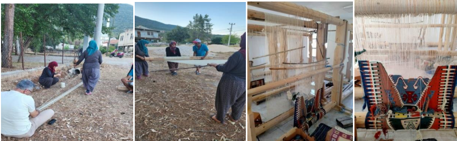
Şekil-2. Çözümlü Yapım Aşamaları

Barak Yörükleri, ürettikleri kilimlerde, kendi besledikleri hayvanların ilkbahar ve sonbahar döneminde kırılması sonucunda elde edilen yün liflerinden eğirdikleri ipleri kullanmaktadırlar. Dokuma Kilimlerde, genellikle koyunyünü tercih edilmektedir. Baraklarda dokunan kilimin kalitesi kullanılan malzemenin cinsine ve tin sayısına göre değişmektedir. Geçmişte dokumalarda genellikle elde eğrilmiş yün iplikler tercih edilmektedir (KK, Ayşe Gökçe).