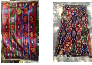
Şekil-9.a Şekil-9. b