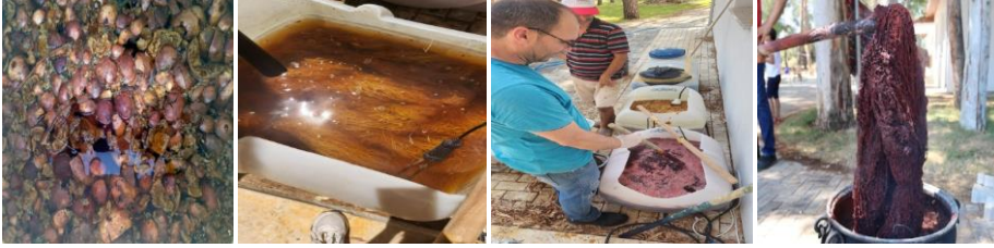
Şekil-3. Bitkisel Boyama İşlemleri

Dokumaların hemen hemen hepsinde bitkisel boyaların tercih edildiği görülmektedir. Bitkisel boya; tabiatın kendiliğinden bulunan bitki köklerinden, kabuklarından, yetiştirilen meyvelerin kabuğundan, dalından, sapından, yaprağından, tohumundan ve çiçeklerinden farklı yöntemlerle elde edilen renkli maddelere denilmektedir (Öztürk, 1999:20). Geçmişten günümüze kadar bitkisel boyamayı insanlar her alanda kullanmışlardır. Bu alanlar içerisinde sağlık, gıda sektörü de yer almaktadır (Öztürk, 1999:3) Anadolu toprakları, bitkisel boyamada kullanılacak olan hammaddeleri yetiştirmek için oldukça verimlidir. (Soysaldı, 2000:61). Sürekli ayakaltına serilen ve dolayısıyla sürtünme etkisine maruz kalan kullanım alanları gereği güneş ışığının etkisinden de direkt etkilenen kirkitli dokumalarda bu bitkisel boyaların dayanıklılığının daha fazla olması istenmektedir.