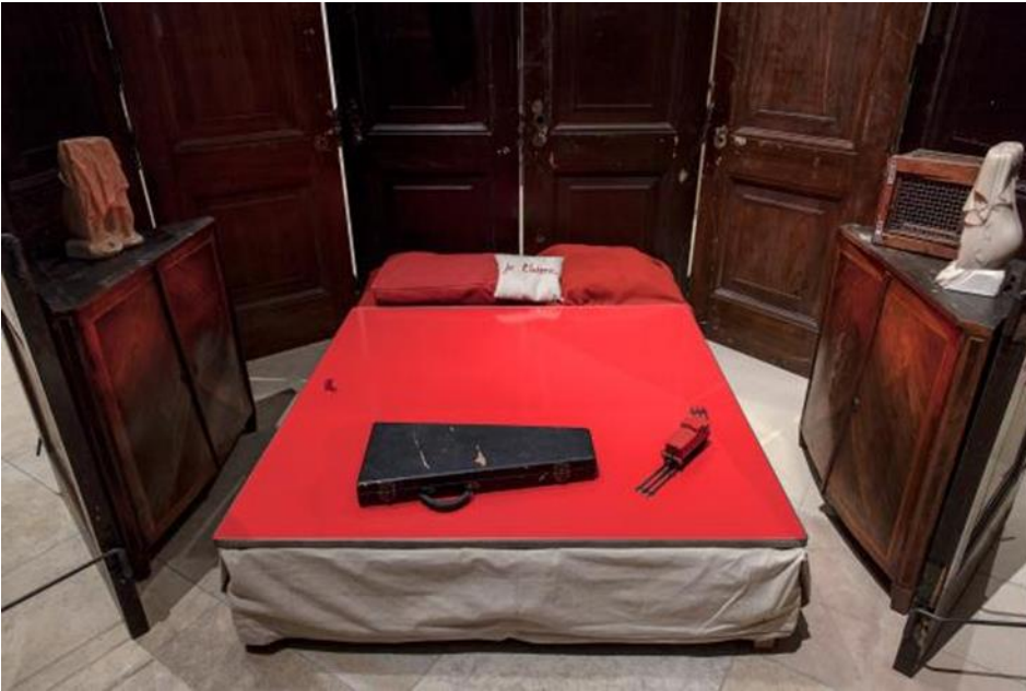
Resim4: Kırmızı Oda (Red Room) (Parents) (1994) Kırmızı Oda (Ailenin) (1994, Enstelasyon, 247.6 x 426.7 x 424.2 cm)