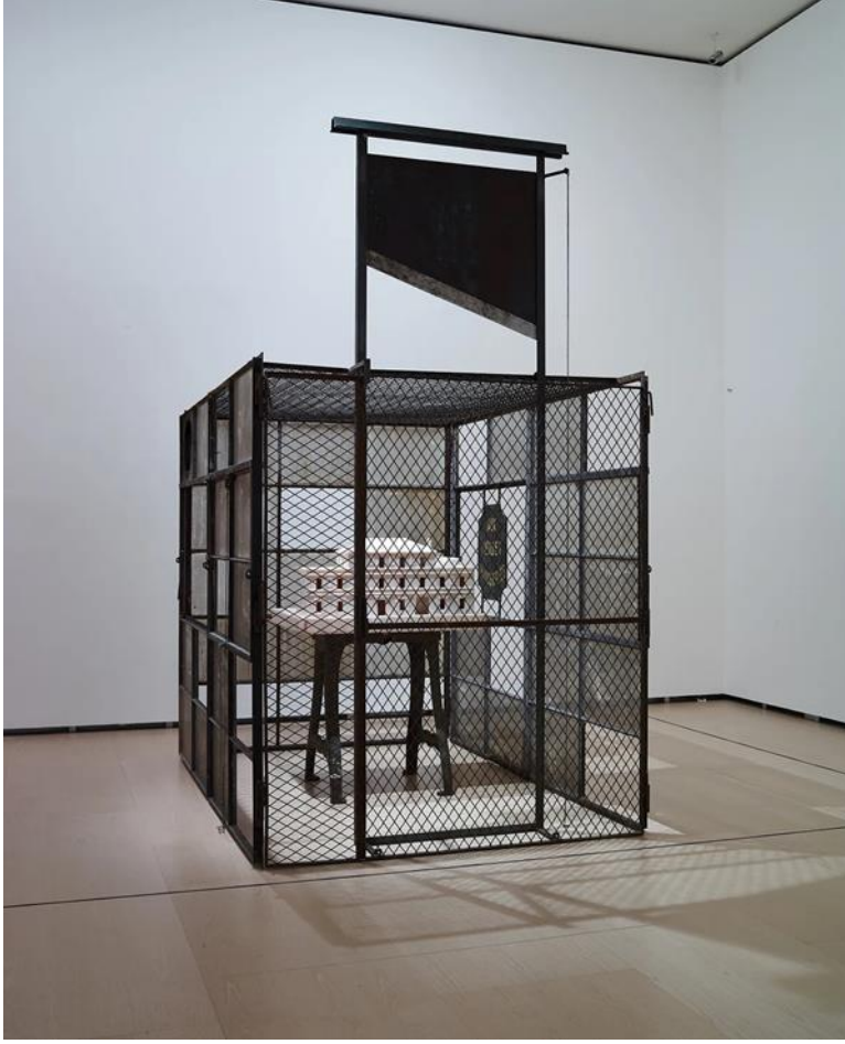
Resim5: Cell (Choisy), 1990-93

tasvir edilen hücelere dönüşmektedirler. Sanatçının enstalasyonunda kullanılan ev eşyalarına, kadınların kıyafetlerine değin inen sıkılma ve hapsolme duygusu, evi bir kaygı ve sıkıntı nesnesine dönüştürmektedir. "Bütün eserlerim ve konularım kaynağını çocukluğumdan alırım" diyen Bourgeois, çocukluğunun geçtiği evde yaşadığı travmaları sanat ürünleriyle bilince taşıyarak yaratıcılığının öncü gücünü yaratıyor (Koruç, 2018).