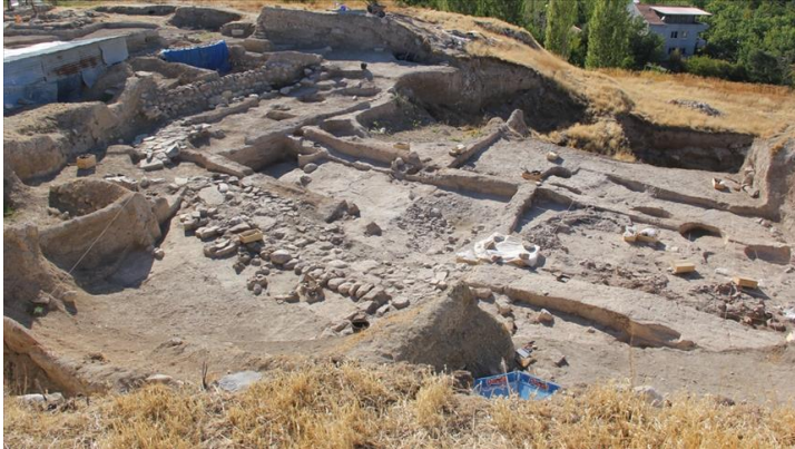
Resim 3: Arslantepe Höyüğü Kazı Alanı

Arslantep'e' de yürütölen kapsamlı kazı çalışmaları sonucunda tarihsel süreç içinde yaşanan işgallere ait farklı katmanlara ulaşılmıştır. Elde edilen buluntulardan en görkemlisi, iki saray yapısının bulunduğu dönem olduğu bilinmektedir. Bu saray komplekslerinin erken döneme ait M.Ö 3300-3000 yıllarına tarihlenen ve Mezopotamya dışında bilinen en eski saray yapılarının olduğu saptanmıştır. Saray kompleksine ait buluntulardan, bürokrasinin başladığı bir devlet düzeninin olduğu yargısına ulaşılmıştır (Frangipane, 2012: 19-40)