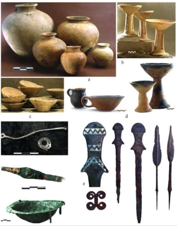
Resim 7: Arslantepe' den Çıkarılan Seramik ve Metal Objeler

Bulunan iki binden fazla öğeyle (mühür, cretula vb.) depolama ve muhasebe sisteminin güçlü olduğu işaret edilmiştir. Kilden üretilmiş bu mühürlerde tarım ve hayvancılığı simgeleyen figürler bulunmaktadır. Bu bulguyla ise toplumun geçim kaynakları ile ilgili bilgiler taşıdığı düşünülmektedir. Ayrıca yazının olmadığı dönemlerde kayıt altına alma, kilit mahiyetinde açma kapama işlemi, depo kapılarında simge, aileleri temsil etme yine bu mühürler aracılığıyla yapılmıştır. Seramik kaplar ile saklama ve depolama, kılıç ve oklar ile avcılık ve savaş, mühür baskılarının kullanılması idari yapıların varlığını, kabartmalar ise iktidarı simgelemektedir.