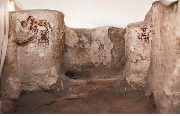
Resim 6: Arslantepe Duvar Resmi