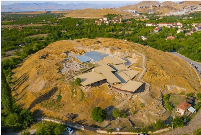
Resim 1: Arslantepe Höyüğü Kuşbakışı Görünüş

4,5 hektarlık alana sahip Arslantepe Höyüğü, Fırat Nehrinin 15 km batısında, yeşil alanların çevrelediği, 30 metrelik yükseklikte, arkeolojik yerleşimdir. Tepe noktasından Battalgazi ilçesi seyredilebilmektedir. 1932 yılında başlatılan kazı çalışmaları 1963 yılına kadar aralıklarla devam edip, 1963'den sonra ise aralıksız olarak Roma La Sapienza Üniversitesi tarafından, Kültür ve Turizm Bakanlığı izin ve desteğiyle devam etmektedir.