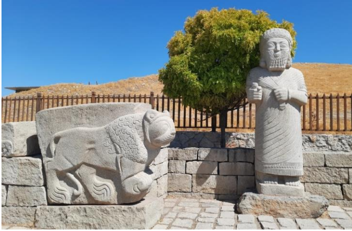
Resim 2: Kral Tarhunza Heykeli ve Aslan Heykeli

desteklenmiş, farklı dillerde yazılmış levhalar yer almaktadır. Yapıyı yağmur, kar, güneş gibi doğa olaylarından korumak için yapılan çatılama sisteminde, yük taşıma çatı konstrüksiyonlu metal direklerle sağlanmıştır. Duvar kalıntıları boyunca devam eden metal direklerin kalıntılara baskı yapmamasına özen gösterilmiştir. Açık ve kapalı alanlar için kullanılan çatı malzemesi birbirinden farklıdır. Ayrıca kazı çalışmaları devam ettiğinden, modüler çatı sistemi sayesinde yeni buluntular da koruma altına alınabilecektir.