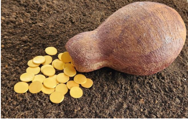
Resim 14: Seramik Testi, Pul Ø 3 cm- Testi 28 cm, 2023

Toplumun sosyal yapısındaki deęişiklik ve tarihi dönemlere göre form, malzeme, boyut ve şekillendirme teknięi olarak farklılık gösteren çanak çömlek yapımı ve kullanımı oldukça yaygındır. Höyükten çıkarılan, günlük yaşamın kullanım aracı olan seramik kaplardan yola çıkarak, temsili olarak şamot çamuru ile Görsel 14’deki seramik testi, stoneware çamuru ile Görsel 15 ve 16’daki çanaklar şekillendirilip, 1050 °C sırlı pişirim yapılmıştır. Tasarımlar, pişmiş topraktan yapılmış simgesel altın pullarla desteklenerek de farklı kompozisyonlar oluşturulmuştur.