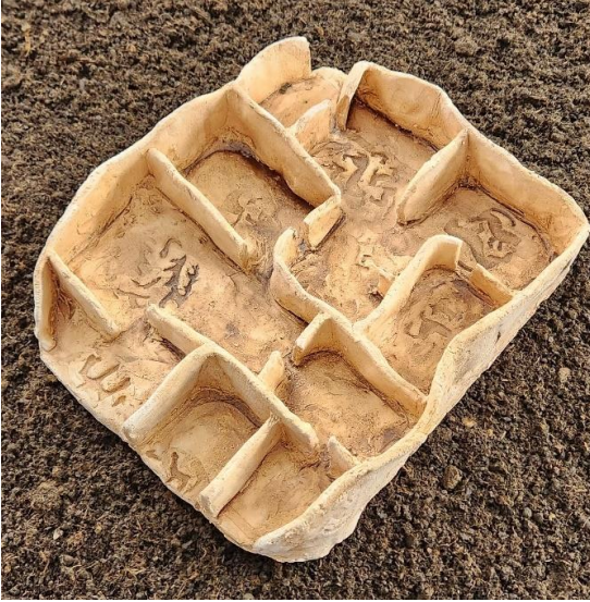
Resim 9: Arslantepe Höyüğü Kerpiç Yapılaşma Planı, 27x30 cm, 2023