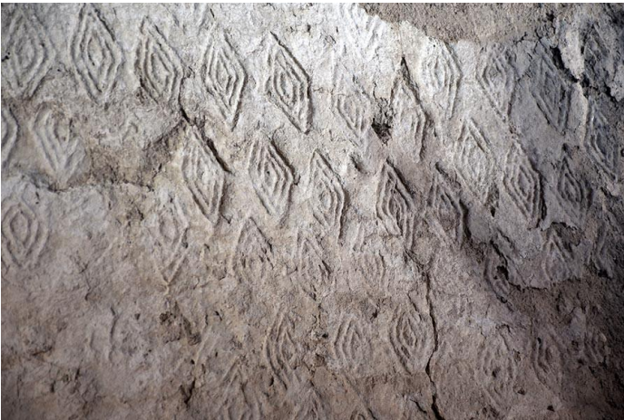
Resim 5: Arslantepe Saray Duvarı Damgalı Baklava Motifi

Arslantepe 'de yaşamın ikinci dönemi M.Ö 1000 yılın başlangıcı olan Neo-Hitit dönemidir. Bu dönemde Arslantepe başkent olmuş, anıtsal yapılar ile yerleşim yerinin Arslantepe olarak anılmasını sağlayan heykeller ve kabartmalar bu dönemde yapılmıştır. (Tuna, 2017: 4) Savaş ve askeriyeyle ilgili ilk işaretlerin görüldüğü, 3 metre yüksekliğindeki kerpiç duvarlar, resimlerle ve sıvalı süslemelerle bezenmiş, damgalı baklava motifleri, duvarlardaki orijinal sıvalar ve zemin döşemeleri ise yer yer görülebilmektedir.