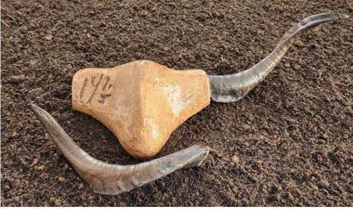
Resim 11: Kafatası Heykeli, 18x46 cm, 2023