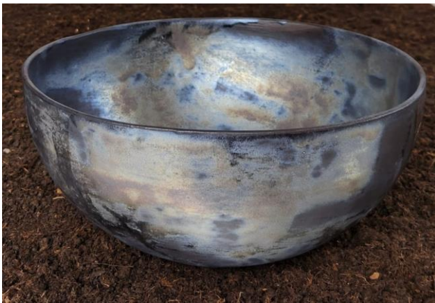
Resim 16: Seramik Çanak, Ø 26 cm- h 12 cm, 2023

Höyükte yapılan kazılarda, dünyada kılıç kullanımının ilk örnekleri arasında yer alan kılıç, mızrak gibi farklı boyutta ve fonksiyonda kullanılan savaş ve avcılık aletleri bulunmuştur. Bu aletlerin boyut ve formunun askeri hiyerarşiye göre şekillendirildięi düşünülmektedir. Metal eritme teknięi kullanılarak yapılan aletlerin üzerinde el işçilięi gümüş süsleme unsurlarına rastlanmıştır. Ayrıca bakır, kurşun, altın gibi değerli dięer madenlerin kullanıldıęı da görülmektedir. Görsel 17 örneğinde stoneware çamuru kullanılarak temsili şekillendirilen kılıç, 1050 °C derece sırlı pişirim yapılmıştır.