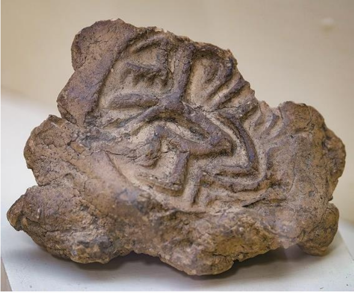
Resim 8: Arslantepe' den Çıkarılan Kil Mühür Baskı Örneği