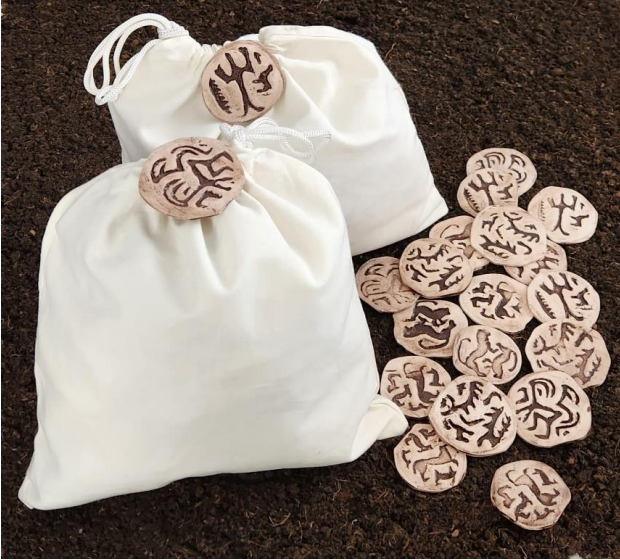
Resim 12: Yuvarlak Mühür Baskılar, Mühür Ø 7 cm- Bez Torba 35x37 cm, 2023

İdari sistemin varlığını kanıtlayan, mal ve malzemenin depolanması ve yeniden dağıtımında kullanılan kapların ve bez torbaların ağız kısmını kapatmak için kullanılan, binlerce sayıda ve ağırlıklı olarak insan ve hayvan soyutlamalarından oluşan desenlerle, yazının icadından önce yapılmış ve kullanılan mühürler, höyükten çıkarılan en detaylı anlatıma ve işçiliğe sahip buluntulardır. Görsel 12 ve 13 örneğinde mühürler, yuvarlak ve silindirik mühür desenlerinden yola çıkarak, kalıp baskı yöntemi kullanılarak stoneware çamuruyla temsili olarak şekillendirilip, 1040 °C derece sırlı pişirim yapılmıştır. Yardımcı malzeme olarak kullanılan bez torbalarla da geçmişteki kullanımına uygun bir kompozisyon oluşturulmuştur.