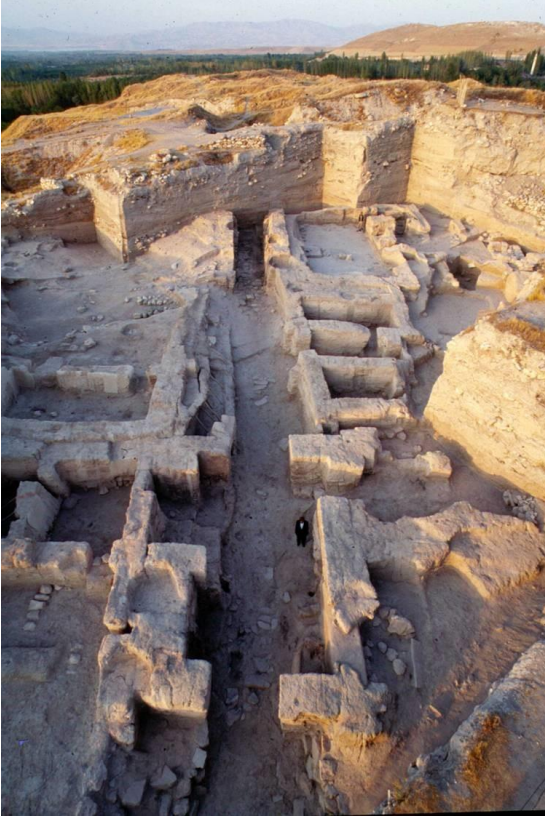
Resim 4: Arslantepe Höyüğü Saray Yapılanması

Kamu yapılarının zaman içerisinde değişikliğe uğrayarak külliye tarzı bir yapıya dönüştüğü, arkeolojik çalışmalarla kanıtlanmıştır. Özellikle dini, ekonomik ve yönetsel olmak üzere üç külliye inşa edildiği düşünülmektedir. Yapı, genişlik ve büyüklük olarak öne çıkar ve tapınak veya saray külliyesinin ilk örneğidir. (Frangipane, 2002: 270)