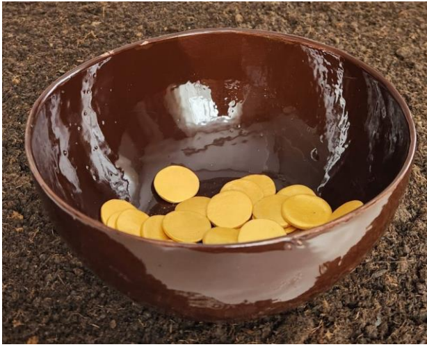
Resim 15: Seramik Çanak, Ø 21 cm- h 10 cm, 2023 Kaynak: Yazar tarafından üretilmiştir.