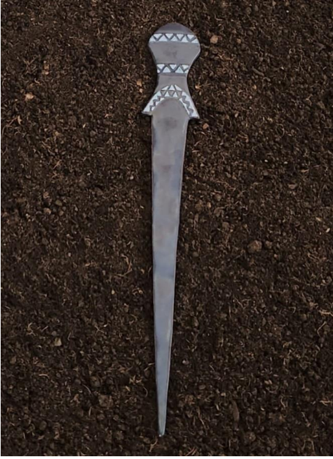
Resim 17: Seramik Kılıç,48 cm, 2023