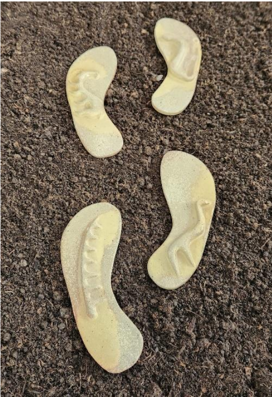
Resim 10: Seramik Ayak İzi, 18 cm, 2023

Bir coğrafyada, canlıların hangi yıllarda varlık gösterdiğini kanıtlamanın ilk yolu bulunan iskelet ya da kemik parçalarının analizidir. Höyük kazı alanında, küp içinde gömülü halde bulunan çocuk iskeleti, Malatya Arkeoloji müzesinde izleyicilerle buluşmaktadır. İnsana ait izlerin yer aldığı höyükte, Görsel 10 örneğinde bellekte kalan sembolik anlamdan yola çıkarak, insanı simgeleyen ayak izi formu tasarlanmış, stoneware çamuru kullanılarak, üzerine mühür baskı desenleriyle süslenerek, 1050 °C derece sırlı pişirimi yapılmıştır.