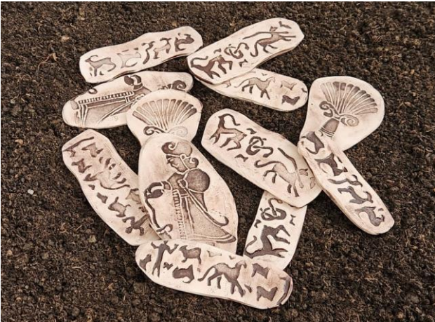
Resim 13: Silindirik Mühür Baskılar, 17 cm, 2023