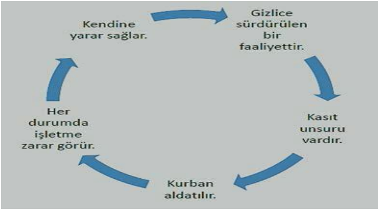
Şekil 1: Hile Kavramının İçerdiği Özellikler.

Kaynak: Özeroğlu, A. İ. (2014). Finansal Aldatmaca ve İşletme Hileleri. Akademik Sosyal Araştırmalar Dergisi, Sayı 2, ss. 180-196.