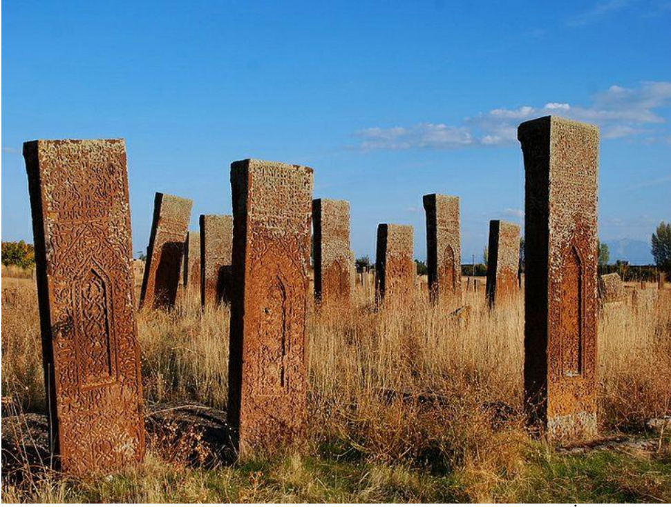
Fotograf 3. (Talat Tekin, Orhon Yazıtları: Kül Tigin, Bilge Kağan, Tunyukuk , İstanbul 1995).

Hazirelerin çevresinde diğer aile fertlerinin heykelleri ve taşların bulunması, buranın bir bakıma aile haziresi olduğunu ortaya çıkarmıştır. Diğer dinlerin etkisinde olan Uygur Türklerinin de insanı kabre koyma şekli farklılaşmaya başlasa da, üstü kubbe ile örtülü mezar şekillerinde bir değişme olmamıştır. Uygurlulardan başlayarak İslamiyet’i kabul eden Karahanlılar’la mezar ve ölüyü defnetmek kültürü Büyük Selçuklular ve Osmanlılar döneminde de yaşatılmaya çalışılmıştır.