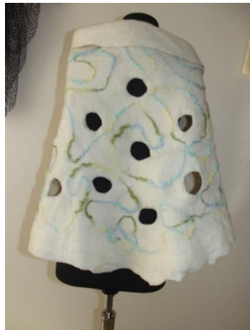
Görsel 25. Keçe panço, Ata Arşivi, (2022).