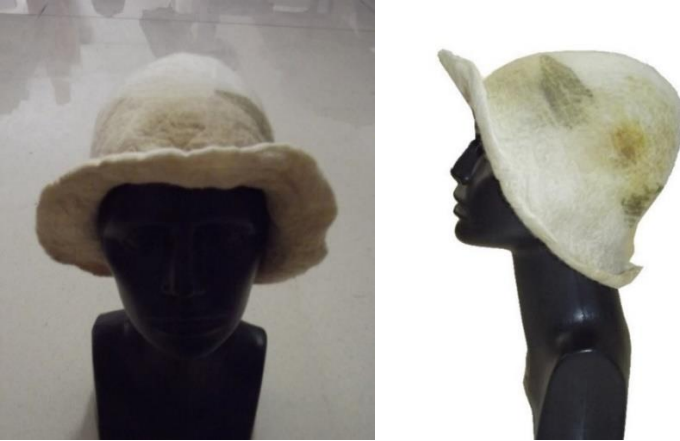
Görsel 29. Ekoprint tekniği ile tasarlanmış keçe şapka, Ata Arşivi, (2022).