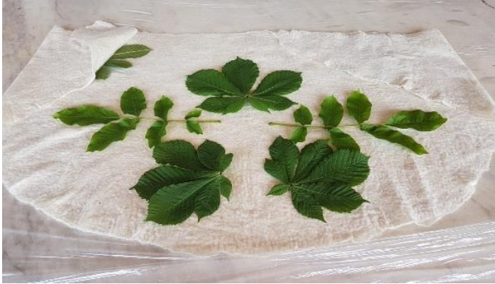
Görsel 2. Bitkilerin keçe üzerine yerleştirilmesi, Yalçinkaya, (2022).

Ekolojik baskıda dikkat edilmesi gerekenler, bitkilerin doğal renginin ve yapısının mevsime göre değişiklik gösterdiği gibi her farklı mevsimde toplanan bitkilerin kumaşa farklı tonlarda renkler vereceğidir. Doğaya zarar vermemek amacıyla olabildiğince ağaçtan dökülen yapraklar tercih edilmelidir. Toplanan bitkilerin kuru olması, kumaşa vereceği rengin de cansız ve soluk olması anlamını taşımaktadır. Bunun için toplanacak bitkilerin kurumamış olmasına özen gösterilmelidir. Bitkilerin toplanmasının ardından uygulamanın yapılacağı keçe kumaş serilmektedir. Serilen keçe kumaşın üzerine toplanan bitkiler istenilen kompozisyon doğrultusunda yerleştirilmektedir. Yalçinkaya'nın uyguladığı kompozisyon örneği görsel 4'te verilmiştir. Bu esnada kompozisyonun estetik bir görünüme sahip olabilmesi ve bir bütün olabilmesi için hangi bitkinin hangi renk vereceği konusunda bilgili olmak gerekmektedir ve kompozisyon bu unsurlar göz önünde bulundurularak oluşturulmalıdır. Adaçayı, civanperçemi, kekik, papatya ve soğan; sarı, yeşil ve hâkî rengini, ceviz; kahverengini, defne ve ıhlamur; sarı, kahverengi, hâkî rengini, havacıva otu; kırmızı, mor, kahverengini, ısırgan otu; kirli sarı, siyah rengini, kantaron; turuncu, yeşil, hâkî rengini, sumak; kahverengi, yeşil, hâkî rengini vermektedir.