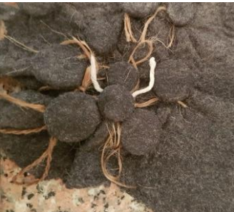
Görsel 12. Keçeye düğmeler bağlanması, (2022).

Shibori tekniği, yünün keçeleşme işlemi tamamlanmadan önce, ham keçenin yüzeyine düğme, para, misket gibi üç boyutlu, hacimli araç gereçlerin ham keçeye sarılarak bağlanması daha sonra keçeleşme işlemi tamamlayıp kuruttuktan sonra bağlanan araç gereçlerin tekrar çıkartılması sonucunda keçenin bağlanan gereçlerin formunu almasıdır. Görsel 12’de farklı boyutlardaki düğmelerin keçeye ip yardımı ile bağlanıp düğümlemesi, görsel 13’te kuruyan keçenin düğümlerinin açılması, görsel 14’te ise uygulanan shibori tekniğinin yelek üzerindeki son görünümü verilmiştir.