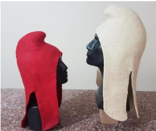
Görsel 22. Frig başlıklarından esinlenilerek üretilen başlık, Kaynak: Yalçınkaya (2022).