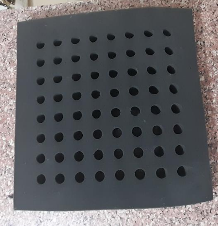
Görsel 15. Upwolving tekniği için kullanılan delikli mat, Ata Arşivi, (2022).

Upwolving tekniğini diğer tekniklerden ayıran en önemli özelliği yüksek dokusunun olması ve istenildiğinde rengârenk bir görünüm elde edilebilmesidir. Uygulama şekli de diğerlerinden farklıdır. Birinci aşama; tek renk ya da birden fazla renkteki ham keçe tabakalar üst üste konularak, delikli matın deliklerinden sıkıca geçecek kalınlıkta, rulo haline getirilmektedir. Burada dikkat edilmesi gereken detay, en alttaki tabakanın bir sonraki aşamalarda zemin için kullanılacak olan ham keçe ile aynı renkte olması gerektiğidir. İkinci aşama; delikli matın üzerine ham keçe tabaka serilmekte ve serilen keçenin matın deliklerine gelen kısımlarına bir materyal yardımı ile oyuklar açılmaktadır. Üçüncü aşama; delikli mat altta, serilen ham keçe üstte olması şartı ile rulo halinde getirilen ham keçeler, el veya bir materyal yardımı ile oluşturulan deliklere itelemek suretiyle sıkıca yerleştirilmektedir. Keçenin matın deliklerine sıkıştırılması görsel 16'da verilmiştir.