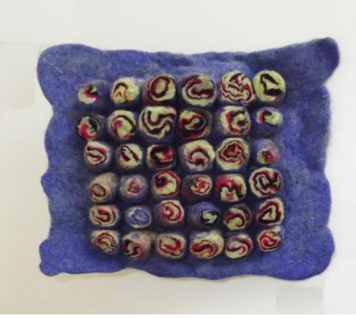
Görsel 18. Upwolving tekniği ile yapılan keçe, Ata Arşivi, (2022).