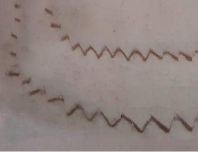
Görsel 6. Kertik detayı, Ata Arşivi, (2022).