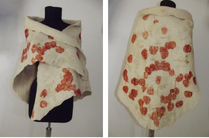
Görsel 27. Ekoprint tekniği ile tasarlanmış keçe omuz şalı, Ata Arşivi, (2022).