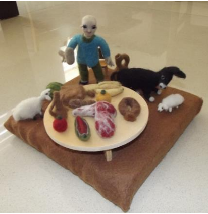
Görsel 19. Keloğlan ve eşeği Karakaçan figürlerinin yer aldığı köy hayatı