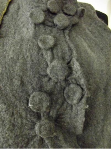
Görsel 13. Keçe kuruduktan sonra iplerin çözülerek düğmelerin çıkartılması, Ata Arşivi, (2022).