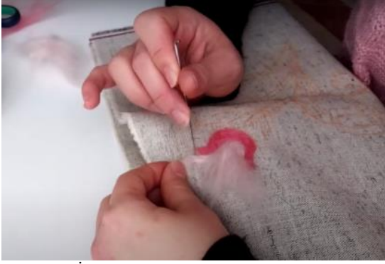
Görsel 11. İğneli nakış uygulaması.

Keçe nakışında gerekli olan ilk uygulama, keçe zemin üzerine desen çizimidir. Bunu yaparken iki yöntem uygulanmaktadır. Birincisi; direkt olarak kalem gibi renk veya iz bırakacak bir malzeme yardımı ile zemine desen çizmektir. İkincisi ise bir kâğıt üzerine kurşun kalem ile desen çizilip bu kâğıdı ters çevirerek zemin üzerine bırakmak ve sert bir cisim ile zikzak veya dairesel hareketlerle desen üzerine baskı uygulamaktır. Bu sayede kağıttaki desen zemine geçmektedir. Son aşama olarak, desen çizilmiş olan keçe ya da kumaş, kauçuk üzerine serilmektedir. Tercih edilen renkte bir miktar yünü, desen üzerine tutup istenilen bölgelere iğneyi batırıp çıkararak yünün zemine sabitlenmesi sağlamaktadır. Bu uygulamada dikkat edilmesi gereken unsur ise iğnenin tamamını zemine geçirmeden yalnızca iğnenin tırtıklı kısmını batırmaktır. Keçe iğneleme tekniği uygulama görsel 11’te yer almaktadır. Bu sayede yünün bir kısmı altta bir kısmı üstte kalarak zemine daha sağlam tutunabilmekte ve daha uzun ömürlü olabilmektedir.