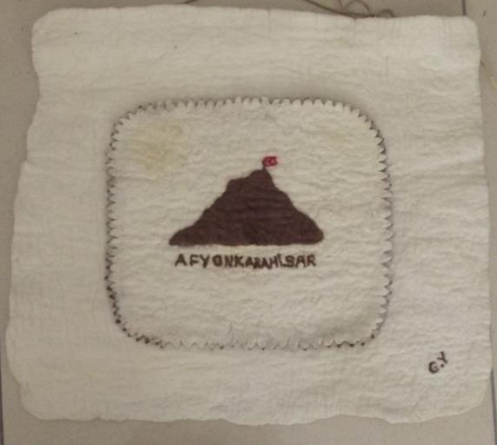
Görsel 28. Kertikli keçe tablo, Ata Arşivi, (2022).