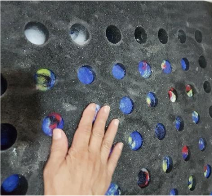
Görsel 16. Rulo keçenin deliklere sıkıştırılması, (Yalçinkaya, 2019: 265).

Upwolving tekniğini diğer tekniklerden ayıran en önemli özelliği yüksek dokusunun olması ve istenildiğinde rengârenk bir görünüm elde edilebilmesidir. Uygulama şekli de diğerlerinden farklıdır. Birinci aşama; tek renk ya da birden fazla renkteki ham keçe tabakalar üst üste konularak, delikli matın deliklerinden sıkıca geçecek kalınlıkta, rulo haline getirilmektedir. Burada dikkat edilmesi gereken detay, en alttaki tabakanın bir sonraki aşamalarda zemin için kullanılacak olan ham keçe ile aynı renkte olması gerektiğidir. İkinci aşama; delikli matın üzerine ham keçe tabaka serilmekte ve serilen keçenin matın deliklerine gelen kısımlarına bir materyal yardımı ile oyuklar açılmaktadır. Üçüncü aşama; delikli mat altta, serilen ham keçe üstte olması şartı ile rulo halinde getirilen ham keçeler, el veya bir materyal yardımı ile oluşturulan deliklere itelemek suretiyle sıkıca yerleştirilmektedir. Keçenin matın deliklerine sıkıştırılması görsel 16'da verilmiştir.