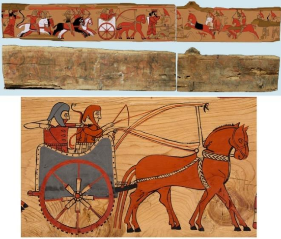
Görsel 1. Afyonkarahisar’ın Dinar ilçesi Tatarlı beldesinde çıkarılan tümülüs ahşap parçaları ve üzerinde keçe başlıklı figür resimleri, tarihvarkeoloji (2014).