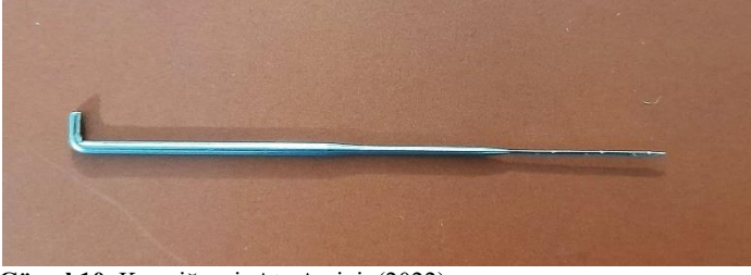
Görsel 10. Keçe iğnesi, Ata Arşivi, (2022).

dolayı yünün üzerine batırıldığı taktirde, yün iğne ile beraber keçe tabakadan geçer fakat iğneyi tekrar çıkartırken yün ile beraber çıkmaz. Bu sayede yün, tabaka ile birleşmiş olur.