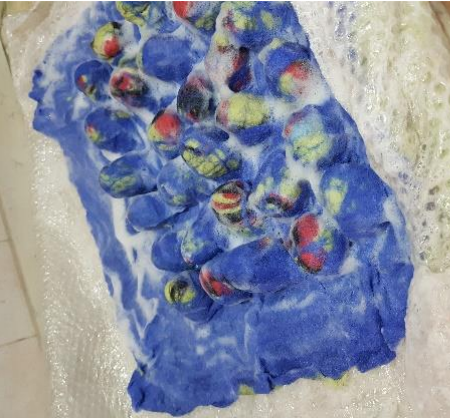
Görsel 17. Mattan çıkartılan ham yünün keçeleştirilmesi, (Yalçinkaya, 2019: 265).

Dördüncü aşama; iteleyerek yerleştirilmiş rulolar, zemin hizasında olacak görselde kesilmektedir. Beşinci aşama; kesilen zeminin üzerine bir kat daha ham keçe serilmektedir. Altıncı ve son aşama ise ılık su ve sabun yardımıyla ham keçenin keçeleşmesi sağlanmaktadır. İşlemi bitmiş olan keçeyi deliklerden itekleyerek keçenin mattan ayrılması sağlanmaktadır. Mattan çıkartılmış keçe, görsel 17'de verilmiştir. Son olarak keçe, bir naylona sarılarak ve farklı yönlerde yuvarlanarak keçeleşme sağlanmakta daha sonra makasla keserek net bir görünüm elde edilmektedir. İşlemi bitmiş olan keçenin makasla kesilmiş şekli görsel 18'de verilmiştir.