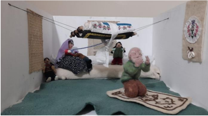
Görsel 21. Anadolu kültürünün ev ortamını yansıtan figürler, Ata Arşivi, (2022).