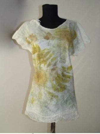
Görsel 24. İpek kumaş üzerine ekoprint ve kumaş keçeleştirme teknikleri ile tişört tasarımı, Ata Arşivi, (2022).