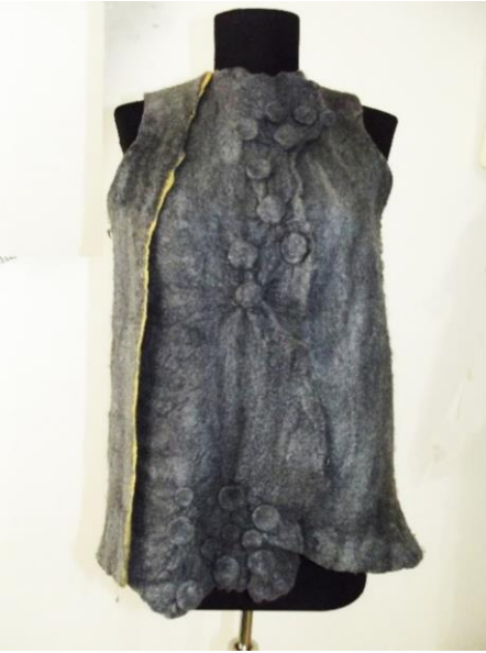
Görsel 14. Shibori tekniği ile yelek yapımı, Ata Arşivi, (2022).