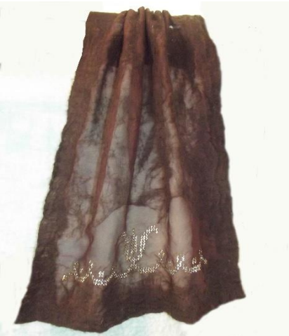
Görsel 7. Kumaş keçeleştirme tekniği ile fular yapımı