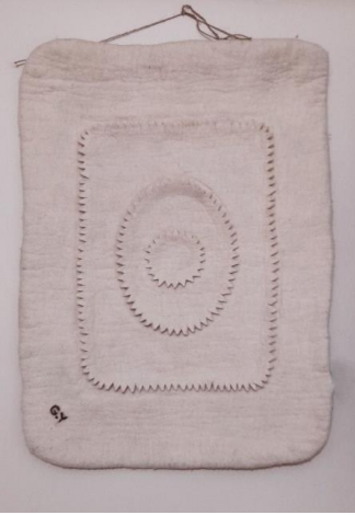
Görsel 5. Kertikli keçe, Ata Arşivi, (2022).