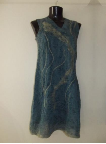
Görsel 23. İpek kumaş ile keçe giysi.