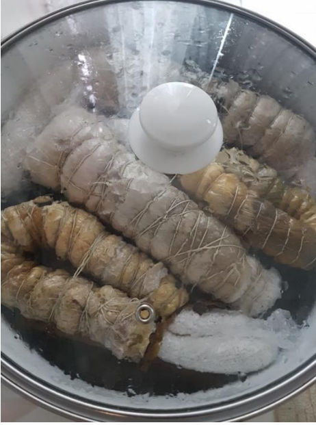
Görsel 3. Sıkıca bağlanan keçenin tencerede kaynatılması, Yalçınkaya, (2022).

Bitkilerin renklerinin daha kalıcı ve canlı olabilmesi için ‘mordanlama’ adı verilen işlem bu aşamada uygulanmaktadır. Keçenin suda kaynaması ya da bekletilmesi esnasında suyun içerisine katılacak olan şap ya da sirke, mordanlama için yeterli olmaktadır. Renklerin yüzeye net bir şekilde aktarılabilmesi için keçenin rulo şeklinde 24 saat bekletilmesi gerekmektedir. Bekleme süresini tamamlayan rulo keçe açılıp kurutulmakta ve sonrasında ütü yapılmaktadır. Yalçınkaya atölyesinde ekoprint tekniği uygulanmış keçenin, açılmış son hali görsel 6’da verilmiştir (Yalçınkaya, sözlü görüşme, 2022).