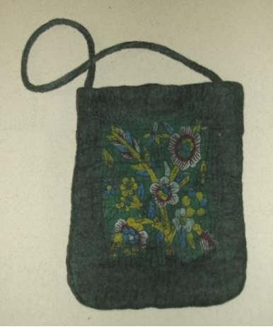
Görsel 26. Kumaş keçeleştirme tekniği ile keçe çanta, (2022).