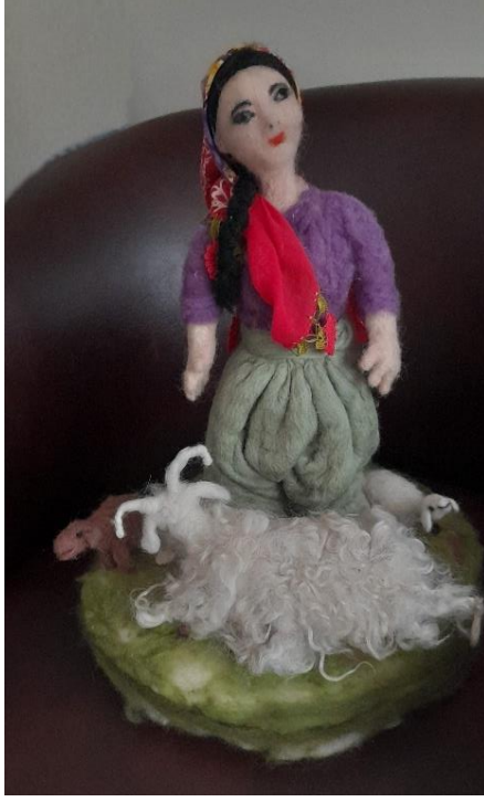
Görsel 20. Keçi, kuzu ve Anadolu kadınına yansıtan figürler, Ata Arşivi, (2022).