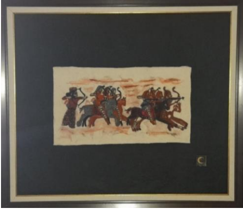
Görsel 31. Tatarlı tümülüsündeki ahşap firizler üzerindeki figürlerden oluşan tablo, Ata Arşivi, (2022).