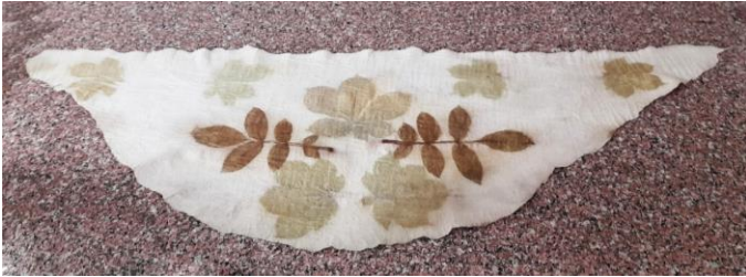
Görsel 4. Kaynatma işlemi sonrası keçenin açılması, Ata Arşivi, (2022).

Bitkilerin renklerinin daha kalıcı ve canlı olabilmesi için ‘mordanlama’ adı verilen işlem bu aşamada uygulanmaktadır. Keçenin suda kaynaması ya da bekletilmesi esnasında suyun içerisine katılacak olan şap ya da sirke, mordanlama için yeterli olmaktadır. Renklerin yüzeye net bir şekilde aktarılabilmesi için keçenin rulo şeklinde 24 saat bekletilmesi gerekmektedir. Bekleme süresini tamamlayan rulo keçe açılıp kurutulmakta ve sonrasında ütü yapılmaktadır. Yalçınkaya atölyesinde ekoprint tekniği uygulanmış keçenin, açılmış son hali görsel 6’da verilmiştir (Yalçınkaya, sözlü görüşme, 2022).