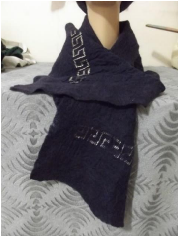
Görsel 30. Tel kırma ile işlenmiş keçe fular, Ata Arşivi, (2022).