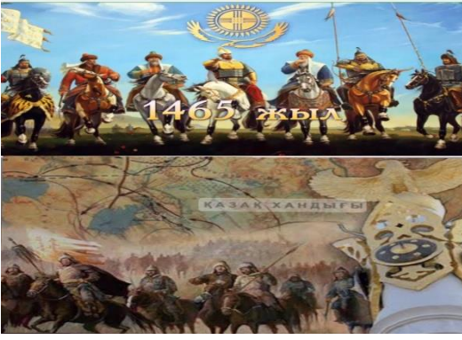
Şekil 3. Kazak hanlarının hayali toplu fotoğrafı ve atlı savaşçılarıyla birlikte Kazak Hanlığı'nın haritası ve arması.

XV. yüzyıldan XIX. yüzyıla kadar varlığını sürdüren ve Kıpçak Ovası'nın doğu kesimlerinde yoğunlaşan Altın Orda grubunun devamıydı. Kazak Hanlığı 1465 yılında Janibek Han ve Kari Han tarafından kuruldu. Her iki Han da soyunu Cukid hanedanı boyunca Cengiz Han'a kadar uzanan Türk-Moğol Töre kabilesindendi. Töre klanı, Rus İmparatorluğu'nun eline geçene kadar Hanlığı yönetmeye devam etti. 16. yüzyıldan 17. yüzyıla kadar Kazak Hanlığı, topraklarını Kumania'nın doğusuna (bugünkü Batı Kazakistan), Özbekistan'ın çoğuna, Karakalpakstan'a ve Sir Derya Nehri'ne kadar genişletti ve askeri çatışmalarla Astrahan ve Horasan Eyaleti'ne kadar genişletti. Bu durum sırasıyla Rusya ve İran coğrafyasına kadar sürmüştür. Kazaklar ayrıca 18. yüzyılda Avrupa şehirlerinde köle ticareti yapmış ve Rus topraklarına baskınlar düzenlemişti. Hanlık daha sonra Uirat ve Cungar saldırılarıyla zayıflandı. Bunlar daha fazla azalmaya ve üç Cüze ayrılmaya yol açtı. 19. yüzyılda yavaş yavaş egemenliklerini kaybederek genişleyen Rus İmparatorluğu'na katıldı (Karibayev, 2013).