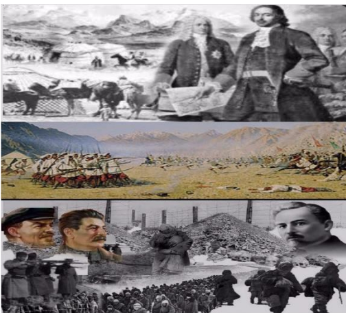
Şekil 4. Rus imparatoru I. Peter ve sömürge politikacılarının kurgusal bir resmi Hem de Kazakların topraklarından zorla sürülmesini ve yerlerine Rus köylülerinin yerleştirilmesini gösteriyor.

Rus İmparatorluğu yönetimindeki sömürge politikasının Kazakistan topraklarına etkisi, sömürge döneminde Kazak toplumunun geleneksel yapısının direniş yolları ve uyum mekanizmasının değişmesiyle ortaya çıkan temel sonuçlar gösterilmektedir. Rus İmparatorluğu'nun sömürge politikasının rolü, 18-19. yüzyıllarda Kazakistan coğrafyasında gerçekleştirdiği idari ve siyasi reformlarla anlatılmaktadır. O dönemdeki Kazak toplumunun sosyo-etno-sosyal yapısını değiştirdiği, tüm geleneksel ekonominin doğasını değiştirdiği ve sosyal, politik ve ekonomik ilişkiler sisteminde önemli değişiklikler yarattığı gösterilmiştir. O dönem siyasi etki, Kazak toplumunda savaş ağaları-kahramanlardan oluşan sosyal grubun önemiyle açıklanıyordu. Rus İmparatorluğunun sömürge politikasında bir yandan silahlı kuvvetlere ve sömürge aygıtına, diğer yandan Kazak şuncarlarının feodal liderlik gruplarına güvenerek işini yaptı. Zorla ele geçirilen bölgelerin bir kısmı bu Kazak topluluğunun feodal beyleri tarafından işleniyordu (Tikhonov, 1977: 109-121).