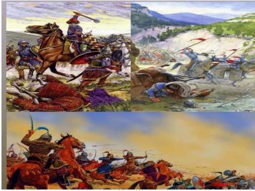
Şekil 1. Kazak Türklerinin savaş sırasındaki kurgusal resimleri.

Kazak tarihi ele alındığında, kazak kabilelerinin büyük bozkırda farklı kaderlerle olduğu görülmektedir. Yüzlerce asır, hatta binlerce yıl boyunca Kazak boylarının yaşam tarzına, geleneklerine, yani göçebe yaşam tarzına göre şekillenen geleneksel toplumun kendine has özellikleri de bulunmaktaydı. Kazakların temel özelliği, tarihteki birçok eleştiriye rağmen özünü kaybetmemiş klan-kabile sistemidir. Bu sistemin geçmişi 13. yüzyıla kadar uzanmaktadır. Günümüzde Kazak Hanlığı olarak bilinen Kazak Hanlığı'nın, Orta Avrasya'nın kuruluşunda ön planda olduğu bilinmektedir (Kundakbayeva, 2022).