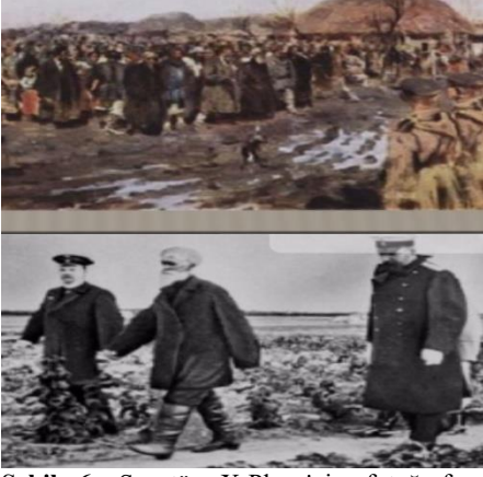
Şekil 6. Senatör X-Plane'nin fotoğrafı, çarlık Rusya emriyle Kazakistan topraklarına yerleştirilen Rus çiftçilerin durumunun değerlendirilmesi sırasında çekilmiş

Daha sonra Kaznakov'un Sibirya Genel Valisi makamına gelmesiyle (1870), bu bölgede resmi göçmen yerleşimi ortaya çıktı (Risqulov, 2007: 167). 1869'da Gavrilovskoe ve Lugovo, 1870'de - Malvodnoe ve Zaitsev, 1871'de - Rus çiftçilerinin Kazak bozkırlarına yerleşmesiyle Kepal Uyezd'de Mikhailovskoe, Nikolaevskoe, Karasu ve diğer çiftçi yerleşimleri ortaya çıktı. 1873'te Türkistan Genel Valisi orada yaşadı; Orinbor'dan Taşkent'e, Taşkent'ten Verni şehri üzerinden Sami'ye giden ana yolu kapsıyordu. Rus yerleşimlerinin Kazak bozkırını dört eşit parçaya bölerek Orinbor'dan Taşkent'e, Taşkent'ten Yedisu (Жетысу) üzerinden Altay bölgesine geçtiği söylendi ancak yeniden yerleşim faaliyetleri hızlı gelişmedi. Bunun nedeni toprak ağalarının çiftçilerin Rusya içinden kitlesel göçünü desteklememeleriydi.