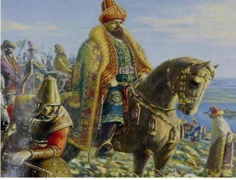
Şekil 5. Kazakların Orta Cüz Hanını Abdul Mansour Han (Abılay Han) ın hayali bir fotoğrafı.

1781 yılında Orta Cüz Kazak Hanlığı'nın küçük bir bölümünü yöneten Abul Mansur Han da Rusya'nın etki ve koruma alanına girdi. Abul Hair gibi Abul Mansur da Kral'a karşı daha iyi koruma arayışına girdi ve üç Kazak hanlığını birleştirdi. hepsinin Rus İmparatorluğu altında korunmasına yardımcı oldu. Bu süre zarfında Abul Mansur Nasrallah, Nauryzbay Bahadur'u Kazak ordusundaki üç sancaktarından biri yaptı. Bu hamleler Rusların Orta Asya'nın kalbine daha da nüfuz etmesine ve diğer Orta Asya ülkeleri etkileşime girmesine sebep olmuştur.