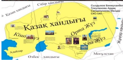
Şekil 2. Kazak Hanlığı'nın kuruluşunun hayali resmi ve sınırlarının haritası.