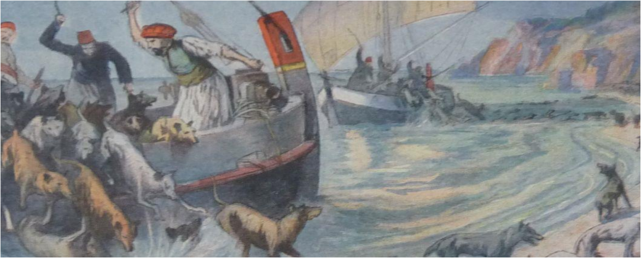
Resim 4: Köpeklerin Oxias Adasına (Hayırsız Ada) Sürgünü ( Le Petit Parisien , 31 Temmuz 1910, Pierre de Gigord Koleksiyonu) 23

Atıldıkları ıssız adada doğru dürüst beslenmeyen, küçük bir alanda bir arada yaşamaya zorlanarak ölüme terk edilen köpekler, Osmanlı modernleşmesinin merhametsiz yüzü ile karşı karşıya kalmışlardır. İstanbul'a Avrupaî modern bir görünüm vermek amacı ile gerçekleştirilen bu hareket 24 , Batılılardan övgü yerine eleştirilere maruz kalmıştır. Köpeklerin maruz bırakıldığı bu zalimane hareket, Avrupa'da yeni ortaya çıkmış olan hayvan koruma derneklerinden 25 Osmanlı Devleti'ne gönderilen protestolar ile karşılaşmıştır. 26