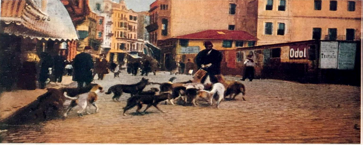
Resim 1: Bir Kartpostalda Pera'da Köpekler 12

XIX. yüzyılda İstanbul'u ziyaret etme imkânını bulan ve bu tecrübelerini kitaplaştıran pek çok Batılı seyyah, seyahatnamelerinde İstanbul'un köpeklerine mutlaka yer ayırmıştır. Bir kısmı yüzyıllardır İstanbullular ile birlikte yaşayan bu köpekleri şehrin bir parçası olarak görüp doğu şehirlerinin tipik özelliği olarak yorumlarken, bir kısmı da olaya şehircilik açısından yaklaşmış ve Batı'nın şehircilik kriterleri açısından bu olayı kabul edilemez olarak görmüştür. XIX. yüzyılda, Batılı seyyahlar tarafından yapılan tahminlere göre şehirde 40-50.000 civarı köpek yaşamaktadır. 13