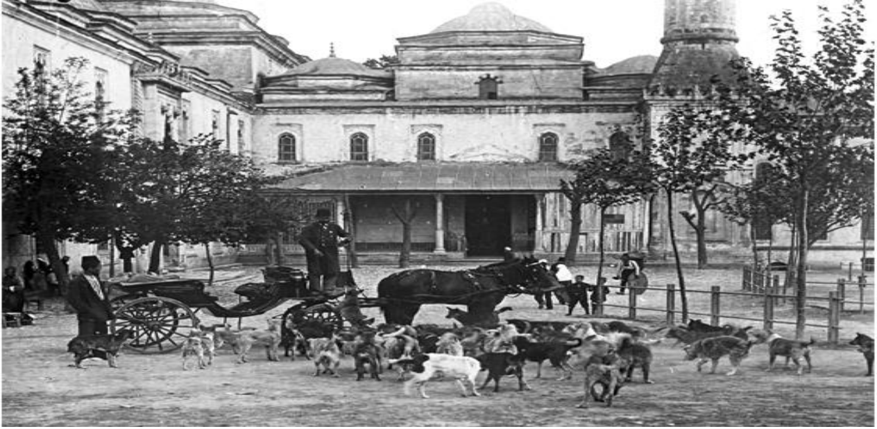
Resim 7: 20. Yüzyıl Baş, Sokak Köpeklerini Besleyen Bir Arabacı

Son olarak, L'illustration dergisinin 16 Temmuz 1910 tarihli sayısında, İstanbul köpeklerine dair verilen bilgiye yer verilecektir. İlgili sayıda: "Köpeklerin en çok sevildiği ülke hangisidir? Türkiye. Orada onların hepsine uygun olup olmadığına bakmaksızın yemek veriliyor. Hamile dişi sokak köpeklerine doğum yapmaları için evlerin önünde ot veya samandan yatacak yer hazırlanıyor. Camiden çıkıldığında, onlara özel olarak yapılmış peksimet dağıtılıyor. İstanbul'da kendilerini barındırma hakları meşhurdur." şeklinde halkın köpeklerle yaklaşımına dair bilgi verilmiş ve devamında şunlar anlatılmıştır: