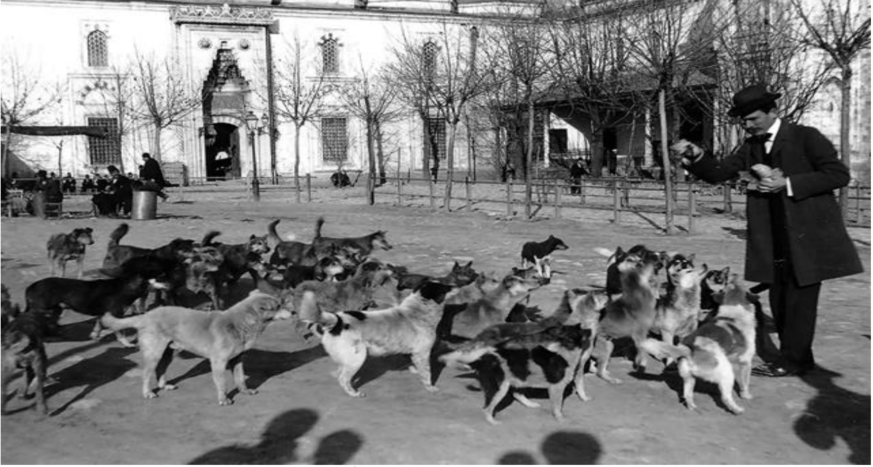
Resim 8: 20. Yüzyıl Başı, Avrupalı Bir Gezgin İle Sokak Köpekleri (Pierre De Gigord Koleksiyonu)

bulursunuz. Kırların ortasındaki kadar rahat bir şekilde gelen geçeni umursamıyorlar. Daha doğrusu kendi evlerinde olan onlar; size de onların rahatını bozmamak düşünüyor.” 58