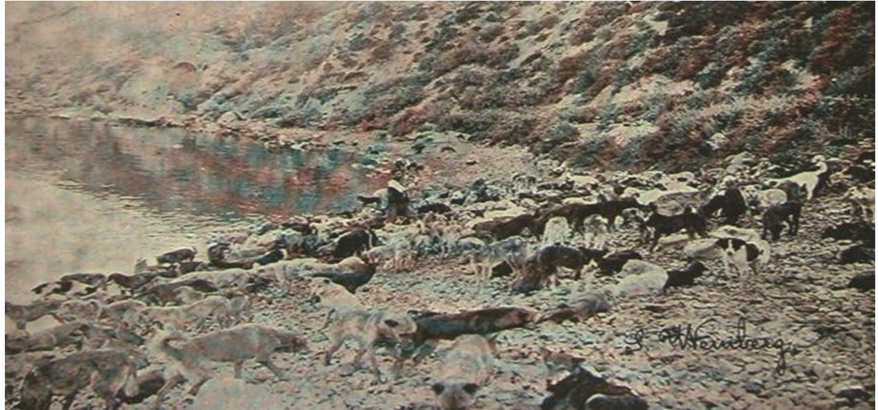
Resim 5: 1910'da Sivriada'ya Bırakılan Köpekler ( L'Illustration , 16 Temmuz 1910) 27

Atıldıkları ıssız adada doğru dürüst beslenmeyen, küçük bir alanda bir arada yaşamaya zorlanarak ölüme terk edilen köpekler, Osmanlı modernleşmesinin merhametsiz yüzü ile karşı karşıya kalmışlardır. İstanbul'a Avrupaî modern bir görünüm vermek amacı ile gerçekleştirilen bu hareket 24 , Batılılardan övgü yerine eleştirilere maruz kalmıştır. Köpeklerin maruz bırakıldığı bu zalimane hareket, Avrupa'da yeni ortaya çıkmış olan hayvan koruma derneklerinden 25 Osmanlı Devleti'ne gönderilen protestolar ile karşılaşmıştır. 26