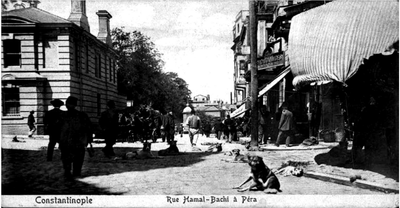
Resim 2: Pera'da Sokak Köpekleri 16

Köpeklerin şehirde güvenlik, sağlık ve temizlikle ilgili çeşitli toplumsal işlevlerinin olduğu görülmektedir. Nitekim İstanbul'un köpekleri geceleri, kendi mahallelerine gelen yabancılara ve şüpheli kimselere saldırarak bir çeşit bekçi görevi görmüşlerdir. 14 Temizlik işlevini ise, kendilerine kapı ve pencerelerden atılan tüm yemek artıklarını yiyip bitirmekle yerine getirmişlerdir. Böylece, çöp sorunun düzenli bir şekilde çözümlenmediği bir şehirde, köpekler temizlik görevini de üstlenmişler, hatta şehir sağlığına katkıda bulunmuşlardır. 15