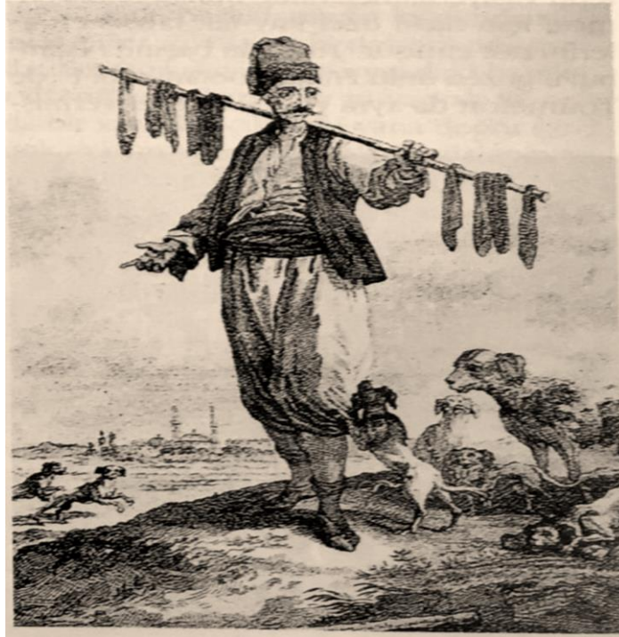
Resim 6: J. B. Hilair'in Çizgileriyle Seyyar Ciğerci ve Köpekler

Bazı adamlar (mancacılar) kentin sokaklarında dolaşarak demir bir şişe geçirdikleri kızarmış et parçalarını satarlar ve bunların peşinden bir sürü kedi köpek gelir. Kent halkı bu etlerden satın alıp hayvanları besler. Bazı kimseler de bir akçe veya birkaç mangır karşılığında et ya da iç organları satın alırlar ve damlarında gezen kedilerin, sokak köpeklerinin önüne atarlar, hatta havadaki kuşları bile beslerler. Bunları hep "Allah rızası için" yaparlar. Bu davranışın bir ibadet yerine geçtiğine ve sevap sayıldığına inanırlar. 36