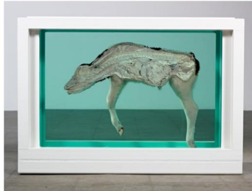
Resim 5: Damien Hirst, 'Anne ve Çocuk' (Buzağı), 1993.