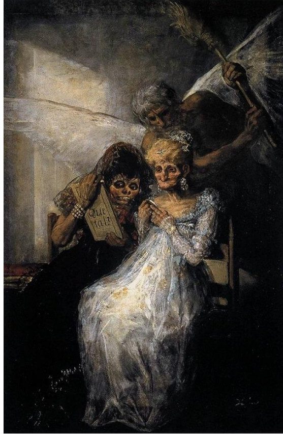
Resim: 2 Francisco José de Goya 'Zaman ve Yaşlı Kadınlardır', 181 x 125cm

Ölüm temasını eserlerinde işleyen diğer bir sanatçı İspanyol ressam Romantizm akımının önde gelen isimlerinden olan Francisco José de Goya'dır. Goya ölüm temasını işlediği eser 'zaman ve yaşlı kadınlardır'(Resim-2). Goya, sıradan insanların sempatik resimlerini yaparken soyluları yergisel olarak resmeder. Resim aslında Goya'nın 1797 -1798 döneminde yaptığı "Los Caprichos" adlı bakırdan levhalara kezzapla işleyerek yaptığı çizimlerden birine dayanır. Resimde verilmek istenen Vanitas algısı net bir şekilde görülmektedir. Goya resminde, ölümün insanın tepesinde gezdiğini ve güzelliğün kalıcı olmadığını çirkinliğin gelebileceğini anlatmak istemiş, bunu yaşlılar üzerinden sembolleştirmiştir.