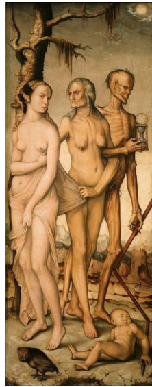
Resim: 1 Hans Baldung 'İnsanın Üç Çağı ve Ölüm', 151 × 51 cm 1544.

Hazırlanan bu çalışmaya konu olan sanatçılardan ilki, Alman Rönesans ressamı Hans Baldung Grien'dir. Alman ressam Hans Baldung, Sanat dünyasına Çoğunlukla ölüm teması ve karanlık korkutucu temalar üzerine eserler veren ressam yine böyle bir eserde âdemoğlunun hayat serüvenini 3 evrede ölümle birleştirdiği bir portre ortaya çıkarmıştır (Resim 1).