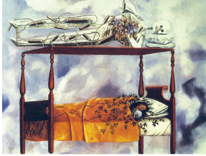
Resim: 3 Frida Kahlo 'Ölüm', 74 x 98,5 cm 1940.

Dünyadaki pek çok ülkenin aksine ölüm, Meksika'da yas tutulması gereken bir kavram değildir. Aksine "Ölümler Günü" festivali gibi bir seremoni ile ölümlerle kutlanacak bir ritüeldir. Çoğu insan için tuhaf gelmesine rağmen, Meksika'da ölüm ve yaşam karmaşık bir şekilde birbirine bağlıdır. Frida 1940 yılında resmettiği 'Ölüm' adlı tablosunda Frida, hem de iskelet başları iki yastıkla yan yana yatar vaziyette kendisini tasvir etmiştir. Frida derin bir uykudayken iskelet uyanık ve izlemektedir. İskelet aynı zamanda her an patlayabilen patlayıcılarla da donatılmıştır. Frida'nın vücudundaki yeşil bitkiler, yaşamın ve yeniden doğuşun sembolü olarak görülebilir. Arka plandaki bulutlar hafif ve havadar ve yatak gökyüzünde süzülüyor gibi tasvir edilmiştir.