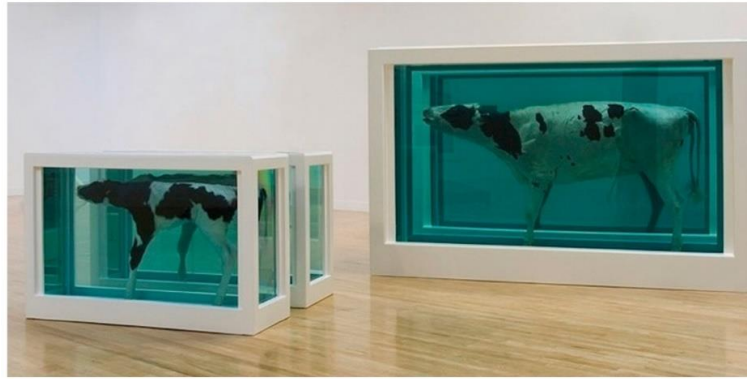
Resim 4: Damien Hirst, 'Anne ve Çocuk' (Buzağı) 1136 x 1689 x 622 mm | 44,7 x 66,5 x 24,5 inç, Her biri iki parça (inek): 2086 x 3225 x 1092 mm | 82,1 x 127 x 43 inç, 1993.

Ölüm teması, tüm dönemler de olduğu gibi Modern sanatında konusu olmuştur. Hazırlanan bu çalışmaya konu olan diğer bir sanatçı Damien Hirst'tür. İnceleyeceğimiz eserleri çalışmasıdır (Resim 4-5).