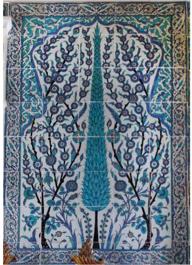
Fotoğraf 4-5: Şehzâdegân Mektebi Divanhanesi güneybatı duvarında servili ve bahar ağaçlı pano. Z. Dumlupınar