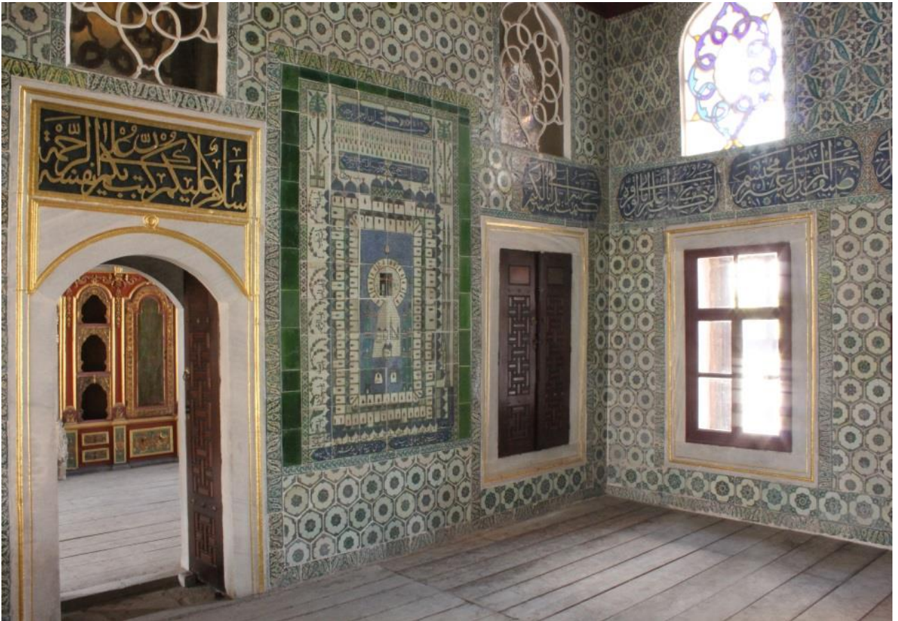
Fotoğraf 2: Şehzâdegân Mektebi Sofası, güneybatı duvarında Kâbe tasvirli çini pano. Z. Dumlupınar