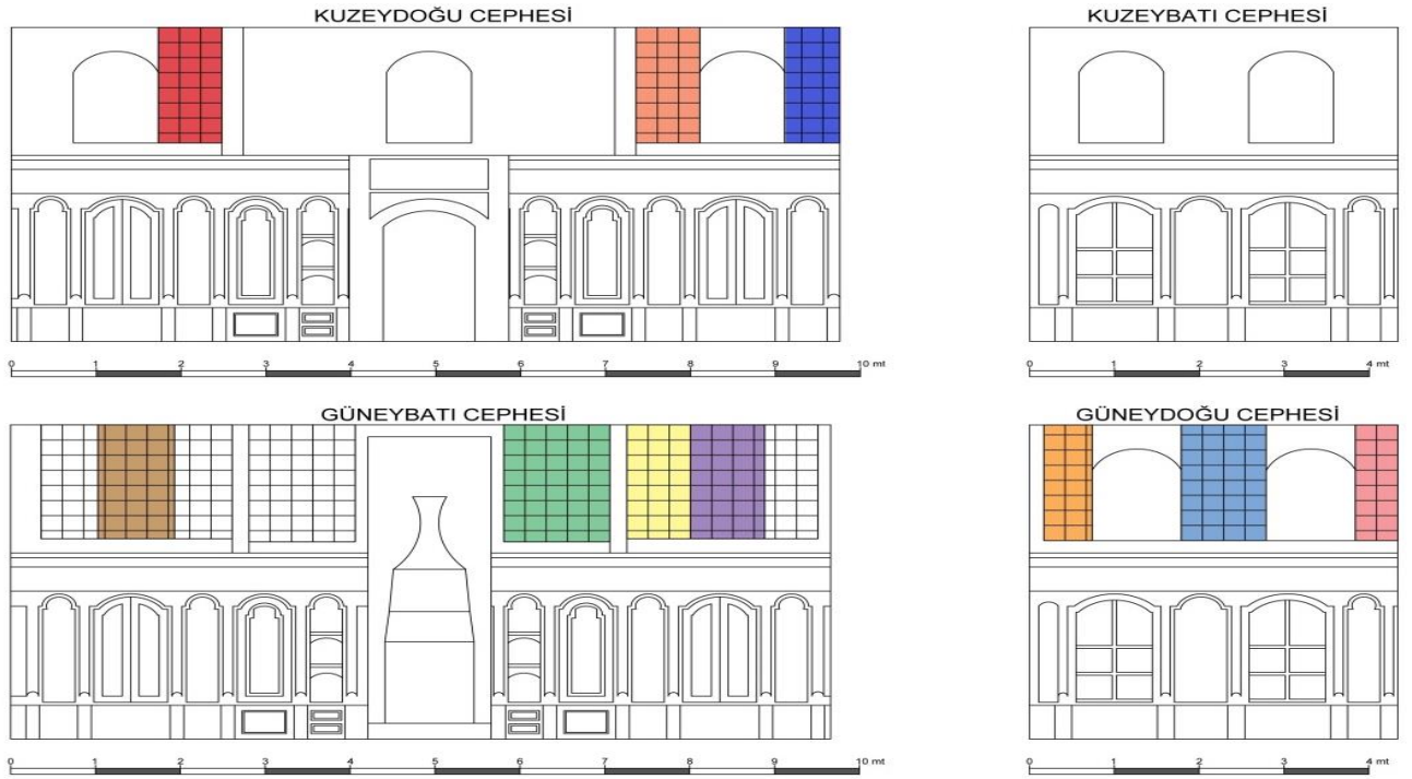
Çizim 2: Şehzâdegân Mektebi divanhânesi birbirinden farklı çini panoların yerleşimini gösteren cephe görünüşü. E. Akgül