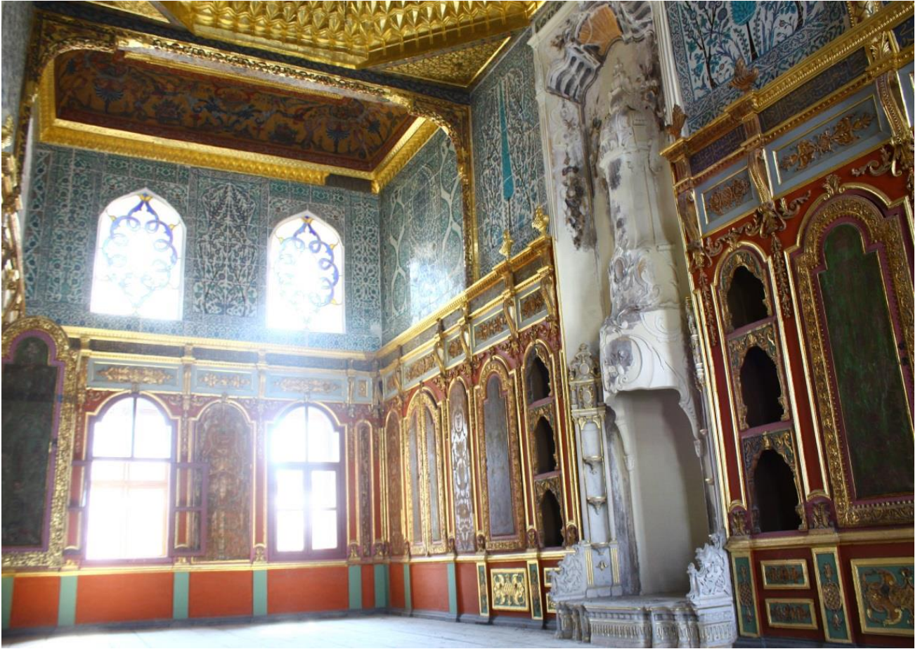
Fotoğraf 3: Şehzâdegân Mektebi Divanhanesi güneybatı ve güneydoğu duvarları. Z.Dumlupınar