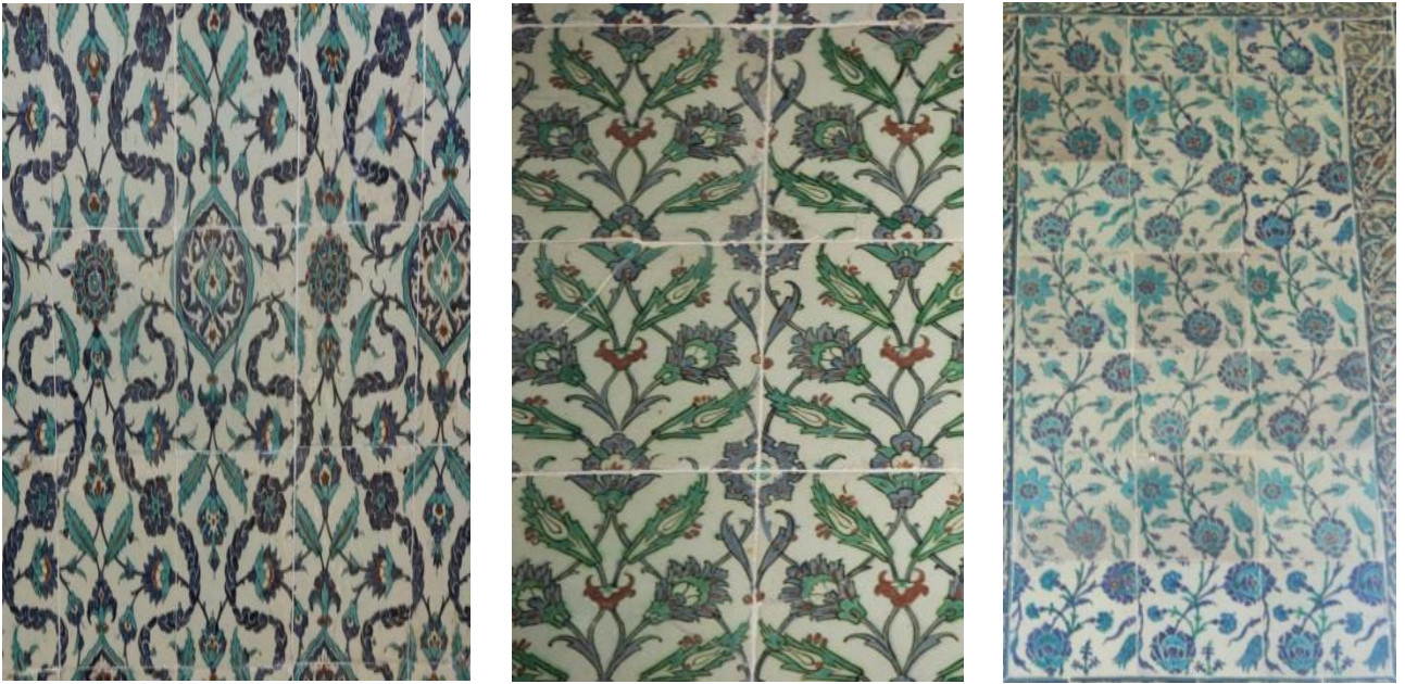
Fotoğraf 14-16: Şehzâdegân Mektebi Divanhanesi ulama çinileri. Z. Dumlupınar