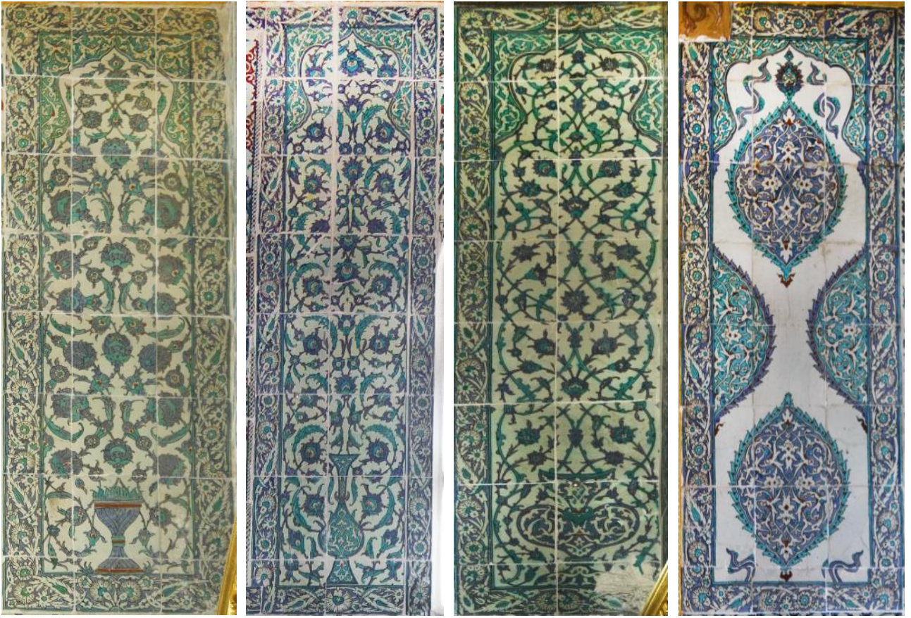
Fotoğraf 10-13: Şehzâdegân Mektebi Divanhanesi ulama panoları. Z. Dumlupınar