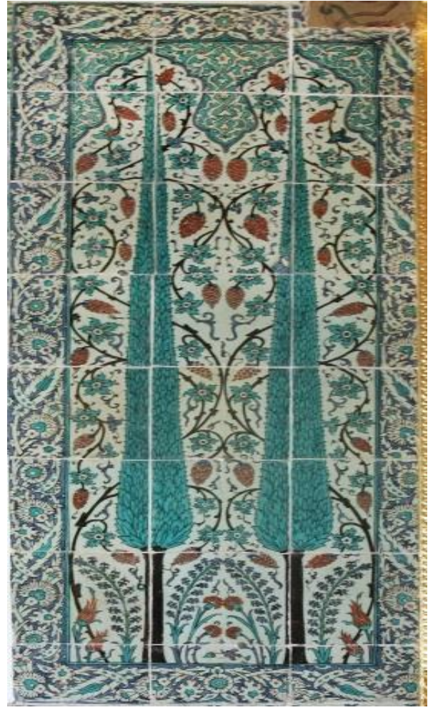
Fotoğraf 6-7: Şehzâdegân Mektebi Divanhanesi servili panoları. Z. Dumlupınar