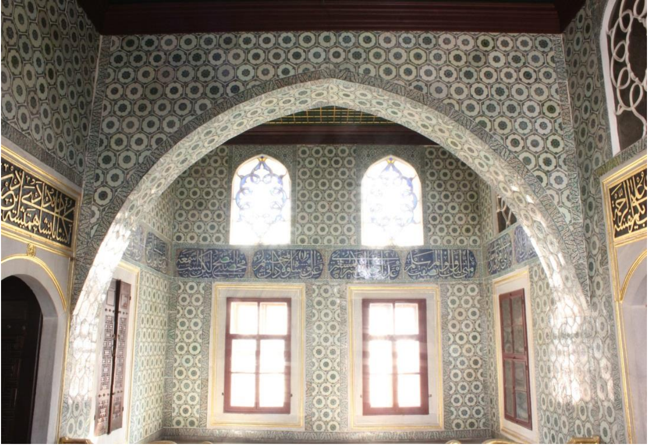
Fotoğraf 1: Şehzâdegân Mektebi Sofası, kuzeybatı duvarı. Z.Dumlupınar