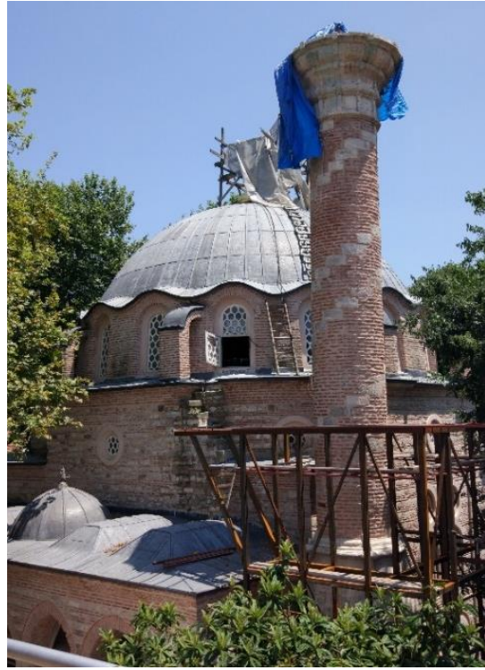
Ek C4. Zeyneb Sultan Camii