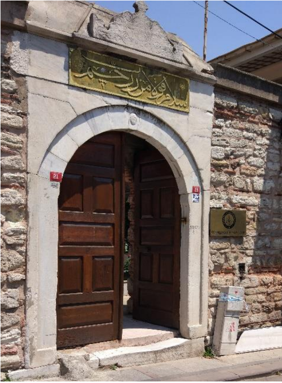
Ek C3. Medrese ve mekteb tarafındaki batı girişi.