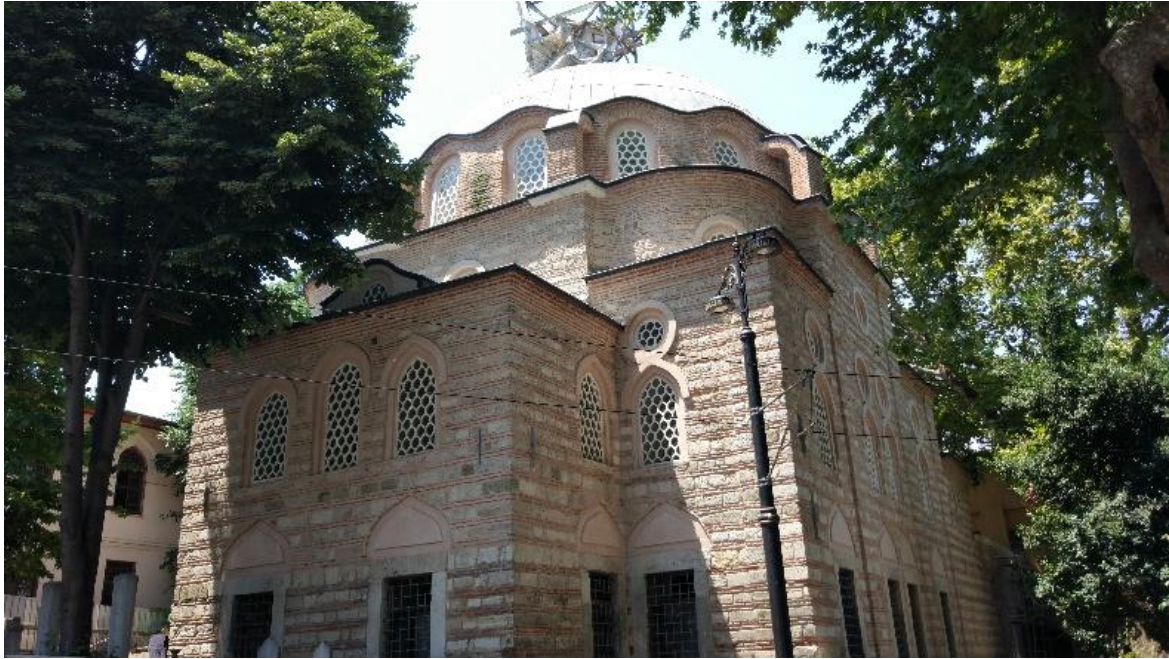
Ek C2. Zeyneb Sultan Camii, mihrab tarafından görünüş