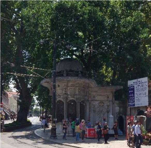
Ek C5. Kuzey girişindeki Hamidiye Sebili