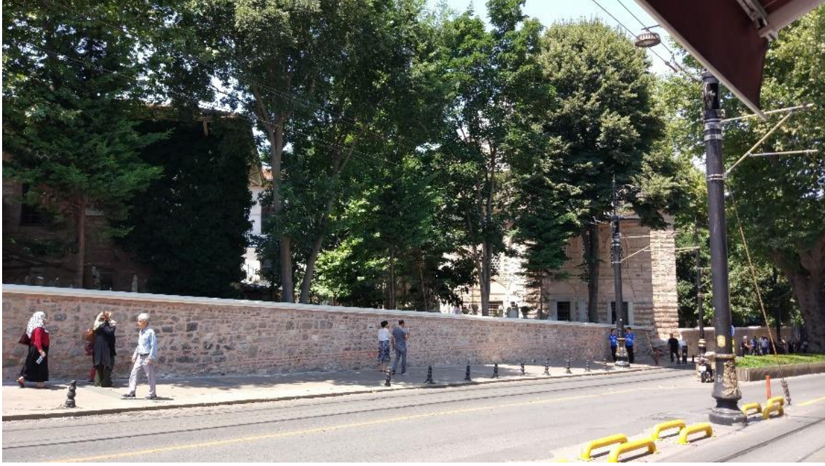
Ek C1. Zeyneb Sultan Camii ve Sıbyan Mektebi, Alemdar Caddesinden görünüş