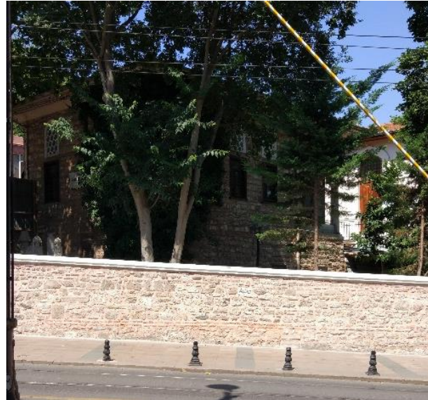
Ek C6. Sıbyan Mektebi.