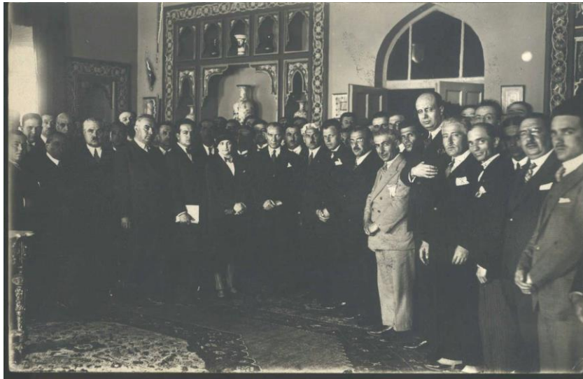
Resim 2. Türk Ocakları VI. Kurultayı (1930) (TTK Arşivi)

Ocakları Merkez Binasına Teşrifleri (1929) (TTK Arşivi)