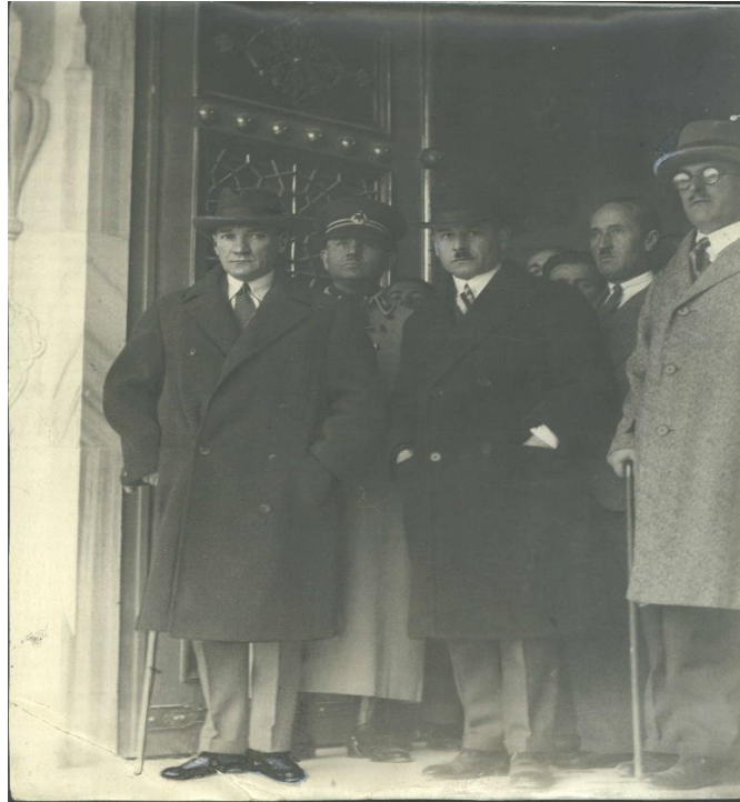
Resim 1. Cumhurbaşkanı

Hars heyeti ilk kez hazırlamış oldukları bu raporda, 23 Nisan 1927'de toplanan kurultaya kadar yapmış oldukları faaliyetleri, gelecekte yapmayı düşündükleri projelerini, bu yolda karşılaştıkları güçlükleri, kurultay üyelerine sunmuşlardır.