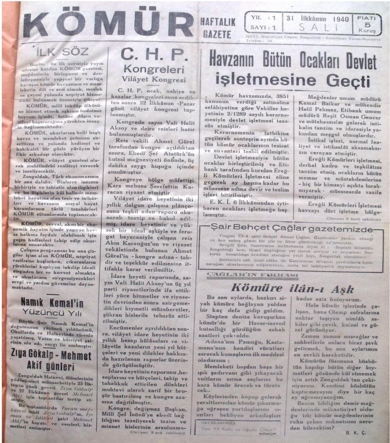
Kömür'ün 31 Aralık 1940 Tarihli İlk Sayısı