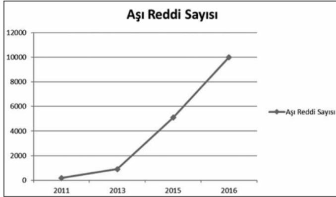
Resim 4. Türkiye'de Aşığı Reddi Sayısı(Bozkurt, 2018: s.74).

Türkiye'de aşığı kabul etmeyen 183 aile varken, 2013 yılında 913, 2015 yılında 5091 ve 2016 yılında ise 10.000'in üstüne ulaşmıştır. Türkiye'de bu yükselişle aşığı redleri ilerlemesini sürdürürse yaklaşık 5 sene sonunda bağışıklanma oranının %80 civarlarına düşeceğini, dolayısıyla çok nadir rastladığımız hastalıklarda önemli yükselişler görüleceğini, belki de eradike ettiğimiz vakalara tekrar rastlanacağı düşünülmektedir. Dünya genelindeyse bağışıklık kazanma aşılanma oranları yükseldikçe engellenebilir hastalıklardaki vaka sayıları ve ölüm oranlarının azaldığı görülmektedir. Aşığı oranları ülke bazında değişkenlik gösterebilmektedir. Pakistan, Nijerya, Hindistan, Afganistan'da aşığı oranları %70 ile 80 civarında değişkenlik gösterirken, Avrupa ile Amerika'da genellikle %90'ın üstündedir (Düzgün, Dalgıç, 2019: s. 427).