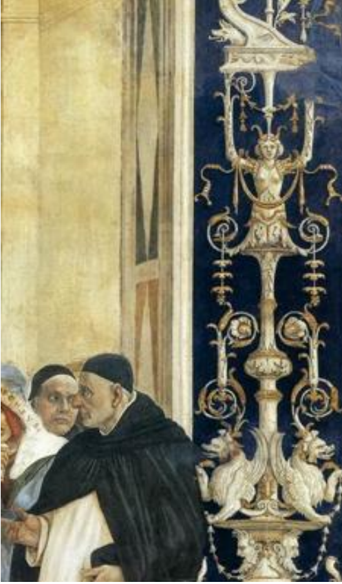
Resim 3: Filippino Lippi, Aziz Thomas Aquinas'ın Zaferi, detay.

Filippino Lippi, yaklaşık 1489 yılında Floransa'daki Santa Maria Novella Kilisesi'ndeki Strozzi Şapeli'nde önemli bir sanatsal girişime kalkışmıştır (Resim 4). Şapelin fresklerinde, Carafa'nın eserlerinde de benzer şekilde görülen grotesk tarzı ve figüratif sütunları kullanmıştır. Bu özellikler, sanatçının ustaca grotesk imgeleri kullanma yeteneğini sergiler; bu imgeleri yetkin bir şekilde kopyalayarak ve kompozisyonlarına sindirerek süslemeci ve hayali çerçeveler oluşturmuştur. Filippino'nun yaklaşımı, grotesk yaratımlarının gerçeklik ile hayal arasındaki sınırları aşmasına olanak tanırken, onları resimlerinin merkezine çarpıcı bir şekilde yerleştirmiş ve yalnızca dekoratif amaçları aşan canlı süslemelerle bezenmiştir. Birkaç resimde tekrarlanan belirli grotesk motiflerin varlığı, Filippino'nun çizimlerinin sanatsal serüvenindeki işlevsel rolüne işaret etmektedir.