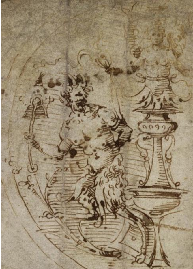
Resim 1: Filippino Lippi, kâğıt üstüne kalem ve mürekkep, Satir ve şamdan motifli dairesel süsleme.

Bunlardan biri Resim 1'de gördüğümüz, bir satir ve grotesk süslemeyi içeren çizimdir. Bu çizim, Nero'nun Altın Sarayı'ndaki resimlerden ilham alınarak yapılmıştır ve Filippino'nun muhtemelen oradan kopyaladığı bir motifin varyasyonunu temsil etmektedir. Bu gözlem, Vasari'den bu yana Filippino'nun resimlerindeki antik eserlerin grotesk ve fantastik doğasını tanımlayan bilginlerin görüşleriyle uyumludur. Maria Fossi (1926-2008) gibi sanat tarihçileri, Filippino'nun antik formları başlangıçta kopyaladığını ve daha sonra bunları farklı çizimlerde dönüştürdüğünü öne sürmüşlerdir (Shoemaker, 1978: 39). Filippino'nun, Carafa Şapeli'ndeki freskonun kenar süslemelerindeki figürler (resim 1), grotesk tarz ile olan yakın ilişkisini sergilemektedir.