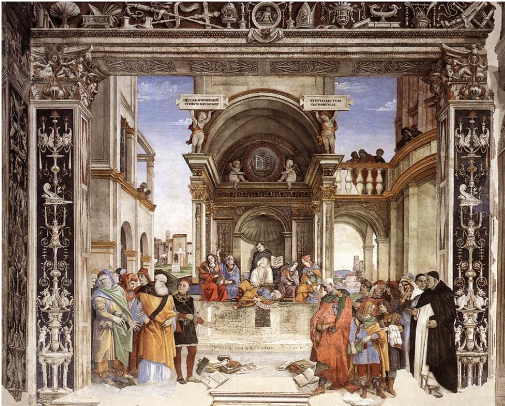
Resim 2: Filippino Lippi, Aziz Thomas Aquinas'ın Zaferi , 1488-1490, fresk, Carafa Şapeli, Roma.

Aziz Thomas Aquinas freskinde iki putti, antik ve Hristiyan sanatın bileşenleri olan, merkezi aedicule 6 'nin üstünde durur ve üzerlerinde yazılı levhalar tutarlar. Bunların canlı putti mi yoksa heykel mi olduğu belirsizdir. Filippino, üst üste yığılmış yapıyla, bunların bu sahnede ki çerçeveye ait süsleme bileşenleri olduğunu ima etmiştir: sütunlar kaide destekleri tarafından desteklenirler ve sırasıyla üstlerindeki nesnelere destek sağlarlar. Filippino, grotesk süslemelerin kenardan çıkararak anlatısının merkezine yerleştirmesiyle groteskin revizyonunu oldukça kapsamlı hale getirmiştir.