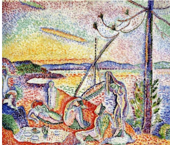
Resim 4. Henri Matisse, "Lüks, sükunet ve keyfe düşkünlük", 1904, tuval üzerine yağlı boya

Henri Matisse bu çalışmasını Cezanne’den etkilenerek yapmıştır (Ingram, 2017:13). Matisse kendi temel fikirlerinden bir tanesini bu eserde yansıtmaktadır. Sanatçı fikirle doğar, ömrünü onu geliştirmek ve yaşatmak için harcar der. Figürlerde yer alan tensel keyifi ömrü boyunca arayacaktır (Ingram, 2017:15. Matisse’nin erken dönemine ait bu resmini bir yaz günü deniz kenarında yapmıştır. Bu resmini yaparken yanında puantalist ressam Signac varmış ve ondan etkilenmiştir. Resimde parçalı noktalara benzeyen çizgiler puantalist gibi görünse de puantalist değildir. Fakat puantalist bir etki hissedilmektedir. Renkler yoğun ve canlı bir etkiyle görülmektedir. Sanatçı Natüralist bir yaklaşımla resmi ele almıştır. Resimde renkler sanatçının