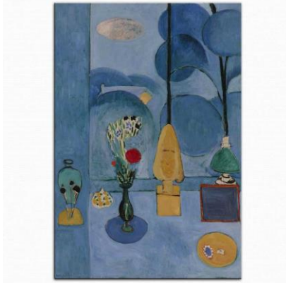
Resim 5. Henri Matisse, Mavi Pencere, 130,8 x 90,5 cm, TÜYB, Museum of Modern Art New York.1913

Henri Matisse bu eserinde soğuk renkleri baskın bir şekilde kullanmıştır. Resimde mavi rengin baskınlığı esere isim öbeği olarak ta yansımıştır. Bu eserde Matisse yatak odasından stüdyo odasına bir bakışı resmetmiştir. Nesnelere basitleştirilmiş ve çizgisel formlar baskın olarak kendini hissettirmiştir. Nesnelere üç boyut kısmen bazı tonlamalarda hissedilse de basitleştirilmiş form üç boyutu ciddi anlamda zayıflatmıştır. Bu çalışmada sanatçının kara aynadan faydalandığı düşünülmektedir. Sağ orta kesimde kahverengi çerçeve içinde yer alan grimsi karenin kara ayna olduğu düşünülmektedir. Kara ayna tüm renk algısının ortadan kalkmasını sağlıyor. Böylece stilize, basit ve tek ton renklerden oluşan formlar oluşuyor ( https://www.youtube.com/watch?v=GfIfriFMMOg ). Bu oluşum üç boyutu ve perspektifi zayıflatmaktadır.