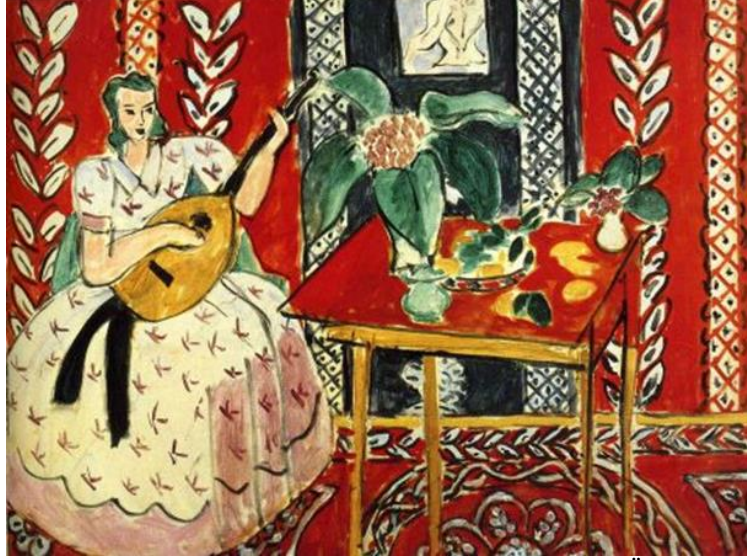
Resim 3. Henri Matisse, “Ut”, 59,5 x 79,5 cm, TÜYB, 1943

Henri Matisse’in fovist tavırla yaptığı “Ut” adlı eserine bakıldığında halı, duvar motif ve kıyafet motiflerinde üç boyut algısını oluşturacak renk tonal geçişlerinin verilmediği anlaşılmaktadır. Resimde figür, nesne formları ve renk kullanımının iç içe geçmiş olması ile resim yüzeye çekilmiştir. Renkler lokal kullanılmış, motifler abartılı ve stilize çizilmiştir.