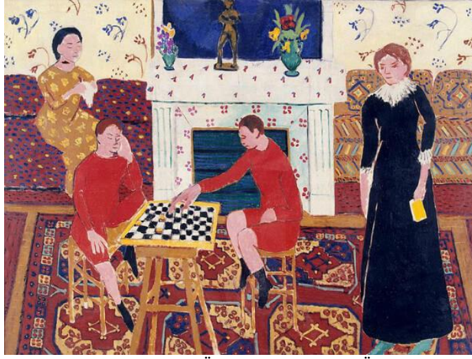
Resim 7. Henri Matisse, Ressamın Ailesi, TÜYB, 143x194 cm, TÜYB, Hermitaj Devlet Müzesi, St. Petersburg, 1911 (Ingram, 2017:36).

Matisse'nin ailesini sade ve olduğu gibi yansıttığı bu eserde motifler baskın bir şekilde kendini göstermektedir. Çalışmada yer alan bütün formlar sade yapılmış ve oran orantıları gerçek boyutlarına tam uygun yapılmamıştır. Eserde renklerin lokal verilmiş olması ve renklerin tonal değerlerinin verilmemiş olması, motiflerin belirgin ve stilize verilmesi üç boyutu büyük oranda zayıflatmış hatta birçok yerde yok etmiştir. Bu üslupsal uygulama mekan içerisinde derinliği zayıflatmış ve perspektif hissini büyük oranda kaybettirmiştir.