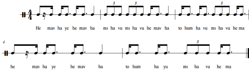
Şekil 4. He Mav Haye

“He mav haye” buğday hasadından sonra bulgur döverken söylenen bir tekerlemedir.