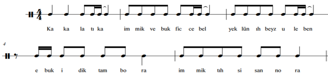
Şekil 1. Ka Ka La Tıka