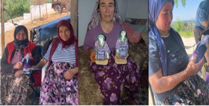
Fotoğraf 7: Yöre Halkının Yaptığı Örnek Folklorik Bebek Tasarımları