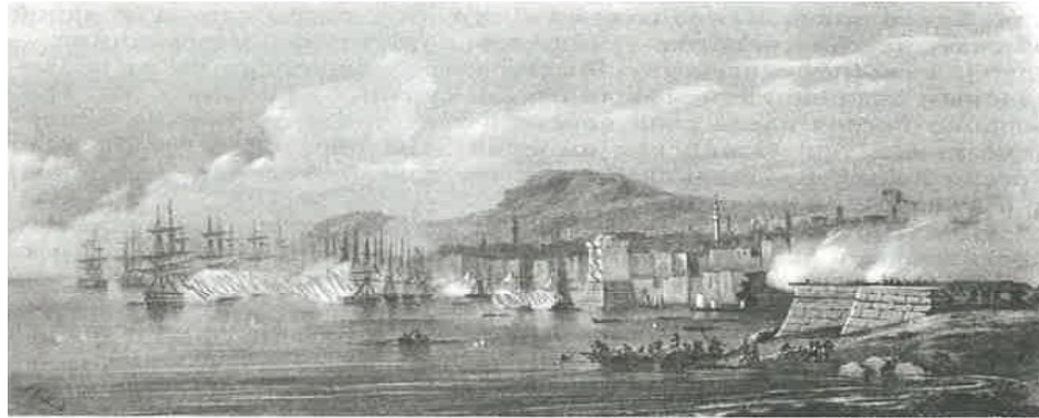
Rus tarih ders kitabında yer alan Sinop Baskını ile alakalı görsel

Rus tarih ders kitabında yer alan bu bölüm, komutan ismi, saldırıda bulunan Rus donanmasının bağlı bulunduğu filo, net olmamakla beraber karşılıklı sayı üstünlüğüne yer verilmiş, ancak Türk tarih ders kitabında, bu tür bilgilere yer verilmemiştir. Bölgedeki görevli amiral kimdi? savaş süresi ne oldu? Karşılıklı sayısal üstünlükler nasıldı? Bilinmemektedir.