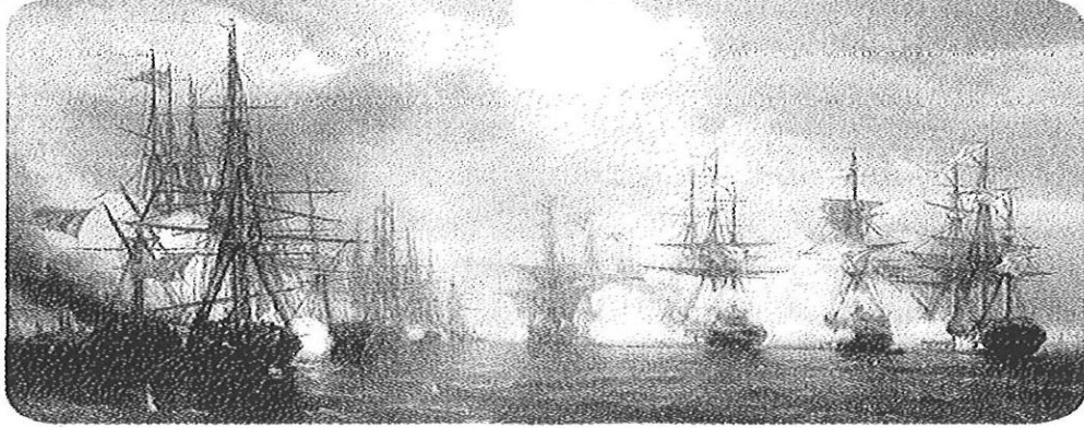
Resim 5.4: Sinop Baskını'nı gösteren bir resim (İvan Avvazovski. 1853)

yılında vuku bulmuş, Türk tarih kitabında olayın tarihi verilmemiştir. Rus tarih ders kitapları, Sinop baskını için “dönemin en çarpıcı önemli olayı” olarak bahsederken Türk tarih ders kitaplarında böyle bir vurgu görmek mümkün değildir. Rus tarih ders kitabı olaya büyük bir önem atfetmiş ve geniş bir yer ayırmıştır. Olay, Rus tarih ders kitabında şu şekilde aktarılmıştır; (Danilov ve Kosulina; 2015;95).