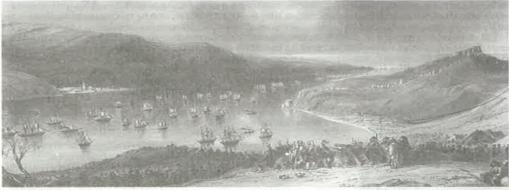
Вход англо-французского флота в Черное море через пролив Босфор в январе 1854 г.

kitabında verilmediği gibi orduları kumanda eden komutanların isimlerinin de zikredilmemiş olduğu görülmektedir. Ancak, kişi, yer, zaman ve sayısal veriler konusunda Rus tarih ders kitaplarının daha ayrıntılı bilgiler sunduğu görülmektedir.