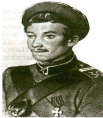
П. М. Кошка