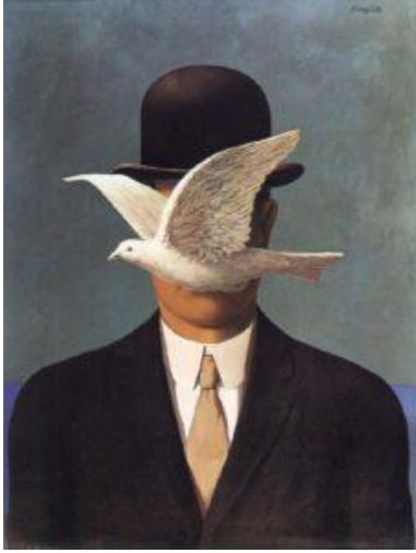
Görsel Melon Şapkalı Adam

Adamın Oğlu resmi sanatçının başka eserlerine de gönderme yapar. Yine 1964 yılında yaptığı “Büyük Savaş” ve “Melon Şapkalı Adam” resimleri bu resimle aralarında ilişki içerisindedir. Yüzünü uçan beyaz bir güvercin kapayan melon şapkalı adam aslında Adamın Oğlu resmindeki aynı figürdür. “Büyük Savaş” resmindeki şemsiyeli kadın figürü ise “Adamın Oğlu” resmiyle aynı arka planı paylaşır. Bu resimde de arka planın bir kısmı gökyüzü ve deniz, alt kısmı ise taş örülmüş bir duvardan oluşur. https://www.sanatlaart.com/haftanin-tablosu-insanin-oglu-rene-magritte-1964/