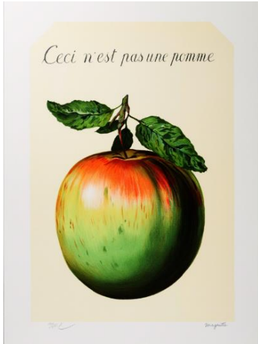
Rene Magritte, 'Ceci N'est Pas Une Pomme, Belçika, 1929 ( https://www.magrittegallery.fr/product-page/ceci-n-est-pas-une-pomme Erişim Tarihi: 06.04.2022)