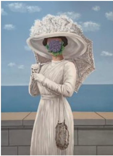
Görsel Büyük Savaş

Magritte'nin Adamın Oğlu tablosunda melon şapkalı adamın yüzüne elma yerleştirmesi göstergebilim açısından incelendiğinde doğal yaşamdan yasak meyveye pek çok şeye gönderme yapar. Meyvenin yeşil olması yaşamın İlahi bir ihsan ve sonsuz yaşam arzusuna gönderme yapıyor olabilir. Zaten elma Âdem ile Havva'nın Cennetten kovulmasına sebep olan meyveye gönderme yapar. Sürrealist bir ressam olarak Magritte elmanın arkasına saklanan yüz ile insanın tutkularına, cinselliğe ve yasak arzulara da gönderme yapar.