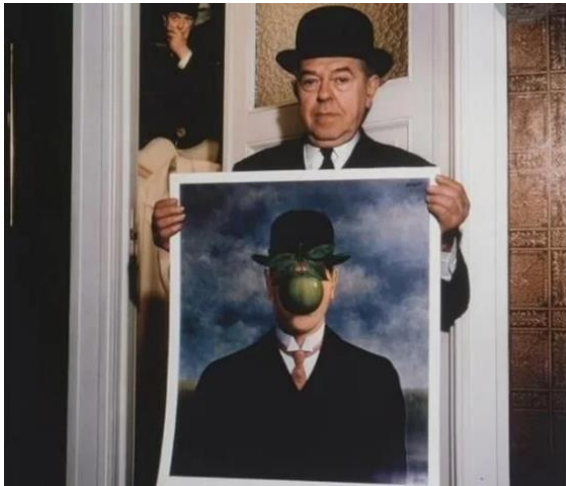
Görsel 1. Rene Magritte, Adamin Ođlu Resminin Posterini ile, https://www.themaggar.com/rene-magritte-yasami-eserleri/ 06.04.2022

“Magritte yapıtlarını günlük, basit nesnelere oluşturmuş ve belli kullanımı olan objeleri bambaşka biçimlerde kullanarak işlevlerini değiştirmiştir. Mavi benekli ve bulutlu bir kuş, külahtan şapkalı bir adam, çalkantılı yüz ifadeleri, bir gül, tüm odayı dolduran ve devleşen elmalar, bir erkeğin farklı boyutlardaki görüntüsü, ayakkabılar, etajer, ağaçlar, pencereler, kapı, sandalye, masa, pipo, fırçalar, çiçek saksıları gibi çok sıradan nesnelere görüntülerini kendi doğal görüntülerinin dışına çıkartıp, mantığa ve akla ters düşecek biçimde, yırtıcı ve düşsel bir ortam içinde gözler önüne sermiş ve zamansız bir yaşamın katılımcılarının böylece boyutlarını değiştirmiştir. Bunun sonucunda da izleyenlerin alışlagelmiş vizyonlarını hep sorgular hale getirmiştir.”