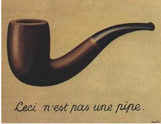
Bu Bir Pipo Değildir. (1928-1929) 63.5 cm × 93.98 cm. Tual üstüne yağlıboya. ( https://www.deviantart.com/sayla59/art/this-is-not-a-pipe-485754529 Erişim Tarihi: 06.04.2022)