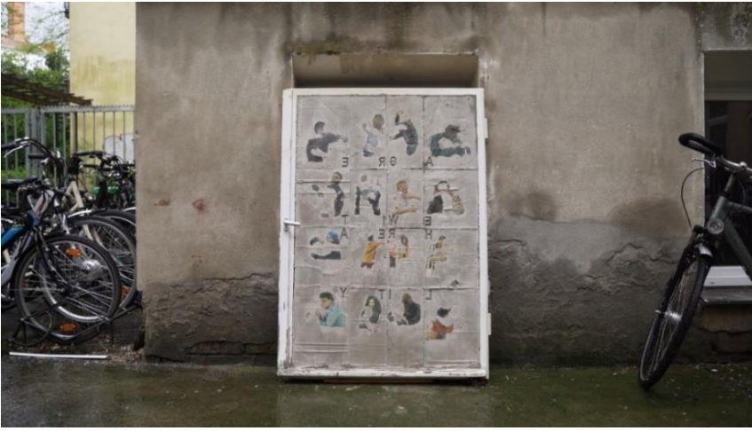
Görsel 19. Matheus Rocha Pitta, Stele # 21 (Agreement Window), 2021, Die Balkone 2