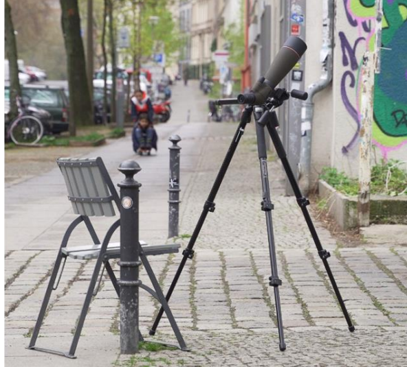
Görsel 17. Christoph Keller, New Homes for Birds, 2021, Die Balkone 2