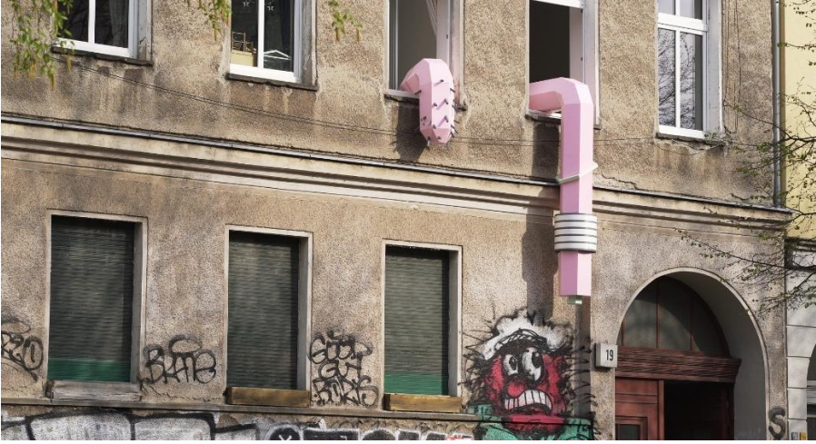
Görsel 21. Tommy Stöckel, PA19, 2021, Die Balkone 2

endişenin yaratıcı düşüncüyü şekillendirdiği, koşulları kabullenip değişime ayak uydurulduğu ve bu değişim üzerinden bir tasarıma ulaşıldığı anlaşılmaktadır. Dolayısıyla sanatçının pandeminin ikinci dönemine ilişkin tutum ve bakış açısının bütünüyle olumsuz olmadığı görülmektedir.