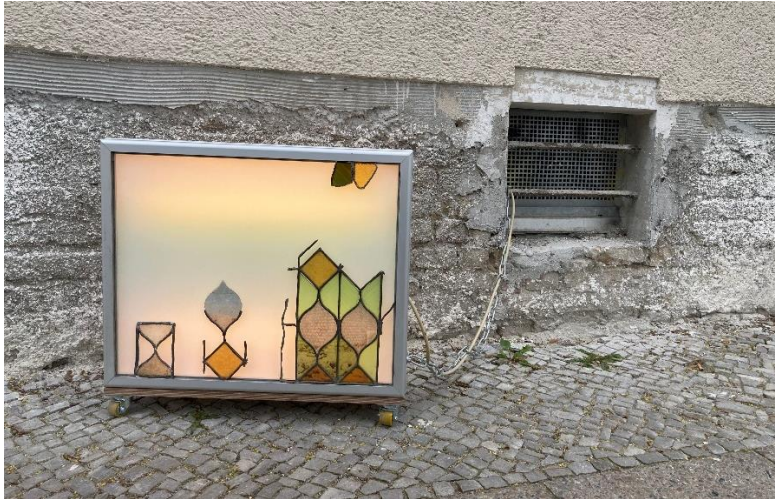
Görsel 16. Salwa Aleryani, An Hour's Long Window, 2021, Die Balkone 2

2021 yılında gerçekleşen ve iki gün süren balkon sergileri projesi Die Balkone'nin ikincisine seksene yakın sanatçı katılmış, bu sanatçıların bir bölümü önceki projede yer alan isimlerden oluşurken, projenin ilkinde olmayan yeni iş birlikleri ve isimler de ikincisinde yer almıştır 3 . Bu isimler arasından amaçlı eleman örnekleme ile seçilen 5 sanatçı projenin ilkinde yer alan ve araştırma kapsamına dahil edilen sanatçılardır ve bu yolla pandeminin normalleşme dönemi ile tam kapanmanın olduğu ilk dönem arasında üretim biçimleri, kullandıkları materyal ve tekniklerdeki değişim, pandemiye bakış açıları ve pandeminin sanatçı psikolojisi üzerinde etkisi gibi noktalar karşılıklı analiz edilmiştir. Yalnızca ikinci projede yer alan sanatçılardan oluşan evrenden seçilen 4 çalışma/yerleştirme ise yapılan karşılaştırmada elde edilen bulguları doğrulamak amaçlı rastgele eleman örnekleme ile araştırmaya dahil edilmiştir.