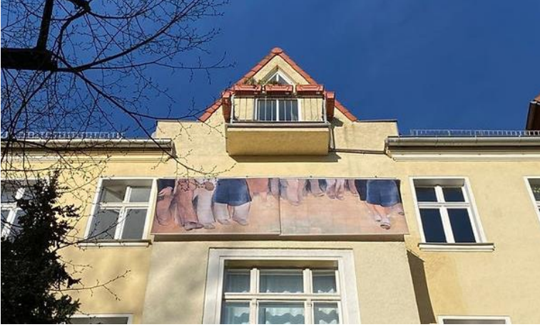
Görsel 3. Ulf Aminde, Footwork, Max Lingner Caddesi, “Yaşam, sanat, pandemi ve yakınlık projesi (Life, Art, Pandemic and Proximity)” balkon sergisi, 2020

sanatçı cephesinden pandeminin dönüştürücü etkisine bakıldığında, Ulf Aminde için karamsarlıktan uzak görülmektedir (DieBalkone, 2020).