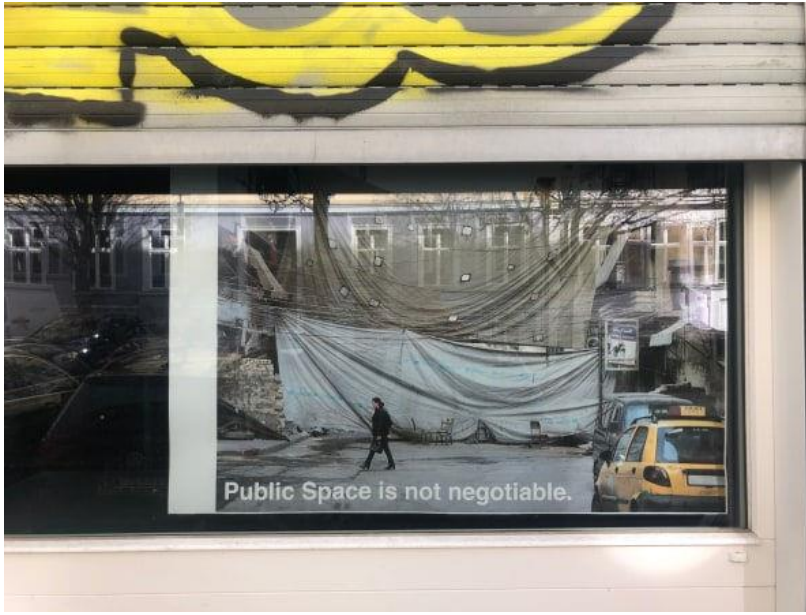
Görsel 2. Markus Miessen & Lena Mah, Public space is not negotiable, “Yaşam, sanat, pandemi ve yakınlık projesi (Life, Art, Pandemic and Proximity)” balkon sergisi, 2020

çalışmasında da pandemiye ve kapanma sürecine bir sitem ve hoşnutsuzluk dikkati çeker; kabulleniş yerine geçmişe duyulan özlem ve eskinin gelişini bekleyiş vardır (Görsel 1).