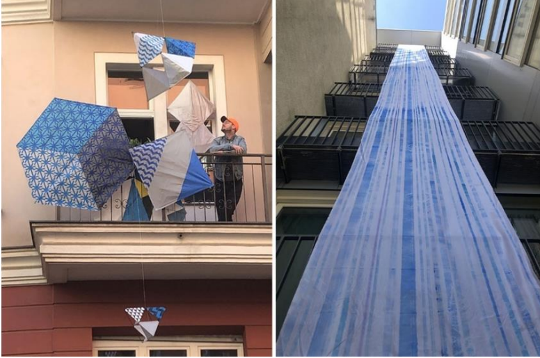
Görsel 8. Raul Walch, “Yaşam, sanat, pandemi ve yakınlık projesi (Life, Art, Pandemic and Proximity)” balkon sergisi, 2020

çıkışı ve kapanmanın başlamasından itibaren tüm dünyada yaşanan temel ihtiyaçlara yönelik market saldırıları ve söz konusu tüketim ürünleri arasından özellikle kağıt ürünlerinin alınıp evlerde depolanması vardır. Sanatçının mavi zemin üzerinde vurgulamış olduğu beyaz çizgiler ve çalışmanın tüm binayı kaplaması binada yaşayanların evlerindeki bu malzemelerin bolluğunu ve pandeminin yarattığı karmaşaya eklenen bireysel ve toplumsal korkuları da eleştiren bir karaktere sahiptir. Walch'ın pandemiye eleştirel ve ironik bakış açısıyla yaklaşması ve projeye katıldığı tasarımlarda kullandığı nitelik ve renk unsurları bakımından olumsuz bir tutum içerisinde olmadığı görülmektedir. Sanatçının kamusal alan ve binanın mimari unsurlarını yeniden tasarlaması ile pandeminin karamsar ve karanlık duygu-durumu ile binanın soğukluğu da ortadan kalkarken kullandığı rengin dinginliği ve malzemenin akışkan yapısı geleceğe ilişkin bir umudu da beraberinde getirir. Bu kapsamda sanatçının psikososyal durum değişkenleri incelendiğinde pandemi koşullarını kabulleniş ve bunu yaratıcılığa dönüştürme, mekanın işlevsel değişimi, dönemin toplumsal alışkanlıklarına derin bir eleştiri ve ironik temsil yöntemi gibi göstergelere ulaşılmaktadır.