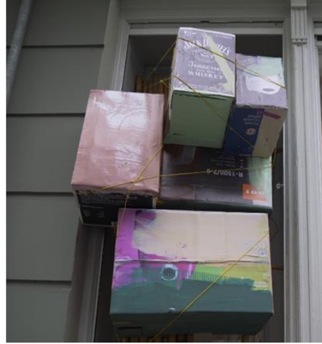
Görsel 18. Knut Eckstein, International Bondage, 2021, Die Balkone 2