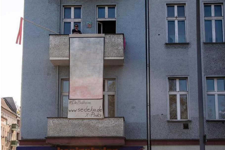
Görsel 7. Isabella Sedeka & X-Pinky, “Yaşam, sanat, pandemi ve yakınlık projesi (Life, Art, Pandemic and Proximity)” balkon sergisi, 2020

yalnızlaşan duvarları, insansızlaşan binaları yeniden canlandırma ve pandemi döneminin karamsarlığı ile ilişkilendirme gibi bir rol üstlenmiştir (DieBalkone, 2020). Bu nedenle sanatçının pandemiye bakış açısının geçmişi çağrıştıran ve yalnızlığı anımsatan olumsuz bir durum olarak görüldüğü anlaşılmakta, yaşanan kapanmanın yaratıcılıktan çok yıkıcılığına vurgu yapıldığı görülmektedir. Ancak tüm bu olumsuz bakış açısına karşın eserin mekanda konumlanış şekli ve konunun ele alınış şekli bakımından pandeminin ve beraberinde getirdiği tüm olumsuz duyguların, kapanmanın ve sosyal hakların ortadan kalkışının sanatçı perspektifinde derin bir kabullenişle ele alındığı anlaşılmaktadır. Sanatçının yaşadığı evin pencerelerine yerleştirdiği resimler yoluyla okunabilen savaş yıllarına göndermeler, kapalı panjurlara çağrışım gibi göstergeler, psikososyal durum değişkenleri bakımından incelendiğinde kişisel geçmişi anımsama, değişmeyen zamanı sorgulama, yalnızlaşma ve kabulleniş gibi psikolojik etkenlerle örtüştüğü de analiz edilmektedir.