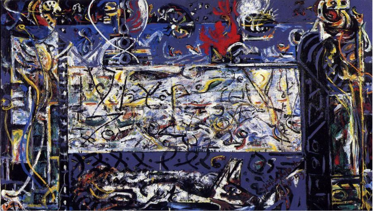
Resim 1: Jackson Pollock, Guardians of the Secret , 1943, tuval üzerine yağlıboya 900 x 578 cm