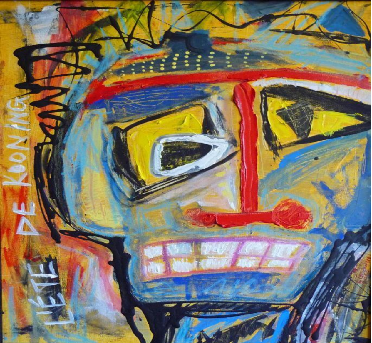
Resim 2: Willem de Kooning, The Absolutely Chaotic Action of Nature , 1951, tuval üzerine yağlıboya, 704x 24 cm