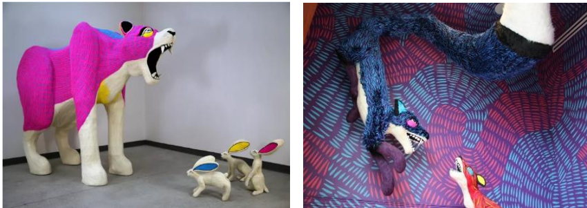
Şekil 5: Ryan Lytle ait tasarımlar Kaynak: https://www.artsy.net/artwork/ryan-lytle-more-than-one-can-bear

1987 doğumlu, Hampton Roads, Virginia bölgesinden Newport News merkezli bir sanatçıdır. Lisans derecesini Christopher Newport Üniversitesi'nden Studio Art ve MFA'sını Maryland Institute College of Art'taki Rinehart Heykel Okulu'ndan aldı. Şu anda iğneleme süreciyle ve besiyerinin çocukluğundaki kapsamlı doldurulmuş hayvan koleksiyonunu anımsatan nostaljik bir rahatlık sağlama yeteneğine nasıl sahip olduğuyla ilgileniyor. Çalışmaları için mitolojilerden, mevcut hayvan arketiplerinden, doğa belgesellerinden ve gözlemlerinden ilham alıyor.