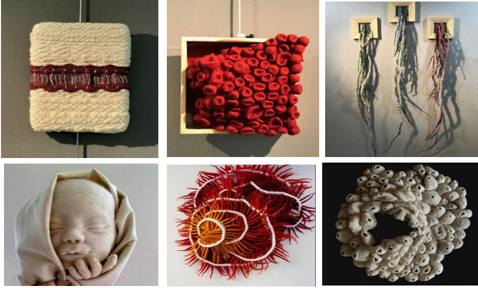
Şekil 6: Tuba Arabalı'ya ait çalışmalar

Tapestry sanatı, dokuma sanatı, lif sanatı, keçe sanatı, üç boyutlu sanatsal tekstiller ve tekstil de tasarımıyla bağlantılı diğer konularda çalışmaları olan Koşar'ın, alanında yayımlanan ulusal ve uluslararası makale ve bildirileri bulunmaktadır. Eserleri, kişisel sergilerinin yanı sıra birçok ulusal ve uluslararası sempozyum, kongre, bienal, grup ve karma sergilerde yer almıştır