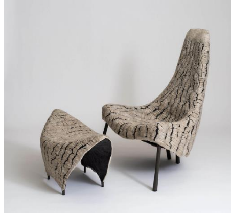
Şekil 1: Keçe ile kaplanmış koltuk Şekil 2: Keçe ile kaplanmış sandalye ve puf