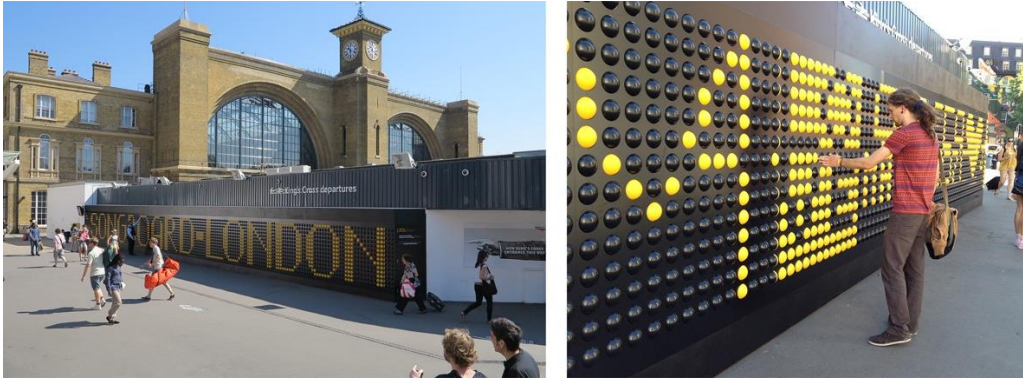
Görsel 8: “Song Board” adı verilen bir çoklu-duyumsal etkileşimli enstalasyon.

Kamusal alanda insanlarla bir etkileşim de sağlayan, onların tipografik ve imgeler oluşturmalarına olanak tanıyan bir örnek 2012 yılında, Londra’da King’s Cross istasyonunun girişinde, 2x35 metre ölçülerindeki, “Song Board” adı verilen bir çoklu-duyumsal etkileşimli enstalasyondur. Bu düzenek tek başına üç boyutlu bir tipografik bir yapı olmasa da üç boyutlu malzemeler ile deneysel tipografik öğeler yaratmaya olanak tanıdığı için etkileşimli bir enstalasyon örneği olarak çalışmada yer almıştır. 2940 adet daireden oluşan duvar ile duvarın yanından geçen insanlarla eğlenceli bir iletişime geçmesi sağlanmıştır (Görsel 8). Bu etkileşimli platformda ziyaretçiler, benzersiz melodilerini oluşturmak için mevcut küreleri ve uygulanabilir melodiler geliştirdiği bilinen sesleri döndürebilirler (publicdelivery.org).