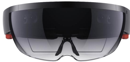
Görsel 16: Microsoft HoloLens