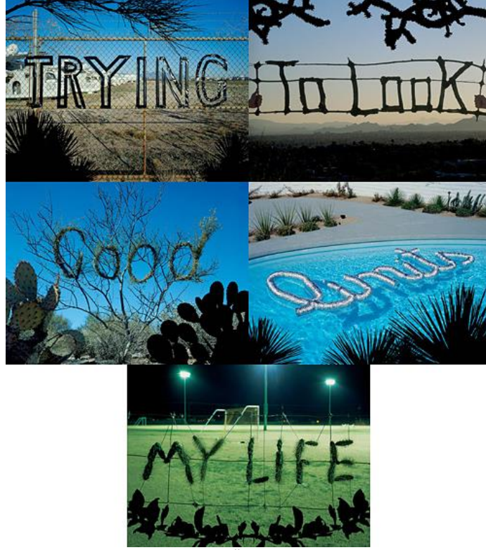
Görsel 7: “Hayatımda Şimdiye Kadar Öğrendiğim 20 Şey” projesinin bir bölümü. “Trying to look good limits my life”

Kamusal alanda insanlarla bir etkileşim de sağlayan, onların tipografik ve imgeler oluşturmalarına olanak tanıyan bir örnek 2012 yılında, Londra’da King’s Cross istasyonunun girişinde, 2x35 metre ölçülerindeki, “Song Board” adı verilen bir çoklu-duyumsal etkileşimli enstalasyondur. Bu düzenek tek başına üç boyutlu bir tipografik bir yapı olmasa da üç boyutlu malzemeler ile deneysel tipografik öğeler yaratmaya olanak tanıdığı için etkileşimli bir enstalasyon örneği olarak çalışmada yer almıştır. 2940 adet daireden oluşan duvar ile duvarın yanından geçen insanlarla eğlenceli bir iletişime geçmesi sağlanmıştır (Görsel 8). Bu etkileşimli platformda ziyaretçiler, benzersiz melodilerini oluşturmak için mevcut küreleri ve uygulanabilir melodiler geliştirdiği bilinen sesleri döndürebilirler (publicdelivery.org).