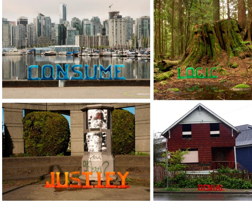
Görsel 9: Nicole Dextras'ın "Signs of Change" isimli kişisel sergisinden, 2016.

Dextras'ın bir diğer çalışması ise Kanada'nın Yukon Nehri üzerinde uyguladığı yine bir farkındalık düzeneğidir. 1896'da üç Amerikalı maden arayıcısının Kanada'nın Yukon bölgesinde önemli miktarda altın bulmasıyla başlayan süreç sonrasında o yıllarda 40.000 kişinin yaşadığı fakat günümüzde 1500'e düşen nüfusuyla madenciliğin bölgeye verdiği zarara dikkat çekmek isteyen Dextras, ahşap bloklara doldurulan suyun donması ile oluşturduğu buz kalıplarla yarattığı "miras" kelimesi çalışmanın bir parçasıdır (Görsel 10). "Legacy projesi şu soruları yöneltti: arazi soyulduktan sonra gelecek nesiller için ne kalacak ve Kuzeyin kırılğan ekosistemini nasıl koruyacağız?" (Dextras, 2019).