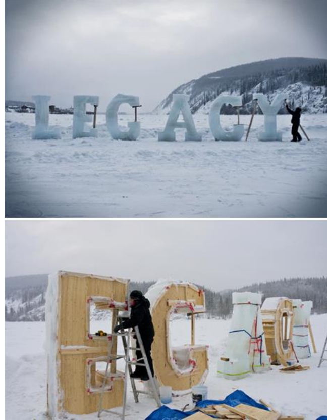
Görsel 10: Yukon Nehri üzerinde buzdan tipografik enstalasyon, Dawson City, Yukon, 2009

Dextras'ın bir diğer çalışması ise Kanada'nın Yukon Nehri üzerinde uyguladığı yine bir farkındalık düzeneğidir. 1896'da üç Amerikalı maden arayıcısının Kanada'nın Yukon bölgesinde önemli miktarda altın bulmasıyla başlayan süreç sonrasında o yıllarda 40.000 kişinin yaşadığı fakat günümüzde 1500'e düşen nüfusuyla madenciliğin bölgeye verdiği zarara dikkat çekmek isteyen Dextras, ahşap bloklara doldurulan suyun donması ile oluşturduğu buz kalıplarla yarattığı "miras" kelimesi çalışmanın bir parçasıdır (Görsel 10). "Legacy projesi şu soruları yöneltti: arazi soyulduktan sonra gelecek nesiller için ne kalacak ve Kuzeyin kırılğan ekosistemini nasıl koruyacağız?" (Dextras, 2019).