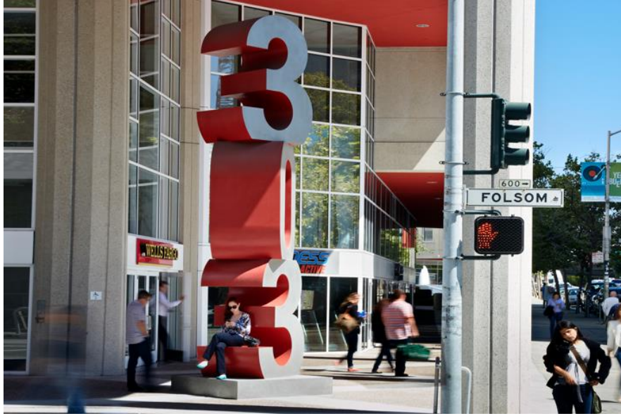
Görsel 2: San Francisco 303 Second Sokağı yer imi heykeli, 2012.