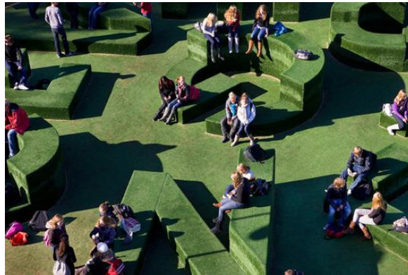
Görsel 13: Vollaerszwart tasarım stüdyosunun yenilikçi tipografik bir peyzaj düzenlemesi.

Hollanda merkezli bir tasarım stüdyosu olan Vollaerszwart, Oldenzaal Thij Kolejinin siparişi üzerine, yenilikçi bir tipografik bahçe tasarımını üstlenmiştir (Görsel 13). Bu bitkisel mekân, sınırlarını zorlayan ve orada okuyan ortaokul öğrencileri için eşsiz bir deneyim sunan özgün bir sosyal alan aynı zamanda bir kent mobilyası haline gelmiştir.