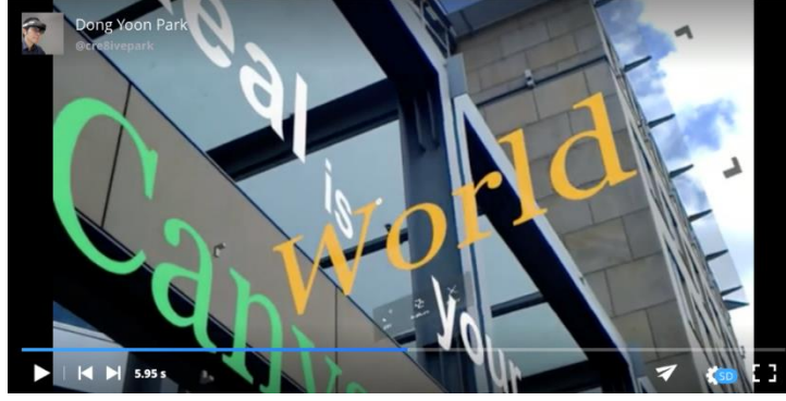
Görsel 17: HoloLens için Insight isimli çalışmanın videosundan bir ekran görüntüsü