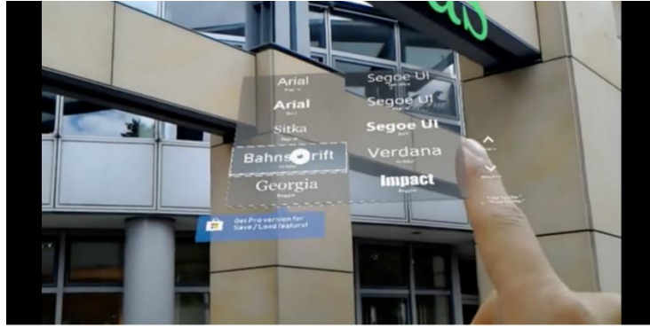
Görsel 18: Kullanıcı ortamdaki yazılara müdahale edebilmektedir