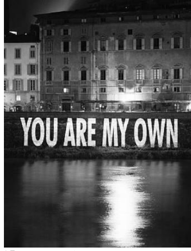
Görsel 15: Jenny Holzer “You are My Own” (2006)

izleyicilerde daha tarafsız bir görüşü etkinleştirmek için olduğunu anlayan güncel sanatçılardan biridir (Heller ve Vienne, 2016: 180). Kamusal alanın görüntü karmaşasından ayrışacak, rahat okunabilen yazı tiplerini, sözcüklerin anlamlarını güçlendirmek için de büyük puntoları tercih eden Holzer, kendi metinleri dışında büyük yazarların metinlerini de kullanmış, kimi zaman yazıları mimari alanlara projeksiyon ile yansıtmıştır (Görsel 15).