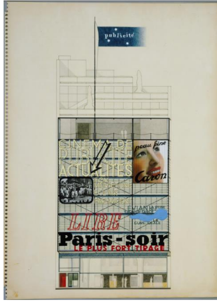
Görsel 14: Oscar Nitzchke, Maison de la Publicité Project, Paris, France (Elevation)

Reklamı doğrudan cephe tasarımının bir parçası olarak kullanan ilk mimari örneklerden biri de, inşa edilmemiş olan Maison de la Publicite (1934-36) yapısıdır (Berry, 2008). Cephe, neon lambalardan oluşan yazıları taşımaktadır.