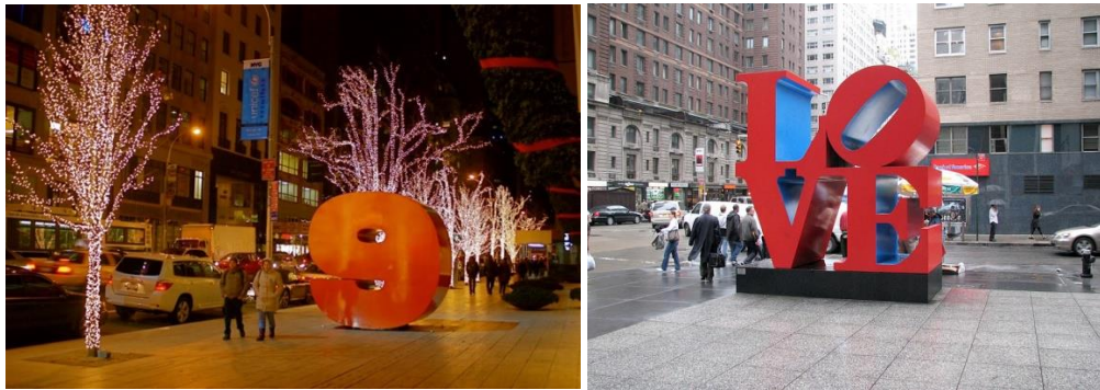
Görsel 4-5: "9" ve "Love" isimli tipografik yer imleri,

1974 yılında Manhattan'da ünlü grafik tasarımcı Ivan Chermayeff tarafından tasarlanan büyük kırmızı "9" isimli yer imi ve ilk kent markalaşma simgesi olarak sayılabilen New York- Manhattan 6. Cadde'de bulunan "Love" isimli tipografik yer imi, dünyada en bilinen yer imlerindedir (Görsel 4-5).