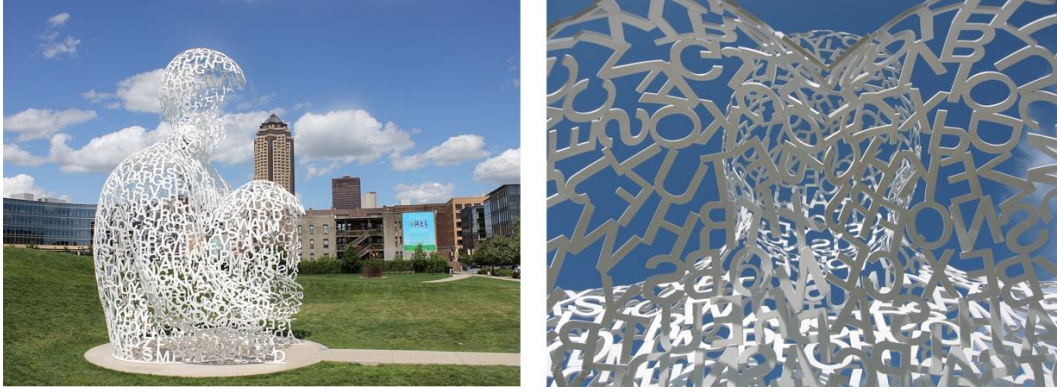
Görsel 1: Yorkshire Sculpture Park- Jaume Plensa tarafından yapılan heykel, 2011

İspanyol heykeltıraş Jaume Plensa'nın ABD'de yer alan Pappajohn Heykel Parkı'nda bulunan "Nomade" isimli boyalı paslanmaz çelikten oluşan tipografik yapıtı (2007) tam anlamıyla modern sanatı halkın ayağına getirmektedir (Görsel 1).