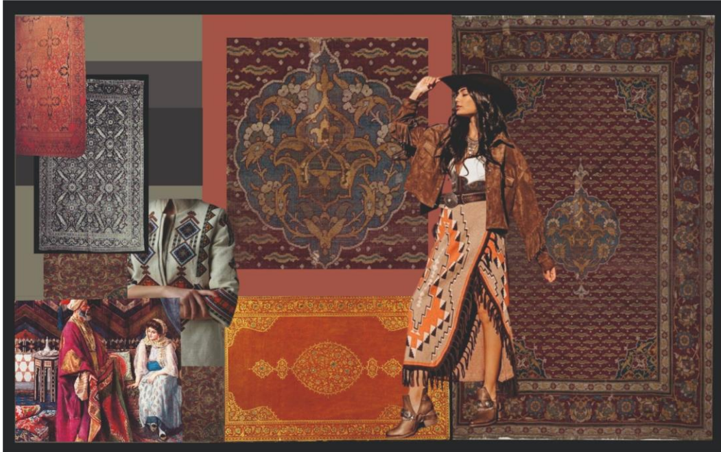
Görsel 6. Halı Kilim Stil Fikirleri