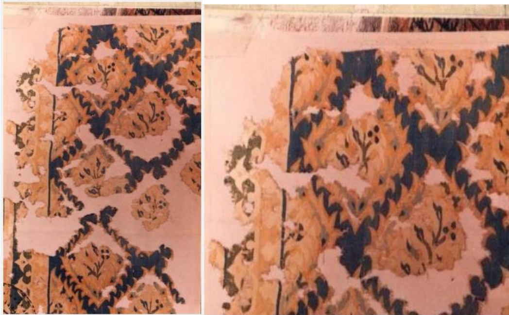
Görsel 4. Osmanlı Saray Kilim Deseni

Yazılı kaynakların birçoğunda desenlerin ilk dokundukları zamanlarda bezeme elemanı olmaktan çok ifade aracı (sembol) olarak şekillendiği belirtilmektedir. Bazı geometrik şekiller, bitkiler, hayvanlar stilize edilerek semboller oluşturulmuştur. Bu sembollerin bazıları zamanla anlamlarını yitirmiş birer bezeme elemanı olarak kullanımı sürdürülmüştür. Önceden belirtildiği gibi, motifler dokunurken sayılabilir duruma getirilmiş, birbirini tamamlayacak şekilde sistematige bağlanmıştır. Öyle ki bazı motiflerin zeminde bıraktıkları boşluklar da motif oluşturur (Özhekim, 2000, s. 150).