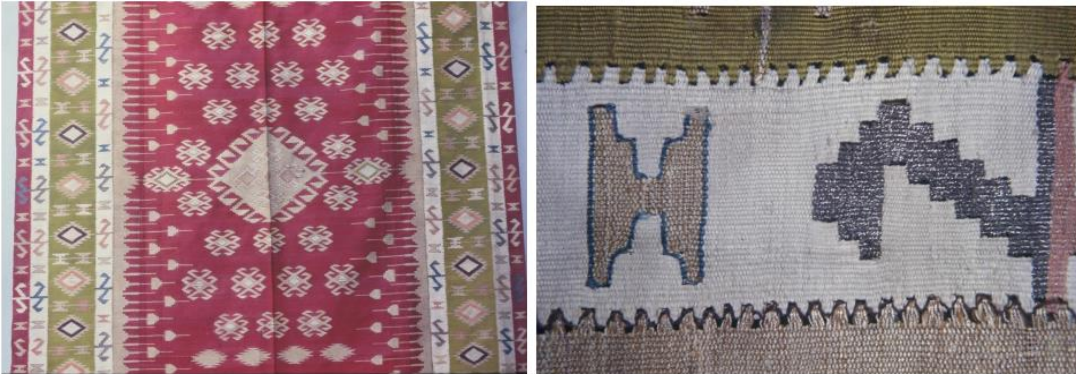
Görsel 2. Saray Kilimi (ilikli) (İstanbul Topkapı Sarayı Müzesi)

Topkapı sarayı koleksiyonunda bulunan ilikli kilim tekniğinde, ipek ve kılaptanla dokunmuş yolluk aşağıdaki görselde yer almaktadır.