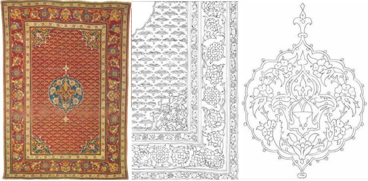
Görsel 5. Osmanlı Saray Halısı ve Desen Çizim

Osmanlı İmparatorluğu'nun ihtişamının kumaş desenlerinde, halılarda, minder kılıflarında ve döşemelik kumaşlarda yeniden kullanılmaya başlandığı görülmektedir. Motifler olduğu gibi kullanılmakla birlikte bazılarının ham maddesi değiştirilerek giysilerde modernize edilmiş, ayrıca motiflerin kompozisyon şemalarının da olduğu gibi kullanıldığı çalışmalar gerçekleştirilmiştir. Bu ürünler incelendiğinde dokuma tekniklerinin haricinde baskı tekniklerinin de kullanıldığı görülmektedir. Kumaşların bir kısmı el tezgahlarında, bir kısmı ise jakarlı tezgahlarda dokunmaktadır.