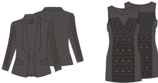
Görsel 8. Kıyafet Tasarım Çalışması (Koyu renkler)

Minimalist yorumların yeniliğine uyum sağlamak için hem motiflerde hem de kumaşlarda beyaz, siyah ve gri tonları kullanılmıştır. Desen yerleşimi Corel Draw programında gerçekleştirilmiştir. Bu sayede desenlerin ürünler üzerindeki etkileri gösterilmeye çalışılmıştır. Tasarımcılar tasarımlarını hazırlarken, tasarımın üretime uygun olmasına özen göstermişlerdir. Tasarlanan ürünlere ait görseller aşağıda sunulmuştur (Görsel 8).