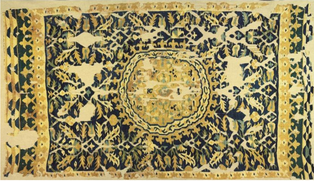
Görsel 3. Saray Kilimi (İstanbul Vakıflar Halı- Kilim Müzesi)

Yazılı kaynakların birçoğunda desenlerin ilk dokundukları zamanlarda bezeme elemanı olmaktan çok ifade aracı (sembol) olarak şekillendiği belirtilmektedir. Bazı geometrik şekiller, bitkiler, hayvanlar stilize edilerek semboller oluşturulmuştur. Bu sembollerin bazıları zamanla anlamlarını yitirmiş birer bezeme elemanı olarak kullanımı sürdürülmüştür. Önceden belirtildiği gibi, motifler dokunurken sayılabilir duruma getirilmiş, birbirini tamamlayacak şekilde sistematige bağlanmıştır. Öyle ki bazı motiflerin zeminde bıraktıkları boşluklar da motif oluşturur (Özhekim, 2000, s. 150).