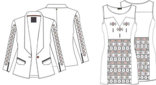
Görsel 9. Kıyafet Tasarım Çalışması (Açık renkler)