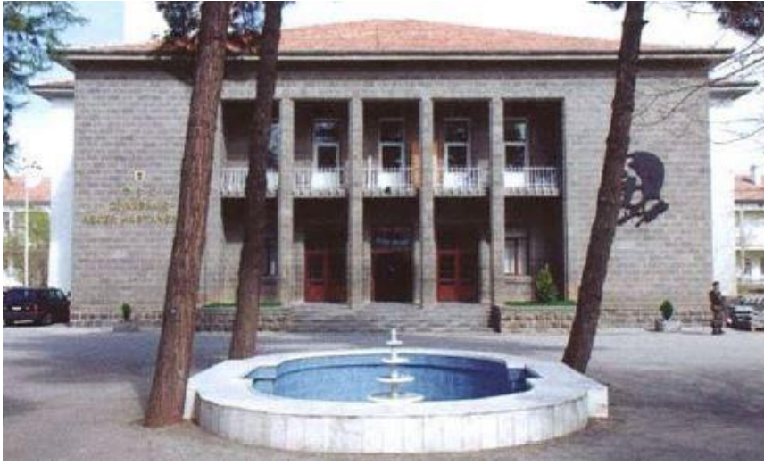
Foto. 10. Diyarbakır Asker Hastanesi (1946-49) (N. Dalkılıç- M. Halifeoğlu)