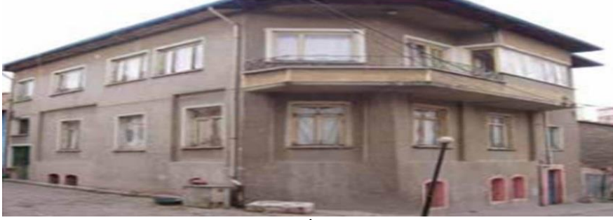
Foto. 13. Eskişehir Odunpazarı geleneksel dokusu içinde İkinci Milli Mimarlık Hareketi sonrası geleneksel etkilerle inşa edilen yapılar (D. Özkut)