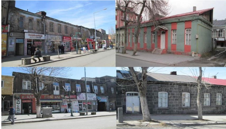
Foto. 12. Kars'ta İkinci Milli Mimarlık Hareketi (1950-70) sonrasında inşa edilen yapıların kentin tarihsel dokusuna katkıları (Y. Çetin)