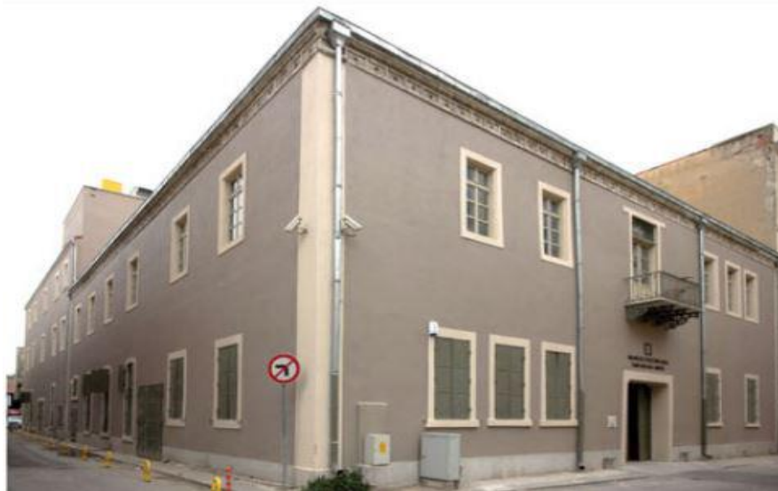
Foto. 9. İzmir Eski Tekel Binası (1950-60)(C. H. Dereli-O. Örün-G. Ertan)