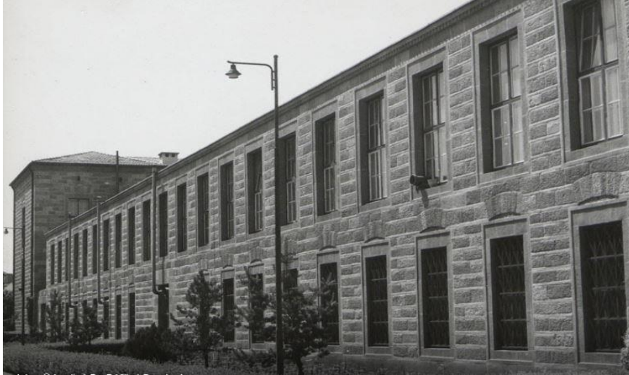
Foto. 5. S. Hakkı Eldem Ankara Üniversitesi Fen Fakültesi Binası (1943-45) (artsandculture)