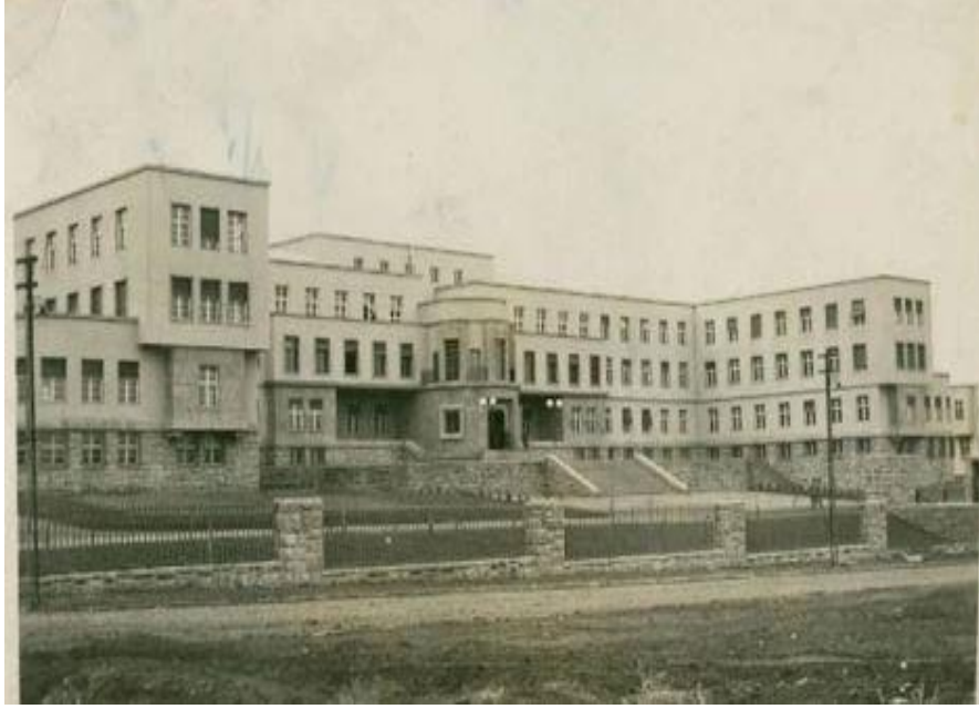
Foto. 1. C. Holsmeister Genelkurmay Binası (1929-30) (D. Laroche)