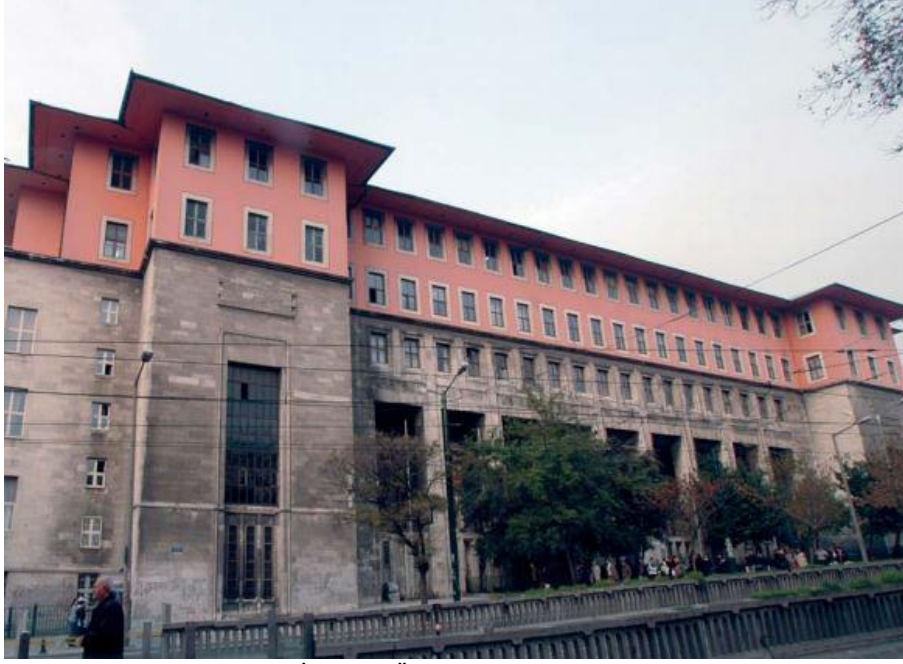
Foto. 4. Emin Ontat ve S. Hakkı Eldem İstanbul Üniversitesi Edebiyat Fakültesi Binası (1943-52) (D. Tekeli)