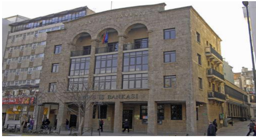
Foto. 11. A. Hikmet Holtay'ın Bursa İş Bankası binası (1950)