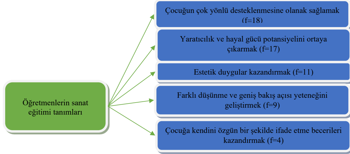
Şekil 1. Öğretmenlerin Sanat Eğitimi Tanımları

Şekil 1. incelendiğinde, öğretmenler sanat eğitimini, çocuğun çok yönlü desteklenmesine olanak sağlamak (f=18), yaratıcılık ve hayal gücü potansiyelini ortaya çıkarmak (f=17), estetik duygular kazandırmak (f=11), farklı düşünme ve geniş bakış açısı yeteneğini geliştirmek (f=9), çocuğa kendini özgün bir şekilde ifade etme becerileri kazandırmak (f= 4) olarak tanımlanmaktadır. Yapılan tanımlamalara ilişkin örnek ifadelerle aşağıda yer verilmiştir.