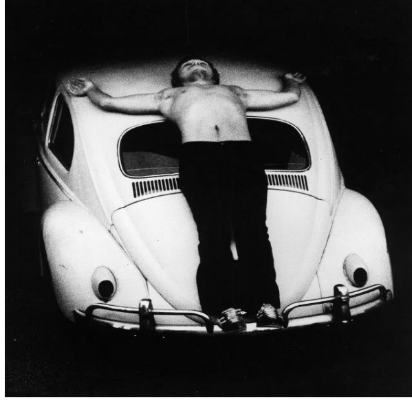
Resim 1: Chris Burden performans