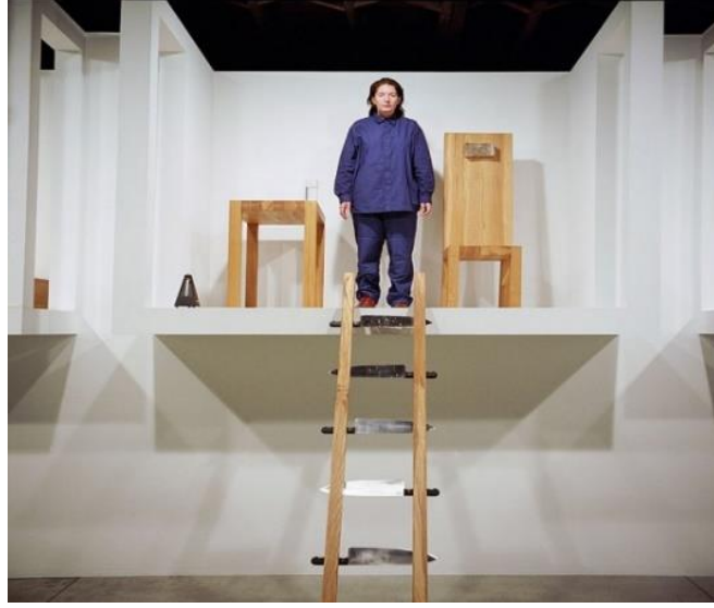
Resim 5: Marina Abramovic “House With The Ocean View”( 06.05.2021)

Performans sanatı ve beden kavramı birlikte düşünüldüğünde akla gelen isimlerden olan Marina Abramovic beden ve zihin kavramını zorlayan hatta hayati tehlikelerde içeren çeşitli performans gösterilerine imza atmıştır. “House With The Ocean View” isimli 2002 yılında New York’ta gerçekleştirdiği performansında bir galeri mekânı içine kurulan özel bir evde 12 gün boyunca yemeden, konuşmadan mahremiyetini herkesin gözleri önüne sererek yaşamıştır. İzleyicilerin onu görebileceği gibi tasarlanan ve 3 odadan oluşan bu özel mekân da sanatçı uyuma yıkanma ve oturma eylemlerini gerçekleştirmektedir. Abramovic’in performansını sergilediği bir sahne gibi dekore edilen bu mekân da mahrem diyebileceğimiz durumlar izleyicinin gözü önüne serildiği için hem hapsedici bir yer olarak hem de özel mekân kamusal mekân arasındaki sınırları yıkan dinamik bir mekân algısı karşımıza çıkmaktadır. Bu performans da sanatçının bedeni mekânın içinde edilgen konumdadır mekânı dönüştürmeye çalışmaz aksine mekânın onu yönlendirdiği şekilde yatma bölümünde yatar, yıkanma bölümünde yıkanır, oturma bölümünde oturur.