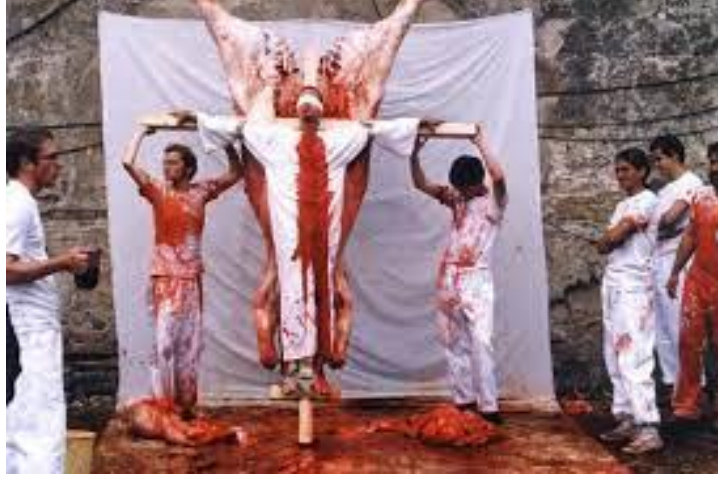
Resim 3: Hermann Nitsch performansı

1980 sonrası beden sanatının en etkileyici örneklerini gerçekleştiren Hermann Nitsch, kendi bedenini sanatsal ifade aracı olarak kullanan sanatçılardan biridir. Sanatçının kendi bedeni üzerinden gerçekleştirdiği performanslarının bir bakıma provoke edici özelliği olduğunu da düşünülmektedir. Sanat ve yaşam arasındaki mesafenin yok edilmesi gerektiğini düşünen Nitsch acı ve iğrenme eşiğinin aşılmasıyla bu mesafenin yıkılacağına inanmaktadır. Sanatçının 1984 yılında gerçekleştirdiği performansıyla ilgili Mehmet Yılmaz şöyle der: “saflığı simgeleyen beyaz giysiler içindeki sanatçı gözleri siyah bir bezle bağlandıktan sonra bir çarşıya gerilmiştir ve bir sığırın iç organları izleyicilerin gözü önünde sanatçının yardımcıları tarafından çıkarılmıştır. “Kalan kanı ise sanatçının üstüne dökmüşlerdi.” 3