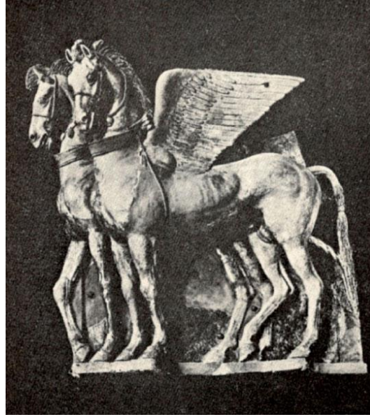
Resim 9: Bir Etrüsk Mabedini Süsleyen iki at (Ayda, 1974; 41).

Önemli bir ayrıntı olarak vermek gerekir ki Resim 9'da bir Etrüsk mabedinde bulunmuş MÖ. 4. Yüzyıla ait ve halen İtalya'da Tarqunia Müzesi'nde sergilenen iki at bulunmaktadır (Ayda, 1974: 41). Bu atların kuyruklarına baktığımızda kuyrukların Orta Asya geleneklerinde Türklerin yapmış olduğu şekilde bağlanmış olduğunu görebiliriz. Dolayısıyla bu kanatlı at heykeline Tulpar diyebiliriz.