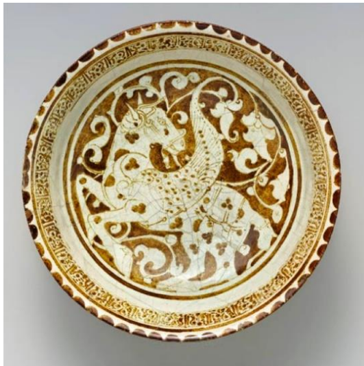
Resim 14: Anadolu Selçuklu Devleti 12-13. Yüzyıl Tulpar Motifli Seramik (22.07.2015, Saat: 05.27, http://www.turkkozmozlojisi.com/2014/06/alaca-atlar-turkler-icin-cok-kymetli-ve_17.html )