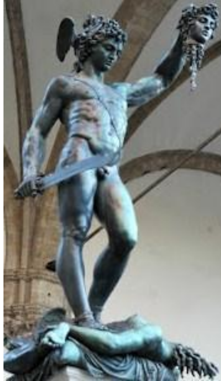
Resim 2. Perseus'un Medusa'nın kafasını kesmesi (MEB, 2013: 32).

Yunan Mitolojisinin efsanevi atı da Pegasustur ve Poseidon'un oğludur. Yunan Mitolojisinde ilk kez M.Ö. 800'lü yıllarda yaşadığına inanılan Homeros tarafından kaleme alınmıştır. Denizlerin büyük tanrısı Poseidon, bir gün gizlice güzeller güzeli Medusa'yla Athena'nın tapınağında zorla birlikte olmuştur. Athena, Poseidon'un bu hareketi karşısında kendini aşağılanmış hissedip Medusayı cezalandırmaya karar vermiş, Onu ve kız kardeşlerini yüzlerine bakılmayacak çirkin bir hale çevirmiştir. Medusa'nın her bir saç teli bir yılan şeklini almıştır. Bununla yetinmeyen Athena, Perseus'tan Medusa'nın başını almasını istemiş Kahraman Perseus'da hemen emiri yerine getirmiştir. Kafası kesildiğinde hala gebe olan Medusa'nın başsız vücudundan ölümsüz olan "Pegasus" ve bir dev olan "Khrysaor" dünyaya gelmiştir (MEB, 2013: 32).