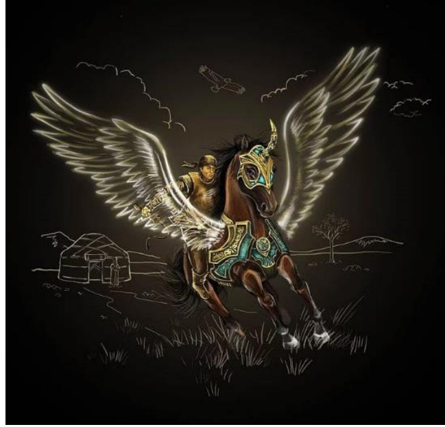
Resim 5: Kurda yem olmayan Tulpar ve üzerinde Türk Savaşçısı