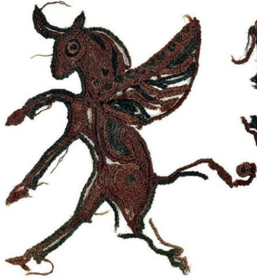
Resim 12: Kazakistan'da bulunan Saka Türk Keçedesinden detay. (14.07.2015, Saat: 02.37, http://www.kimvekil.com/images/turkdunyasi/nuray_bilgili/resimlerle/resimtarikh.html )