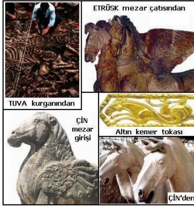
Resim 7. Tuva ve Etrüsk Türklerinin kullanmış olduğu kanatlı at (Tulpar) heykel ve kabartmaları. Çinde de kullanılmış örnekler ile gösterilmiştir (02.06.2015, Saat: 00.47, http://turkclergeliyor.blogspot.com.tr/2014/02/tulpar.html ).