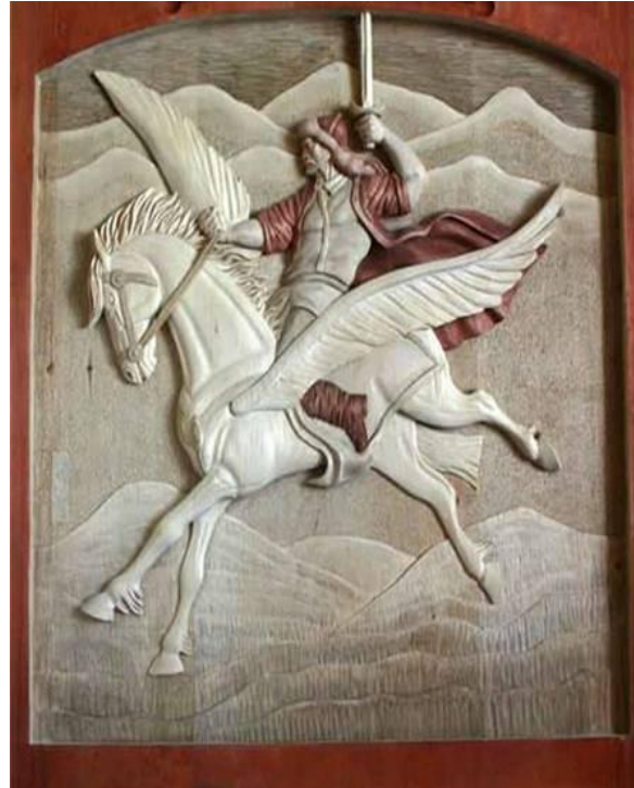
Resim 6. Ural Batır’ın Tulpar üzerindeki tasviri (17.06.2015, Saat: 14.30, http://onturk.org/tag/mit/ )