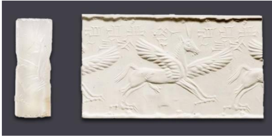
Resim 8: Silindir mührü, pençe ve boynuzlu kanatlı atlarla modern izlenim, M.Ö. 13. Yüzyıl Orta Asur tarzı, Kuzey Mezopotamya (Metropolitan Sanat Müzesi), (05.07.2015, Saat: 03.07, https://semrabayraktar.blogspot.com.tr/2013_10_01_archive.html ).