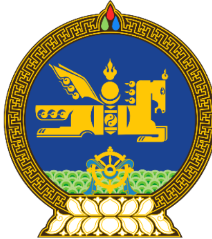
Resim 11: Moğolistan Devlet Armasındaki Tulpar