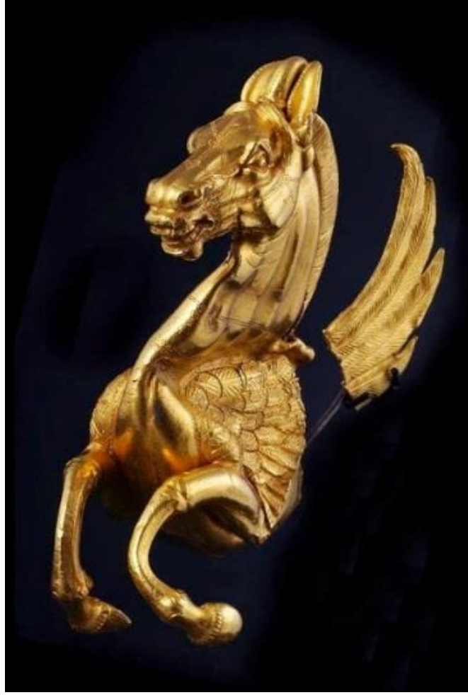
Resim 15: Trakya bölgesinden çıkarılan bir Tulpar Heykeli (22.07.2015, Saat: 08.17, http://semrabayraktar.blogspot.com.tr/2013/10/tulpar-pegasusun-atasi.html )