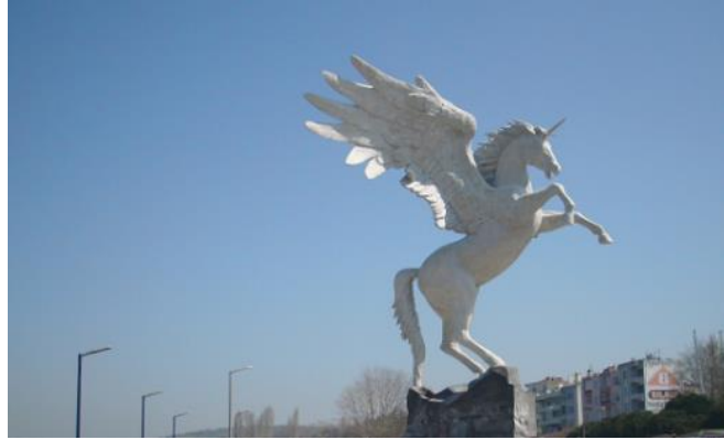
Resim 13: Lapseki'de bir Tulpar Heykeli (14.07.2015, Saat: 03.04,)