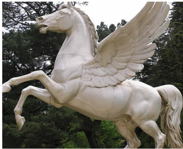
Resim 3. Pegasus (MEB, 2013: 32).