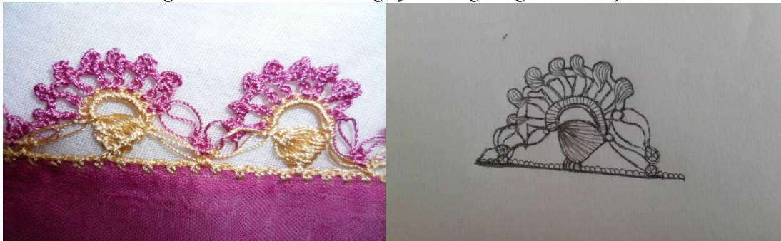
Fotoğraf 4. “Küpelı” motifli tığ oyasından detay görünüm ve çizim.