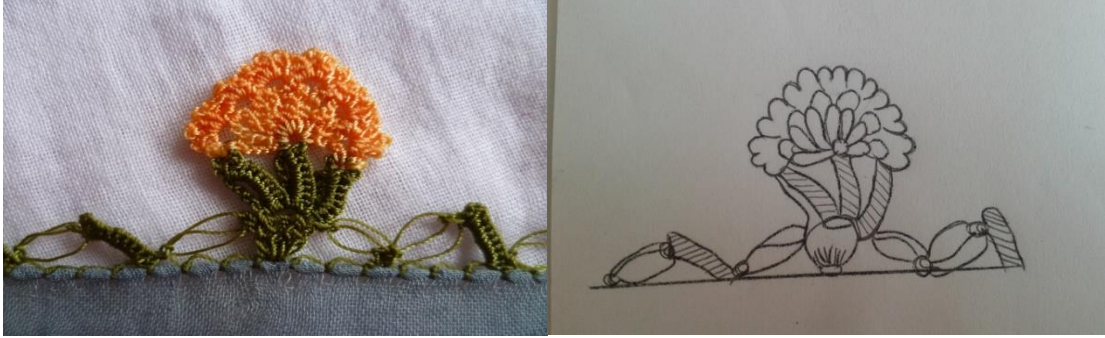
Fotoğraf 7. "Buket Oya" motifli tığ oyasından detay görünüm ve çizim.