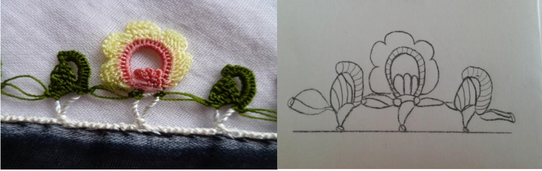
Fotoğraf 6. "Bademcik Oya" motifli tığ oyasından detay görünüm ve çizim.