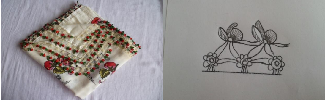
Fotoğraf 3. “Domates” motifli tığ oyasından genel görünüm ve çizim.