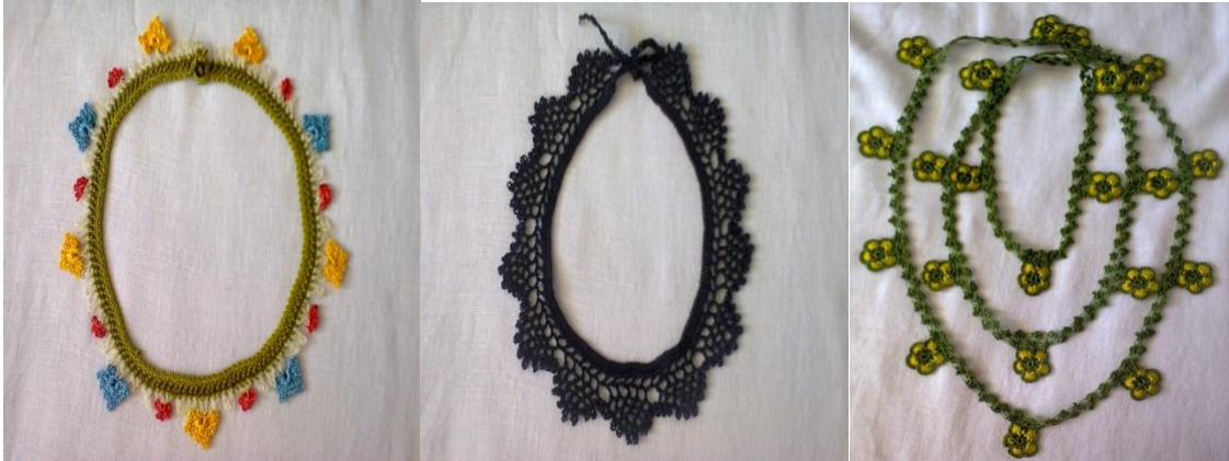
Fotoğraf 8. Tığ oyalardan yapılmış güncel kolye tasarımlarından genel görünüm.