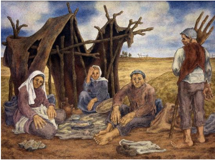
Resim 5. Sorun-Sorum-I, Tuval Üzerine Yağlıboya, 142x195 cm. 1990.

Neşet Günel, resimlerinde seçtiği karakterlerin psikolojik durumlarını izleyiciye yansıtmaya çalışmaktadır. Bunu yaparken resmin plastik ve estetik değerlerinin geçerliliğine de dikkat eder. Sanatçıya göre bu kurguyu açıklamanın en iyi yolu resimlerinde ölçülü abartılar kullanmaktır (Günay,2011). Sorun-Sorum-I isimli eserinde iki kadın iki erkek toplam dört figür yer almaktadır. Figürlerden birisi ayakta üç figür ortada hazırlanmış yemek örtüsü etrafında oturmuş olarak resmedilmiş. Hemen arkalarında derme çatma şeklinde güneşten korunmak için yapılmış bir gölgelik yer almaktadır. Tarlada çalışan işçilerin çalışmaya ara verdikleri bir anı resmettiğini görüyoruz. Yalnız yüz ifadelerinden de anlaşıldığı üzere bir sorun olduğu ve budan dolayı kimsenin ortada bulunan yemekle ilgilenmediğini görüyoruz. Aslında çalışan işçi için yemek molasının güç kazanmak için çok önemli olduğunu biliyoruz.