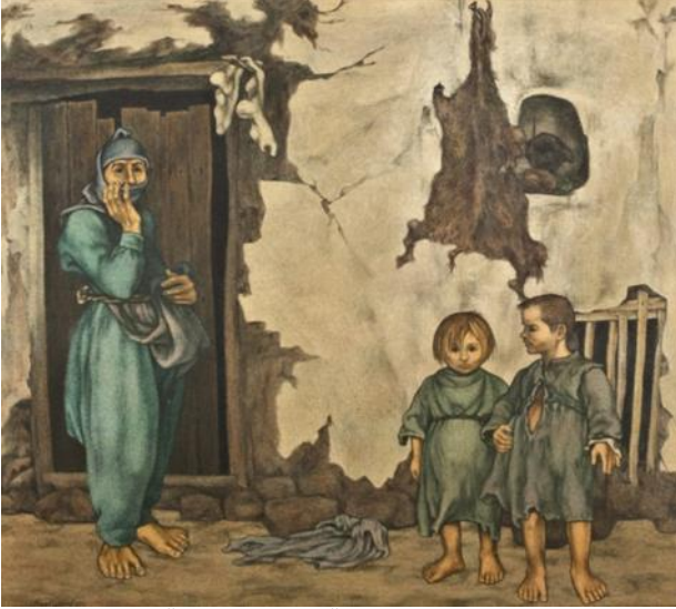
Resim 3. Kapı Önü IV, Tuval Üzerine Yağlı Boya, 150x170 cm. 1977.

1960'lı yıllara kadar Doğu-Batı sentezini gerçekleştirmeye çalıştı. Bronzlaşmış insanlar sarı, yanmış toprağa karışıyor; Eski ve yırtık kıyafetler içinde kolları, gövdeleri ve bacakları açıkta kalan, ayakları çoğu zaman çıplak veya yırtık ayakkabılardan çıkan, büyük kolları ağaç dalları gibi bükülüp kıvrılan, Günal'ın resimlerinde sembolik figürlerdir. (Karabaş, Serttaş, 2016). Günal'ın çocuklar isimli çalışmasında 3 tane çocuk figürünün yer aldığını görüyoruz. Çocuklarının kıyafetleri özensiz, yırtık ve eski bir şekilde resmedilmiş. Yüzlerinde umutsuz, üzgün bir ifade oldukça güçlü bir şekilde yansıtılmıştır. Ayaklarının çıplaklığı, kıyafetlerin yırtıklığı yaşanan yoksulluğu gösterir niteliktedir. Figürler ve arka planda virane bir yapıdan başka bir nesne resimde yer almamıştır. Anadolu çocuklarının saf temiz halini gerçekçi bir biçimde yansıttığı eserlerinden biridir.