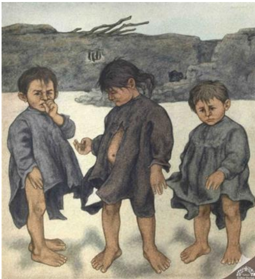
Resim 2. Çocuklar, Kâğıt Üzerine Karışık Teknik,27x27 cm. 1963.

Neşet Günal'a göre gerçekçilik, sanatçının hassasiyet alanına ait, insan ve doğa unsurlarıyla doğrudan ilgili olan görüntülerin yansımasıdır (Koç, Altıntaş, 2017). Anadolu insanının günlük yaşantıları üzerinde durmuş, eserlerinde hem konu hem de figüratif tarzı ile toplumsal gerçekçiliği yansıtmıştır. Çalışmalarına yansıyan sahneler sanatçının doğup büyüdüğü toprakların yansıması olarak karşımıza çıkmaktadır.