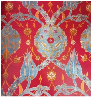
Fotoğraf 2: Osmanlı Dönemine ait lale motifinin yer aldığı bir dokuma örneği. (Atasoy vd. 2001, 69)