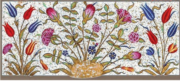
Fotoğraf 4: Kara Memi tezhiplerinde yarı üsluplaştırılmış çiçek desenleri, gül, lale, karanfil (URL 2)

17. yy sonuna gelindiğinde kalın dallar üzerinde çiçeklerin çok renkli hale geldiği, 18. yy'da ise ışık gölge efektleriyle hacim kazanmaya başladığı görülmektedir. Bu dönemde dikkat çeken bir diğer unsur çiçek ressamı olarak da bilinen Ali Üsküdarî'de (fotoğraf 5) çiçeklerin daha farklı yorumlar ile kadife çiçeği, nar çiçeği gibi çiçeklerin de süslemelerde görülmeye başlanmasıdır (Maktal Erbaş 2019, 90,91).