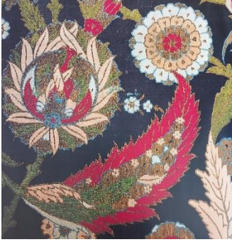
Fotoğraf 1: Osmanlı Dönemine ait Hatayi, penç, yaprak motiflerinin bulunduğu dokuma örneği. (Atasoy vd. 2001, 69)

Hatayi grubu motiflerinden olan Penç motifi, bitki kökenli olup herhangi bir çiçeğin kuşbakışı (üsten görünüş) görüntüsünün stilize edilerek çizilmiş şeklidir (Birol ve Derman, 1995, 47). Çiçeklerin taç yaprak sayılarının, renklerinin ve şekillerinin gözlemlenip, stilize edilerek aktarıldığı pençler, tüm sanat dallarında yüzyıllardan beri kullanılan ortak motiflerdir (Özsoy, 2021, 7). Penç motifleri de Osmanlı döneminde halı, kumaş ve çinilerde çok sık kullanılmıştır.