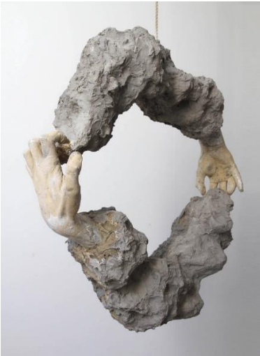
Görsel 5. Haptic Loop serisinden bir çalışma, 2019 (URL 5).

William Cobbing, başını kaplayan kil top tabakasını bir tel ile kesmektedir (Görsel 4). Cobbing bu olasılıkları iyi araştırıyor. Kil heykellerin tarihinin ışığında, kili esas olarak statik ve bir güzellik ve kullanılabilirlik nesnesi olarak gördük. Eserlerinde malzeme, birçok katmanını, çağrışımını ve anlamını ortaya çıkarmak için irdeleniyor. Çalışmaları sıklıkla entropi 4 fikrini araştırıyor. “Benim için entropi, maddeselliğin çözülmesiyle, statik bir nesnenin sonunda nasıl aşındığı ya da bozunduğuyla ve bunu bir tür zamansal maddesellik olarak kucaklamakla ilgilidir. Dolayısıyla videolarımda kil sürekli akış halinde, performanslar döngü halinde ve nihai bir çözüme ulaşılabileceğine dair hiçbir his yok” şeklinde ifade etmektedir. 2020'de ise The Princesshof'ta düzenlenen Human After All grup sergisine katılan sanatçı Hollanda'nın Leeuwarden kentindeki Ulusal Seramik Müzesinde yer almıştır.