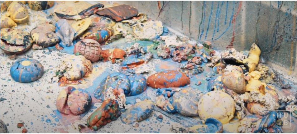
Görsel 13,14,15,16. Başkaya'nın "Veda" İsimli Performansından Görüntüler, 2019 (URL 1).

“Sanatçı, giderek daha açık bir biçimde, işinin seyircileri arasında yaratacağı ilişkiler, ya da toplumsallaşma modellerinin keşfi üzerine odaklanıyor. Bu özel üretim, sadece ideolojik ve pratik bir zemin değil, yeni formel alanlar da ortaya çıkarıyor. Söylemek istediğim, sanat yapıtının özünde bulunan bu ilişki karakterinin ötesinde, insan ilişkileri evrenindeki referans figürlerinin, artık başlı başına birer sanatsal 'form' haline gelmiş olduğu: Böylece, meeting'ler, buluşmalar, gösteriler, insanların çeşitli şekillerde iş birliği yapması, oyunlar, bayramlar, bir araya gelinen yerler, kısacası karşılaşma biçimlerinin ve ilişki keşfetme biçimlerin tümü, bugün oldukları gibi ele alınmaya elverişli estetik nesnelere temsil ediyorlar (Bourriaud, 2005: 46)”