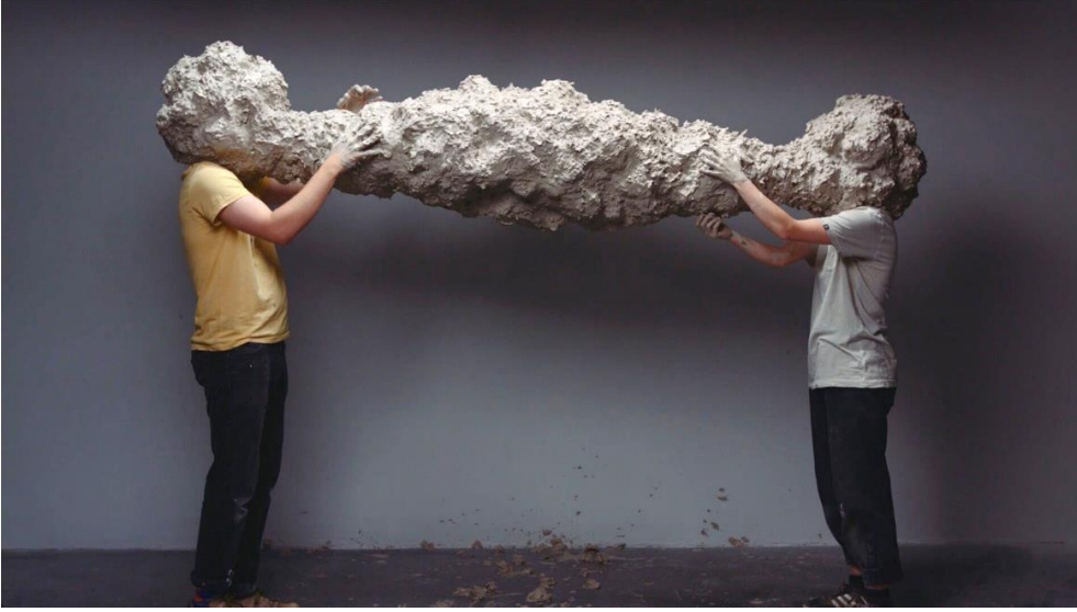
Görsel 6. Uzun Mesafe, adlı performans, 2018 (URL 5).

unsurları ve şüpheleri ortadan kaldırmaya ve böylece işime uygun olana, işin merkezinde olana odaklanmaya yönelttiğinden, bu duyguların daha yoğun olduğunu hissediyorum” şeklinde açıklamaktadır (URL 5).