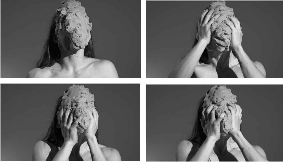
Görsel 8, 9, 10, 11. Papathanasiou Performansı, 2018 (URL 6).

Papathanasion, çalışmalarında hakim olan tema, hem kişisel düzeyde hem de sosyal etkileşim ve sosyal yapılarıdaki yeri açısından "benlik" duygusuyla bağlantıdır. Çoğunlukla cinsiyetsiz hayali kişilikler/karakterler icat ederek, sosyokültürel ve cinsel kimlik konularına ilişkin soruları gündeme getirmek amacıyla kitch ve okült sanatsal kodları kullandığından bahsetmektedir (URL 6). Kalıplaşmış liderlerin imajı/profilinin ve kitlelerden koparak toplumda iz bırakmayı başaran davranış kalıplarının araştırılması ilgisini çekmektedir. Papathanasion'un kendi retorığı ile, modern dünyanın giderek distopik siberpunk versiyonuna doğru hızla ilerlerken, hızla zemin kazanan benlik imajı ve narsisizm konusunu kapsamlı bir şekilde incelemek istediğini ve bir tür psikometrik bir ilgiyle çalışmalarını sürdürdüğünü söylemek olanaklıdır.