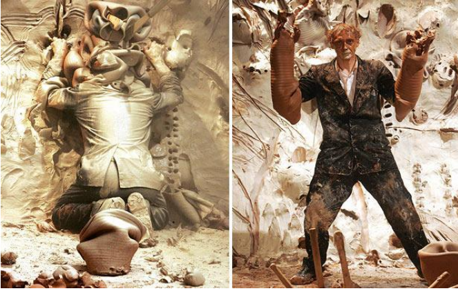
Görsel 1, 2, 3. Borceló'nun "Paso Doble" Performansı (URL 3).

Barceló'yu, İspanya'daki Santa Maria de Palma Katedrali'nde yaptığı devasa pişmiş ve sırlanmış kil müdahalesinden hatırlanabilir; burada, İsa'nın 5.000 kişiyi doyurmasıyla ilgili müjde mucizesine gönderme yapan 300 metrekarelik bir duvar seramiği yaratmıştır. Çalışma, eşit derecede hayranlık ve korku karışımıdır. Nitekim genel bir bakışla da ifade edilirse, kilise, katedral, şapel gibi mabet yapılar bu ikili duyguyu yaşatabilmektedir.