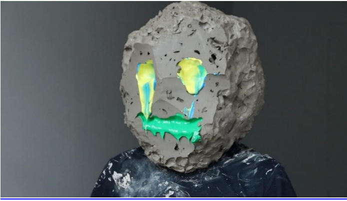
Görsel 4. Cobbing Performansı, (URL 5).

William Cobbing, başını kaplayan kil top tabakasını bir tel ile kesmektedir (Görsel 4). Cobbing bu olasılıkları iyi araştırıyor. Kil heykellerin tarihinin ışığında, kili esas olarak statik ve bir güzellik ve kullanılabilirlik nesnesi olarak gördük. Eserlerinde malzeme, birçok katmanını, çağrışımını ve anlamını ortaya çıkarmak için irdeleniyor. Çalışmaları sıklıkla entropi 4 fikrini araştırıyor. “Benim için entropi, maddeselliğin çözülmesiyle, statik bir nesnenin sonunda nasıl aşındığı ya da bozunduğuyla ve bunu bir tür zamansal maddesellik olarak kucaklamakla ilgilidir. Dolayısıyla videolarımda kil sürekli akış halinde, performanslar döngü halinde ve nihai bir çözüme ulaşılabileceğine dair hiçbir his yok” şeklinde ifade etmektedir. 2020'de ise The Princesshof'ta düzenlenen Human After All grup sergisine katılan sanatçı Hollanda'nın Leeuwarden kentindeki Ulusal Seramik Müzesinde yer almıştır.