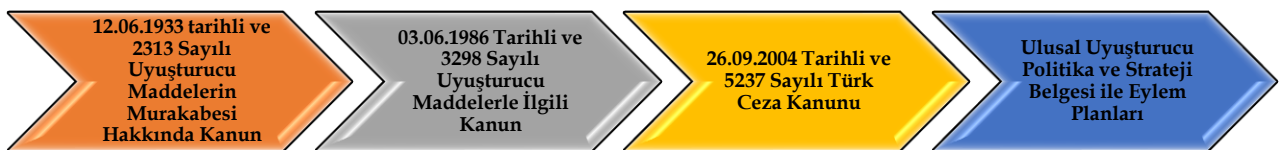
Şekil 1. Uyuşturucu ile Mücadelede Temel Yasalar

Uyuşturucu madde kullanıldığında bireylerin sinir sistemlerine doğrudan etki etme özelliğine sahiptirler. Bu tür maddelerin bireyler tarafından kullanımı fiziksel ve psikolojik bir bağımlılığa neden olmaktadır. Bu durum ise gerek birey gerekse de içinde bulunduğu toplum bakımından sosyo-ekonomik, sosyo-kültürel ve ahlaki alanlarda ciddi problemlerin yaşanmasına neden olmakta ve toplumun genel sağlık ve ahlak yapısına karşı ciddi tehditler içermektedir. Tüm bu nedenlerle uyuşturucu madde ile mücadele noktasında yasal mevzuatın oluşturulması zorunluluğu ortaya çıkmış ve bu kapsamda uyuşturucu maddeler ceza hukukunun da inceleme alanını içerisinde kendine yer bulmuştur. Netice itibarıyla ceza kanunlarında bu maddelere ilişkin çeşitli suçlar ihdas edilmiştir (Yaşar, İçer ve Yazıcılar, 2018: 691). Türkiye’de bunun yanı sıra uluslararası sözleşmelere uygun olarak yürürlüğe konulan iç hukuk mevzuatının dağınık bir yapıda olduğu söylenebilir. Birçok farklı kanunda uyuşturucu madde ile mücadele için yasal düzenlemeler söz konusu olsa da temel anlamda dört başlık altında bu yasal düzenlemeler toplanabilir (TUBİM, 2017: 4):