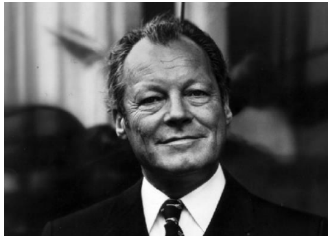
Resim 4. Willy Brandt

Avrupa’nın adalete, toplumsal eşitliğe, özgürlüğe olan özlemi ve mücadeleleri insanlığa modern bağlamı içinde sosyalizm düşüncesini armağan etmiştir. “Sosyal demokrasi” veya “demokratik sosyalizm” anlamları, örtüşmeleri, yakınlıkları ya da uzaklıkları üzerine kuramsal olarak tartışılması gereken sözcükler olmaktan öte, “her şeyin üstünde birçoklarının kendini adlandırdığı güçlü bir ideali temsil eder. İnsanlar kuşaklar boyu onun için kampanyalar yaptılar ve gelecekte de yapmaya devam edecekler” (Gombert, 2017: 8). Willy Brandt Sosyalist Enternasyonal’e veda konuşmasında sosyal demokratlara güçlü taraflarını görmelerini, her çağın kendi cevaplarını aradığını ve başarılı olabilmek adına en iyi şekilde hazır bulunmalarını tavsiye eder (Gombert, 2017: 145). Özgürlük arayışı da çağın gereklerine göre cevapları değişebilen, ilerleyebilen bir husustur.