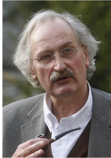
Resim 1. Axel Honneth

Frankfurt Okulu’nun günümüzdeki direktörü olan Axel Honneth’in ifadesiyle sosyalizm düşüncesi Avrupa’da, modern zamanlarda Fransız Devrimi’nin manevi evladı olarak ortaya çıkmıştır. Batıdaki emekçiler, halklar “özgürlük, eşitlik ve kardeşlik” ideallerinin; devrimin bu ilkelerinin hayata geçmediğini ve toplumsallaşmadığını gördüklerinde yüzlerini sosyalizme dönmüştür. 1820’li ve 1830’lu yıllarda yaygınlık kazanan sosyalist ideoloji Avrupa’da Owen, Saint-Simon, Fourier gibi erken sosyalistler 1 ile ilk modern temellerini bulmuştur. Özellikle Owen’ın 1837’de Fourier’yi Paris’te ziyareti akabinde bu büyük öncüler hep beraber kendilerini sosyalist olarak adlandırmaya karar vermişlerdir (Honneth, 2016: 19, 20, 22). Eksik kalan, idealleri yaşamsallaşmayan Fransız Devrimi’nin ilhamı genel anlamda sosyalizmin ve bugün anladığımız anlamda demokratik sosyalizm veya sosyal demokrasinin kuruluşuna dair temel motivasyonu sağlamıştır. İnsanın özgürlük, eşitlik ve kardeşlik arayışının; daha üst ve kavrayıcı bir ifadeyle toplumsal adalet arayışının siyasi izdüşümü sosyalizmdir.