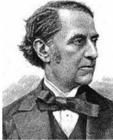
Resim 2. Saint-Simon

Sosyoloji tarihinin klasiklerinden Emile Durkheim sosyolojinin kurucusu olan August Comte’un da üstadı, hocası ve öncülü olan Saint-Simon Kontu Claude Henri de Rouvroy üzerine derslerinde sosyalizm ve komünizm arasındaki temel varoluşsal ayrımı gayet etkili bir şekilde açıklamıştır. ABD’nin ve Batı Bloku’nun Soğuk Savaş dönemindeki anti-komünizm stratejileri Türkiye’de bazı siyasi çevrelerde solun her türünü “komünizm” diye yaftalama eğilimine sebebiyet vermişti. Elbette ki demokratik her ülkede, yasalar ve meşruiyet çerçevesinde komünizm dâhil her ideoloji ve siyasi düşüncenin ifadesi normaldir. Ne var ki, Durkheim’in ifade ettiği gibi sosyalizm ve komünizm temelden farklı siyasi projelerdir. Sağ üst çatısı altında bulunan herkesi faşist ya da nazi diye adlandırmak nasıl absürt ise, her sol görüşlü olana komünist demek de anlaşılabilir değildir. Bugün bu yazdıklarımızı Batı için yüz yıldır aşılış bir tartışmadır. Maalesef biz hâlâ bunlarla uğraşyoruz. Ülkemiz sosyal biliminin gelecek kuşakları şu satırları okuduğunda 20. Yüzyıldan bugüne Türkiye aydınının ne sorunlarla cebelleştğini anlamakta güçlük çekecektir.