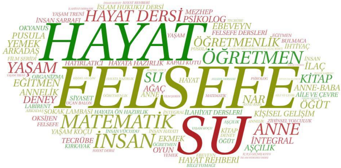
Resim 1. Araştırmada “Eğitim Psikolojisi Dersine” yönelik belirlenen metaforlara ait kelime bulutu

“Eğitim Psikolojisi Dersi uçan balon gibidir. Çünkü insanı ve eğitimi ele aldığı için, psikolojik, biyolojik ve çevresel her alanda bilgi verdiği için heyecan vericidir, merak uyandırıcıdır. Hani uçan balona binerken heyecanlanırsın, merak ve sevinçle binersin ya onun gibi.” (ÖK95)