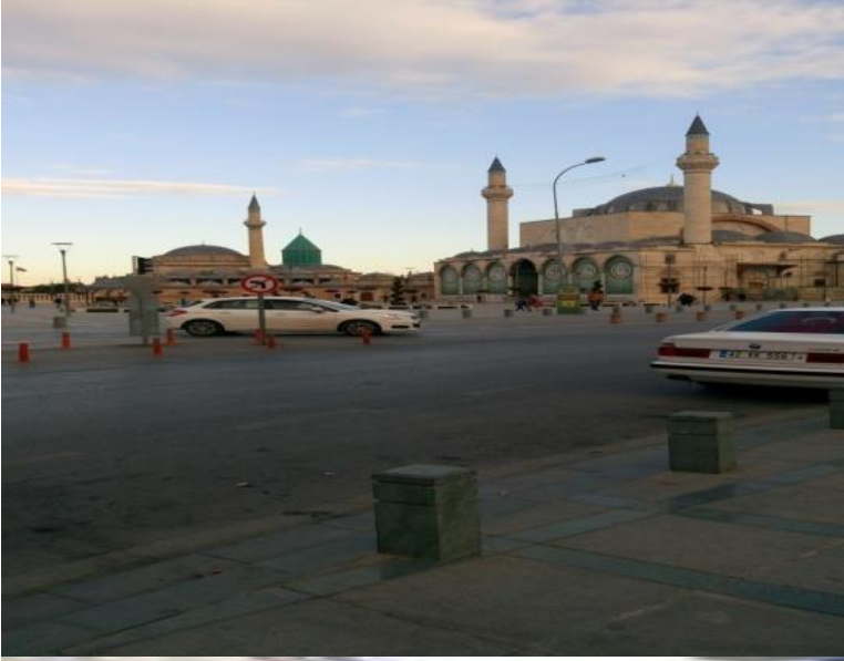
Ek-1: Konya' nın Ticari Mekânları