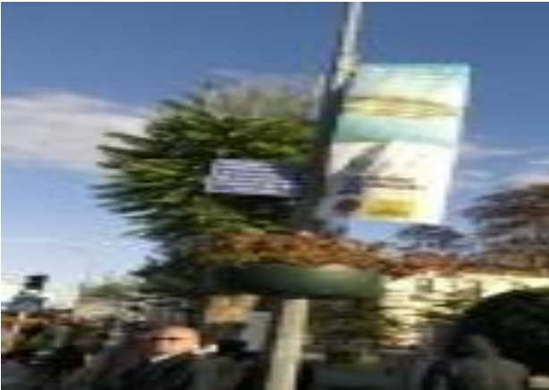
Konya Saman Pazarı Mevkii (Fotoğraf: R meysa Kars)