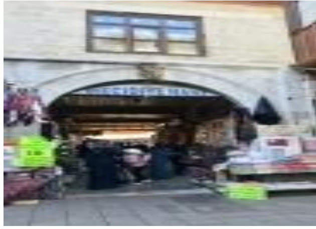
Mecidiye Hanı'ndan Bir Görünüm