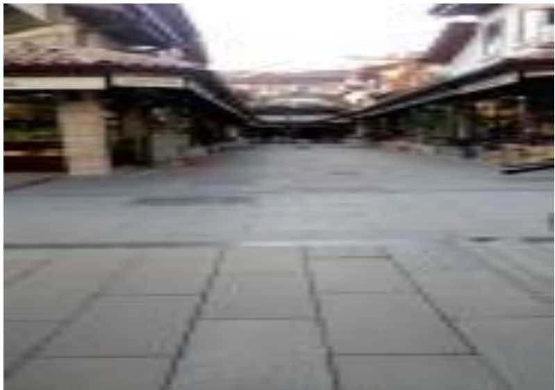
Bugün Bedesten Çarşısı Olarak Bilinen Çarşıdan Bir Görünüm