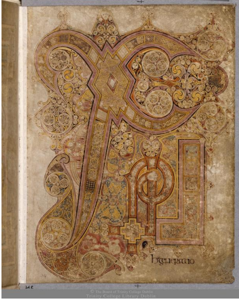
Şekil 3: Book of Kells – Chi-Rho Sayfası, MS 800 civarı

Görselde dönemin kültürüne atıfta bulunan birçok illüstrasyona rastlanılmaktadır. Çalışmada kullanılan illüstrasyonlar ince detaylara sahiptir ve tüm detaylar incelendiğinde bir anlam bütünlüğüne yol açmaktadır.