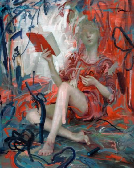
Şekil 7: James Jean, Liber Novus (2009 İllüstrasyon).

James Jean, geleneksel çizim temelli üretim anlayışını dijital baskı olanaklarıyla bir araya getirerek çağdaş illüstrasyon alanında disiplinler arası bir yaklaşım geliştiren önemli bir illüstratördür. Çizimlerini farklı disiplinlere taşıyarak izleyiciye farklı deneyimler sunmaktadır. Sanatçının 2000'lerin başındaki çalışmaları, geleneksel illüstrasyon pratiğine özgü biçimsel özellikler sergilerken, ilerleyen süreçte dijital araçların üretime dâhil edilmesiyle birlikte anlatım biçimi ve görsel yapısı yeniden şekillenmiştir. Söz konusu değişim, radikal bir kırılmadan çok, sanatçının üretim pratiği içerisinde süreklilik gösteren bir gelişim süreci olarak ele alınabilir. Çalışmaları incelendiğinde, sanatçının “Benim için geleneksel ve dijital arasında bir ayrım yoktur. Çalışmadaki en etkili görüntüleri ve ilginç yüzeyleri yaratmak için ne işe yararsa yapsın.” ifadesiyle ortaya koyduğu bakış açısının üretim pratiğiyle büyük ölçüde örtüştüğü görülmektedir (It's Nice That, 2016).