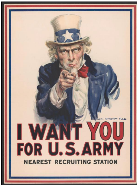
Şekil 6: Flagg, J. M. (1917). I Want You for U.S. Army [Poster].