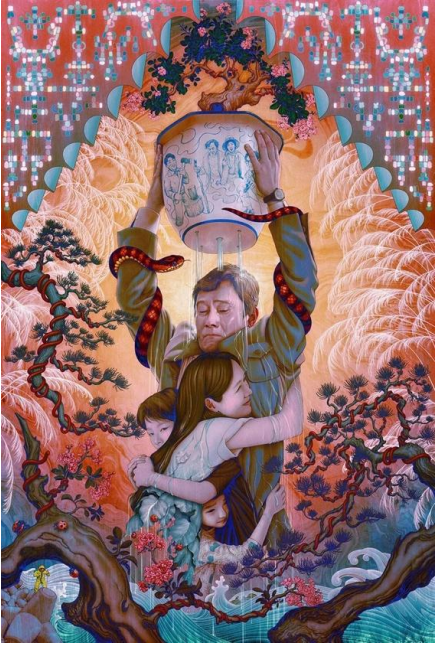
Şekil 8: No Other Choise (2025 Dijital illüstrasyon).