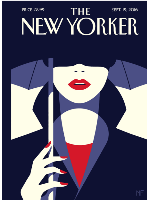
Şekil 9: Malika Favre, In the Shade (Dijital İllüstrasyon).

Malika Favre, cesur renk kullanımı, minimal formlar ve güçlü kompozisyon anlayışıyla çağdaş illüstrasyon alanında tanınan Fransız bir illüstratör ve grafik sanatçısıdır. Güzel sanatlar ile modern tasarım arasında ilişki kuran kendine özgü bir görsel dile sahiptir. Bu yaklaşımı, sanatçıyı çağdaş görsel kültür içerisinde öne çıkan illüstratörler arasında konumlandırmaktadır.