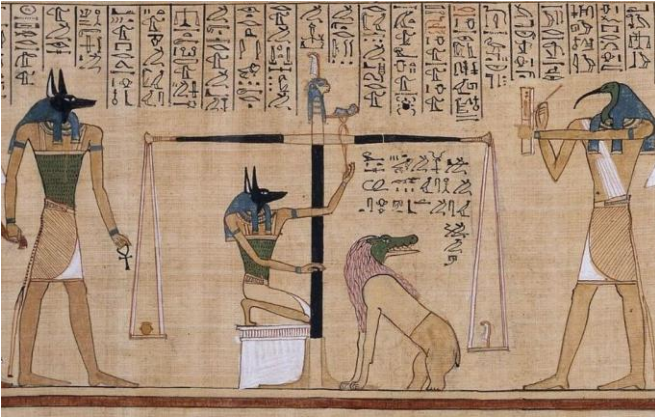
Şekil 2: Book of the Dead (Hunefer Papirüsü) sahnesinden “Kalbin Tartılması” tasviri (MÖ ~1275), Antik Mısır.

https://arkeofili.com/tarih-öncesi-dönemden-11-mağara-sanati/#google_vignette