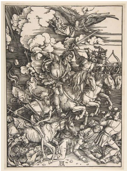
Şekil 4: Dürer, A. (1497–1498). Mahşerin Dört Atlısı [Ağaç baskı].