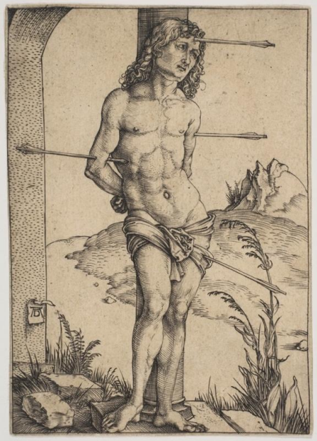
Şekil 5: Dürer, A. (1500). Saint Sebastian at the Column oyma baskı (engraving)