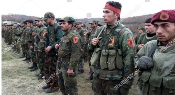
Resim II. Presevo, Medvedja ve Bujanovac Kurtuluş Ordusu (UCPMB) Savaşanları

Resim I'de NLA mensuplarının silahlarını açıktan taşıdıkları ve uzaktan fark edilebilen bir amblemeye sahip oldukları görülecektir. Aynı zamanda NLA'nın Kumanova bölge sorumlusu Sokoli, diğer bölgelerdeki komutanlardan Ramush Haradinaj, Presevo, Medvedja ve Bujanovac Kurtuluş Ordusu'nun (UCPMB) eski siyasi lideri Jonuz Musliu astlarından sorumlu komutanlar kriterinin de sağlandığını göstermektedir. "Çatışmanın bir tarafının silahlı kuvvetleri karşı tarafça tanınmayan bir hükümet ya da otorite tarafından temsil ediliyor olsa bile astlarının davranışlarından işbu tarafa karşı sorumlu bir komutanın emri altında bulunan bütün organize silahlı kuvvetlerden, gruplardan ve birimlerden oluşur" (Ertuğrul, 2018: 378). Bu