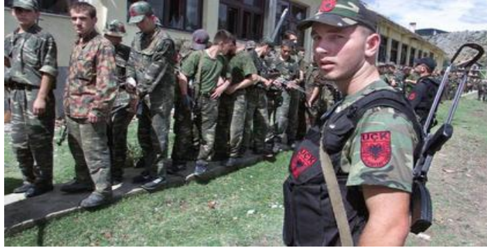
Resim I. Kuzey Makedonya'da Arnavut Militanlar

1907 Lahey Düzenlemelerinin ilk üç maddesinde savaşanlara ilişkin "Savaşın hak ve yükümlülüklerini düzenleyen hukuk, ordular yanında aşağıdaki şartları yerine getiren gönüllü ve milis kuvvetler için de uygulanır. Milislerin yahut gönüllü birliklerin orduyu veya onun bir kısmını teşkil ettikleri memleketlerde, bunlar ordu tarifine dâhildirler; Astlarından sorumlu bir komutan olması, uzaktan fark edilebilir bir amblem ve silahlarını açıktan taşımaları, operasyonlarında savaş hukukuna ve geleneklerine uygun davranmaları" (1907 Lahey Sözleşmesi, Bölüm 1 Md.1)