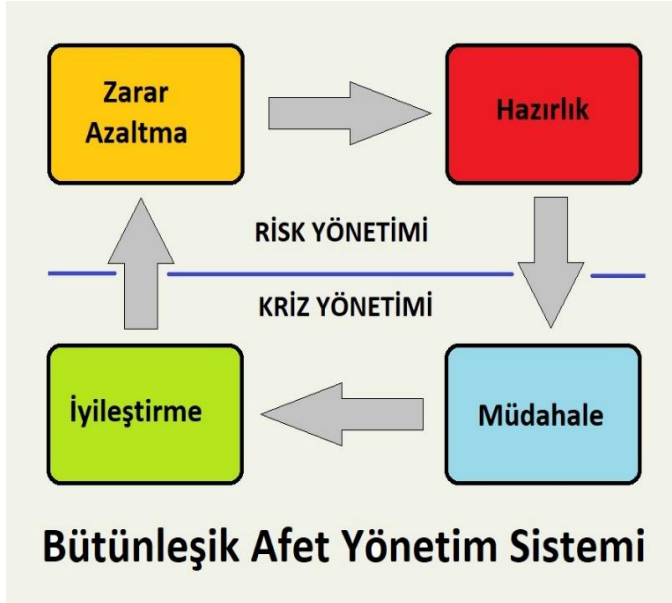
Şekil 2. Bütünleşik Afet Yönetim Sisteminin Döngüsel Şeması

Afet gerçekleşmeden can ve mal kaybı oluşturabilecek doğa, insan veya teknoloji kaynaklı tehditlerin belirlenerek bertaraf çalışmalarının yapılması sayesinde afet sonucu oluşabilecek zararın azaltılması sağlanmalıdır.