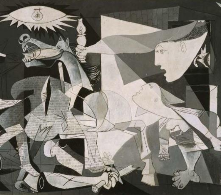
Görsel 10: "Guernica" Detay 3

Picasso bu resminde kulanmış olduğu kompozisyon düzeninde klişeleşmiş bir kalıbın dışına çıkmıştır. Kompozisyonunda kulanmış olduğu güneş ve lamba simgesi resmin merkez dikeyinin soluna düşmekte aynı derecede etkili olan evin beyaz olan duvarı ise kompozisyonun sağ tarafında bulunmaktadır. Kompozisyonda parçalanmış olan heykelin hemen üst tarafında ise bir figür gurubu dikkat çekmektedir.