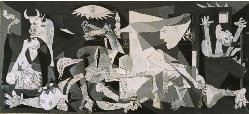
Görsel 5: Pablo Picasso, "Guernica", 1937, 3,5 X 7,8 m, Madrid, Reina Sofia Müzesi.

Guernica isimli resmin ölçüleri 3,5 X7,8 metre olup siyah, beyaz ve gri tonlarda boyanmıştır. Picasso'nun bu resimde bu renkleri kullanmak istemiş olmasında ana amacı çağdaşı olan Kazimir Maleviç'in resimlerinde uygulamaya çalıştığı gerçekleri soyutlamaya çalışmak değildir. Tam aksine resimde hunharca yapılmış olan katliam sonrası ölümü, yıkımı, şiddeti, çaresizliği ve gaddarlığı bunların bir sebebi olmaksızın gösterme gayretinden kaynaklanır. Resmin siyah, beyaz ve gri tonlarda yapılmış olmasının bir diğer nedeni de o dönemde gazetelerin siyah- beyaz basılması ile bir benzerlik sağlanmaya çalışılmış ve savaşın oluşturduğu karamsarlığa da vurgu yapılmıştır (URL 2).