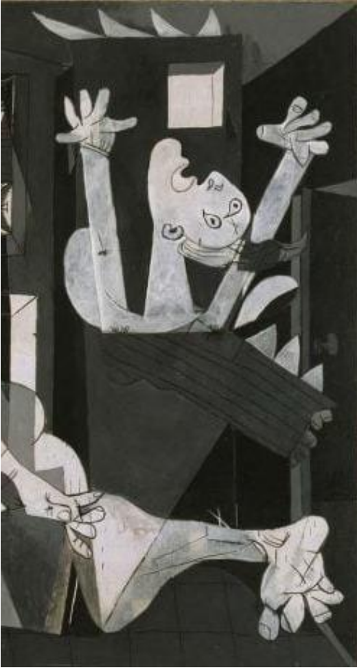
Görsel 12: “Guernica” Detay 4

Boğanın dili, atın dili ve kucagında ölü çocuğu için feryat eden kadın figürünün dili hançer şeklinde simgelenmiştir. Resmin sol uç kısmında ise katliamın dehşeti ile kollarını yukarı doğru kaldırmış bir erkek figürü resmin üst ve alt kısmından ateşle sarılmış bir şekilde betimlenmiştir (URL 4).