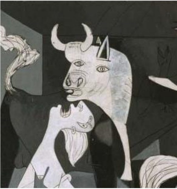
Görsel 13: "Guernica" Detay 5

Guernica resmi siyah beyaz ve tonlarıyla savaşın kasvetini hissettirmekte, insanda yarattığı etki ile savaşın soğuk yıllarına tekrar götürmektedir. Soğuğu, insanlığın bittiği anı ve katledilenleri görmek için çok fazla incelemeye gerek kalmadığı görülmektedir. Bariz bir şekilde insanların ve sivil halkın nedensiz katledilmesini görmek hiçte zor değil. Açık bir şekilde savaştan sesler duyabilir veya savaş sonrası sessizliğin gizemini hissedebilirsiniz (Yorulmaz, 2023,110).