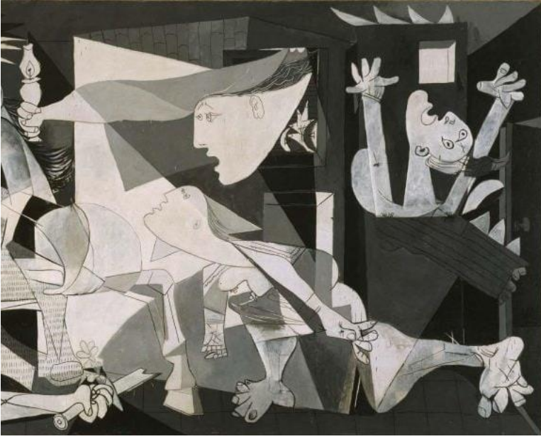
Görsel 9: “Guernica”, Detay 2

Guernica, yatay bir kompozisyon şeklinde ele alınmış yedi figür gurubundan oluşmaktadır. Resmin sağ ve sol tarafı iki betimlemeden meydana gelmektedir. Sağ ve sol tarafta bulunan betimlemelerin orta kısmında bir üçgen dikkat çekmektedir. Resmin orta bölümünde yaralı ve can çekişir bir vaziyette bir at figürü bulunmaktadır. Atın boynu sol tarafa bükülmüş bir vaziyette ve ağzı acı içinde açılmış bir şekilde betimlenmiştir.