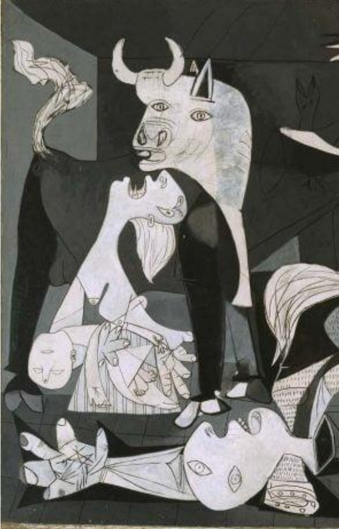
Görsel 8: “Guernica” Detay, (Mollaoğlu, 2023, 212).

can çekişmekte olan bir at figürü, elinde bir gaz lambası ile pencereden sarkmış vaziyette bir insan figürü, boğa figürünün hemen ön tarafında elinde ölü bebeğini tutan bir kadın figürü ve bir ceset göze çarpmaktadır. Ölmek üzere haykırır bir şekilde tasvir edilmiş olan at figürü ile insanın en sadık dostu olan at burada insanlığın yok olduğunu simgelemektedir. İspanya iç savaşı sırasında yaşanan bu katliamın aynı milletin bir gurubunun diğer guruba yaptığı zulmü de simgelemektedir (Ötğün, 2008, 96).