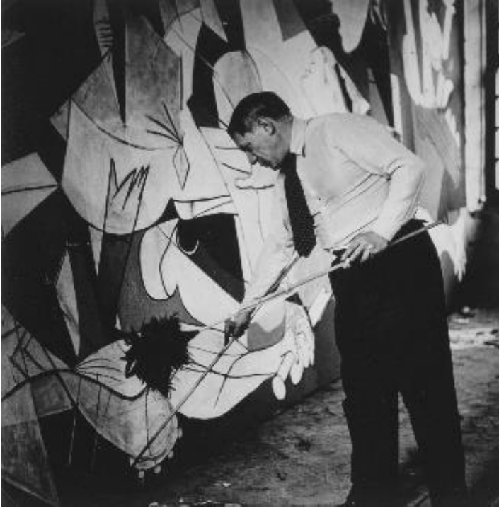
Görsel 2: Picasso "Guernica" Tablosunu Yaparken

Guernica saldırısında tamamen sivil halk hedef alınmış ve bu saldırı sonucunda çoğunluğu kadınlar ve çocuklardan meydana gelen yaklaşık 1645 kişi hunharca katledilmiş ve 889 insan da yaralanmıştır. Bu bombardıman tarihte 2000'e yakın sivil insanın katledildiği ilk hava bombardımanıdır. Picasso yaşanan bu dramatik ve acımasız olay karşısında siyasi tarafsızlığını bir kenara bırakarak yaşanan bu katliama olan tepkisini "Guernica" ismini verdiği ölümsüz tablosu ile ifade etmiştir (URL 1).