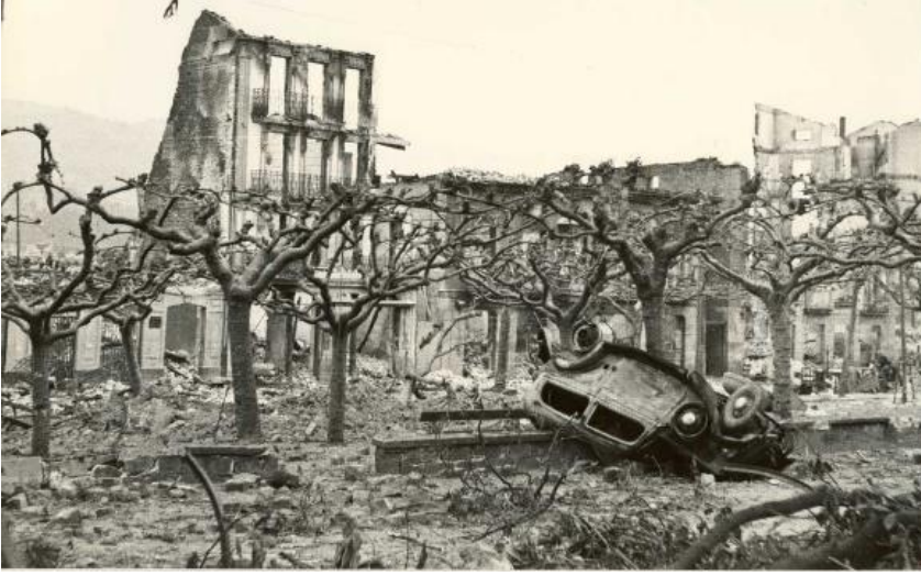
Görsel 3: Guernica Kasabası Bombardıman Sonrası