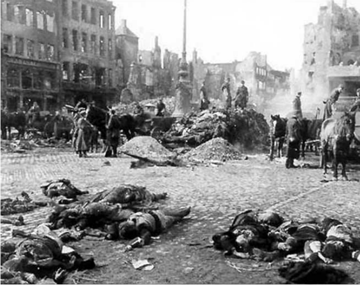
Görsel 1: Guernica Kasabası Bombardıman Sonrası

denemekten başka hiçbir anlamı olmayan Guernica kasabasının bombalanması dört saat kadar devam etmiş ve kasaba üç gün boyunca çok kötü bir şekilde yanmıştır (Kınam, 2020: 1606).