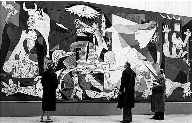
Görsel 14: "Guernica" Müzede

Picasso realist bir çalışma ile Guernica'yı tasvir etmemiştir. Kübizm'in babası olarak izleyiciye kendi tarzını empoze etmiş ve bütün dünyaya bir utanç tablosu bırakarak sanatsal anlamda da büyük ders vermiştir.