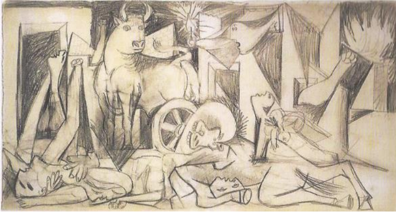
Görsel 11: Guernica'nın Eskizlerinden, 1937

Kompozisyonunda feryat eden kadın figürünü ise boğanın önünde diz çökmüş bir biçimde betimlenmiştir. Resmin kompozisyonunun hemen sağ tarafında ise iki elini yukarıya doğru yalvarır bir şekilde kaldırmış bir figür bulunmaktadır. Kompozisyonda resmin derinliklerine doğru uzanmış görülen farklı çizgiler belirli bir düzeni olmayan perspektif oyunları ile kendisine bir yer bulamamış izlenimi uyandırmaktadır. Işık gölge kullanımı ise kompozisyonda belirsizliği arttırmakta ve belirli olan bir ışık kaynağı görülmemektedir. Kompozisyonda anlatılmak istenen sahne ne içerde ne de dışarda meydana gelmektedir.