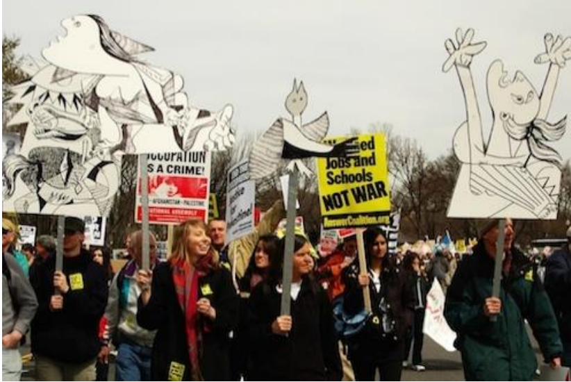
Görsel 7: Guernica’nın Savaş Karşıtı Gösterilerde Kullanımı

Picasso Guernica isimli çalışması ile pek çok tartışmayı da beraberinde getirmiştir. Yapılmış olan bu çalışmanın bir resim mi yoksa poster mi olduğu gibi tartışmaların da fitilini ateşlemiştir. Picasso bu eserinin sergilenmesinden sonra yaşanmış olan katliamı tüm yalınlığı ve ürkünçlüğü ile yansıttığı için burjuva taraftarı sanatçıların ve İspanyol burjuvazisinin eleştirisi oklarına maruz kalmış ve onların antipatisini de sebep olmuştur. Bu haksız eleştirilere maruz kalmasının sebebi burjuvazi yaşamının ihtişamını ve güzelliğini abartılı bir şekilde ele almamış olmasıdır. (URL 3).