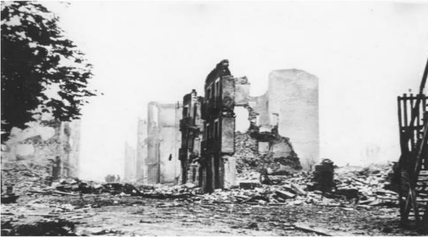
Görsel 4: Guernica Kasabası Bombardıman Sonrası (Tabak, 2022, 57).

Guernica isimli resmin ölçüleri 3,5 X7,8 metre olup siyah, beyaz ve gri tonlarda boyanmıştır. Picasso'nun bu resimde bu renkleri kullanmak istemiş olmasında ana amacı çağdaşı olan Kazimir Maleviç'in resimlerinde uygulamaya çalıştığı gerçekleri soyutlamaya çalışmak değildir. Tam aksine resimde hunharca yapılmış olan katliam sonrası ölümü, yıkımı, şiddeti, çaresizliği ve gaddarlığı bunların bir sebebi olmaksızın gösterme gayretinden kaynaklanır. Resmin siyah, beyaz ve gri tonlarda yapılmış olmasının bir diğer nedeni de o dönemde gazetelerin siyah- beyaz basılması ile bir benzerlik sağlanmaya çalışılmış ve savaşın oluşturduğu karamsarlığa da vurgu yapılmıştır (URL 2).