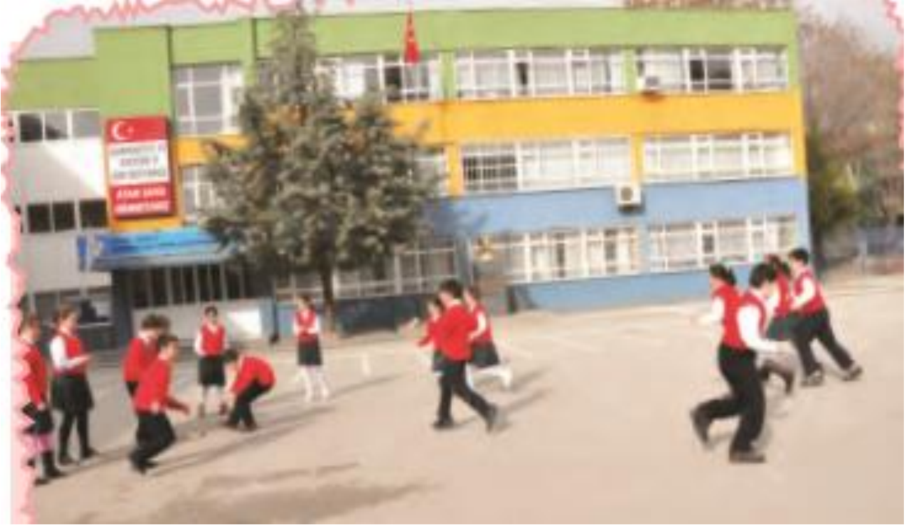
Şekil-1: Yedi Kule(Babadik) Oynayan Çocuklar(MEB,2011)

Bu Oyunun Çocuk Gelişimine Katkılarının Şunlar Olduğu Söylenbilir: