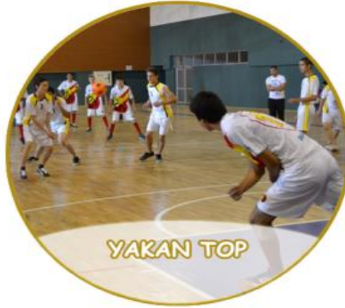
Şekil -4: Yakan Top Oyunu

( https://www.coskf.org.tr/yayin/6/yakan-top-oyunu E.T:17/11/17, s.11:24)