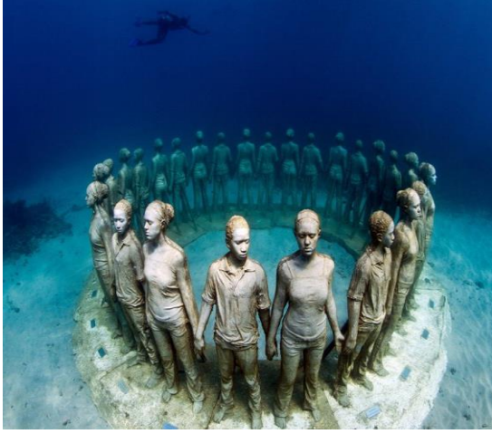
Görsel 1: Olaylar, Grenada