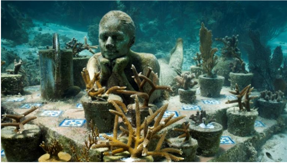
Görsel 4: Bahçıvan, Meksika