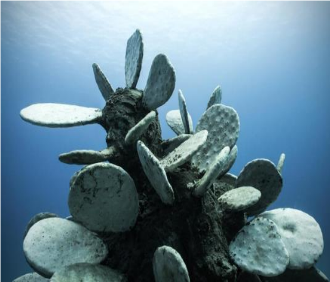
Görsel 7: Hibrit Bahçe, Lanzarote, İspanya

Okyanuslar, kendi döngüsü içinde doğal yaşamını sürdüren-devam ettiren canlılarla doludur. Mercan resifleri de bu döngüye destek olan canlılardır. Resifler deniz canlıların üreme, sığınma gibi durumlarına da ev sahipliği yapmaktadır. Deniz yatağının sadece %10-15'i resiflerin doğal oluşmasına zemin hazırlayan alt yapıya sahiptir. Heykellerin üzerinde oluşan resiflerde deniz ekosistemine destek vermektedir. Böyle doğal resiflerin kendisini onarması ve yenilemesine olanak sağlamaktadır (Görsel 5-6).