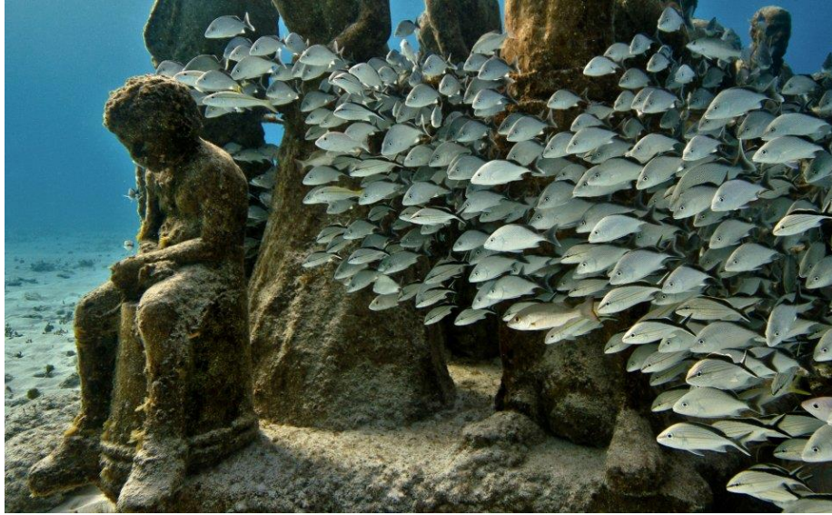
Görsel 3: Jason deCaires Taylor

Gidilip görülen her anda heykeller tavır değiştirmektedir. Canlıların ve okyanusun yaşamsal döngüleri çalışmaların devinimselliğini de etkilemektedir. Dönüşüm geçiren heykeller okyanusun altında yaşama katkı sağlayan, okyanusun altındaki yaşam ile bütünleşen, oraya ait olan parçalar durumunu almaktadır. Kısaca heykeller ilk yapıldığı esnada durumunu kaybetmektedir. Hiçbiri kalıcı değildir (Görsel 3-4-5).