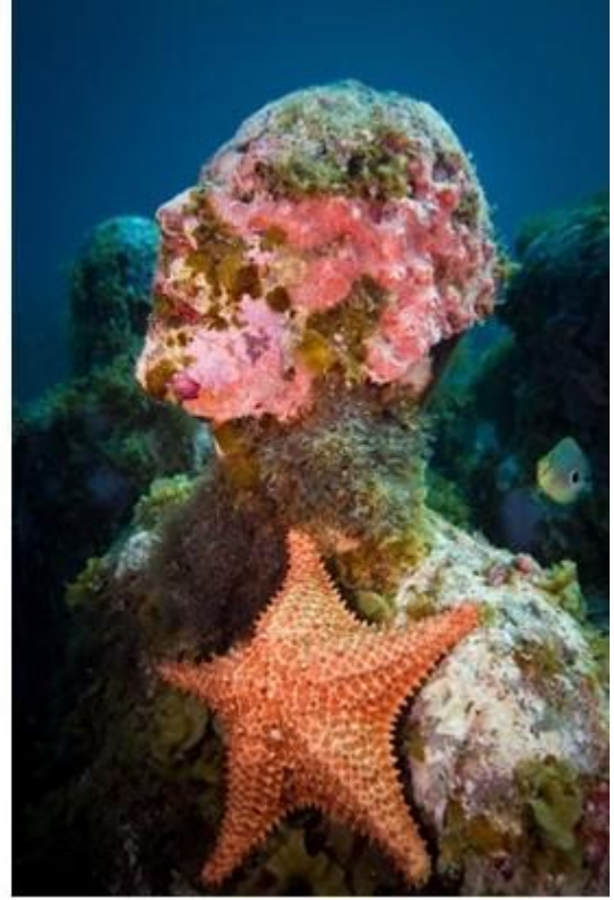
Görsel 6: Olaylar, Grenada

Okyanuslar, kendi döngüsü içinde doğal yaşamını sürdüren-devam ettiren canlılarla doludur. Mercan resifleri de bu döngüye destek olan canlılardır. Resifler deniz canlıların üreme, sığınma gibi durumlarına da ev sahipliği yapmaktadır. Deniz yatağının sadece %10-15'i resiflerin doğal oluşmasına zemin hazırlayan alt yapıya sahiptir. Heykellerin üzerinde oluşan resiflerde deniz ekosistemine destek vermektedir. Böyle doğal resiflerin kendisini onarması ve yenilemesine olanak sağlamaktadır (Görsel 5-6).