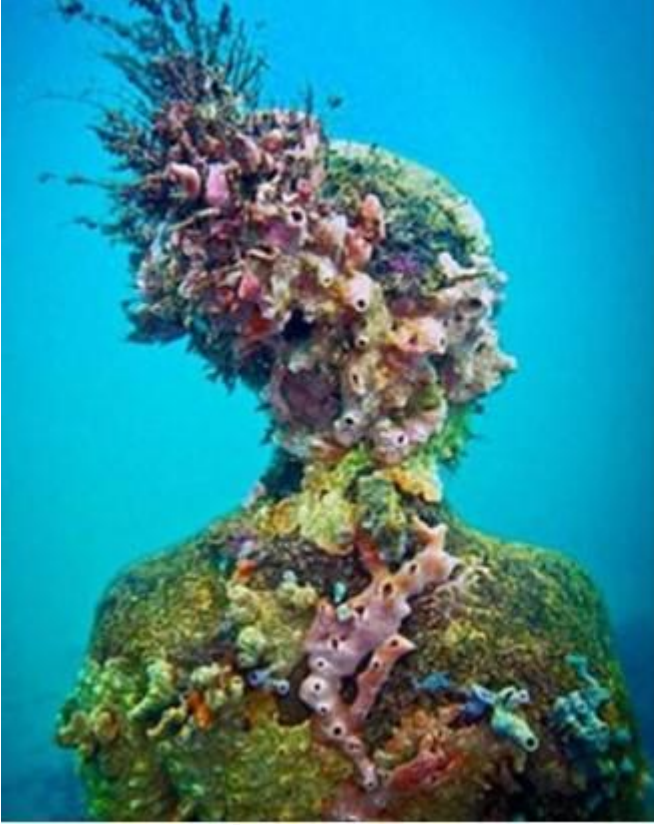
Görsel 5: Olaylar, Grenada