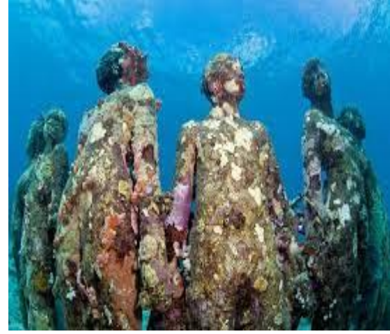
Görsel 2: Olaylar, Grenada

Gidilip görülen her anda heykeller tavır değiştirmektedir. Canlıların ve okyanusun yaşamsal döngüleri çalışmaların devinimselliğini de etkilemektedir. Dönüşüm geçiren heykeller okyanusun altında yaşama katkı sağlayan, okyanusun altındaki yaşam ile bütünleşen, oraya ait olan parçalar durumunu almaktadır. Kısaca heykeller ilk yapıldığı esnada durumunu kaybetmektedir. Hiçbiri kalıcı değildir (Görsel 3-4-5).